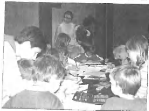
Otroci pri risanju risbice