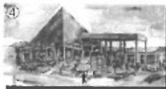
Piramida - OIC