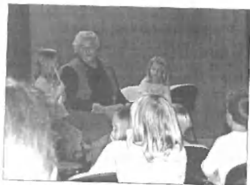
Ada pri prebiranju pravljic

Z veseljem pa lahko na kratko predstavimo tudi že naše naslednje živžave: