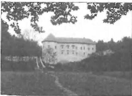
Grad Jablje je primeren tudi za znanstvena srečanja