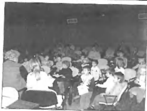
Otroci so pravljici pozorno prisluhnili