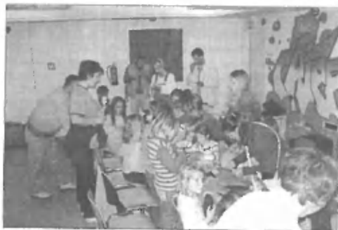
S skupnimi močmi se daleč pride

Vsakič, ko otrok pravi: »Ne verjamem v vile,« nekje dobra vila pade mrlva. (Peter Pan)