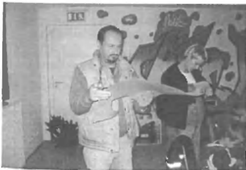
Trije očete se čitajo aktivni - besedni!

Pot nas pelje po zelo prometni cesti brez pločnika, ki jo s težavo varno premagamo. Pred mesecem dni so dobili na nogometnem igrišču asfalt, igrala pa so s pomočjo zelo prizadevne »lokalne« mame izdelali kar »vaški švasarjia«. Ko se vračamo iz igrišča domov, mi misli, ob vpitju na otroke, da naj vendar hodijo ob robu ceste, včasih uidejo na naše lepo igrišče ob Kidričevi cesti, na igrišče pred šolo, na nekaj malih igrišč na javnih površinah. Že mladinski klub, na dvorano Marjanca Ručigaj, na knjižnico... Že majhne otroke moramo naučiti, da so to tudi njihovi prostori, ki ji bodo v kasnejših letih lahko uporabljali v različne namene in