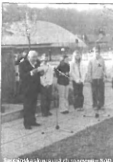
Spominska komemoracija ob spomeniku NOB