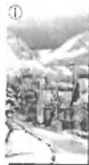
Kamnito kužno - Florijanovo znamenje

Informacije o prireditvah in dogodkih v občini Trzin so vam na voljo tudi v Občinskem informativnem središču na Ljubljanski cesti 12/f oziroma na telefonski številki 01/564 47 30.