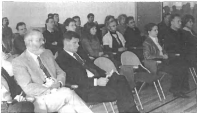
Drugi dan, ki je bil namenjen predstavitvi cone, je bilo obiskovalcev največ.

pa smo predvideli tudi stanovanjsko gradnjo. Med problemi, ki cono spremljajo že ves čas, je treba omeniti nizko nosilnost tal, med sedanjimi pa obremenitve obstoječe komunalne infrastrukture, ki so že blizu maksimalnih,« je dejal Končan.