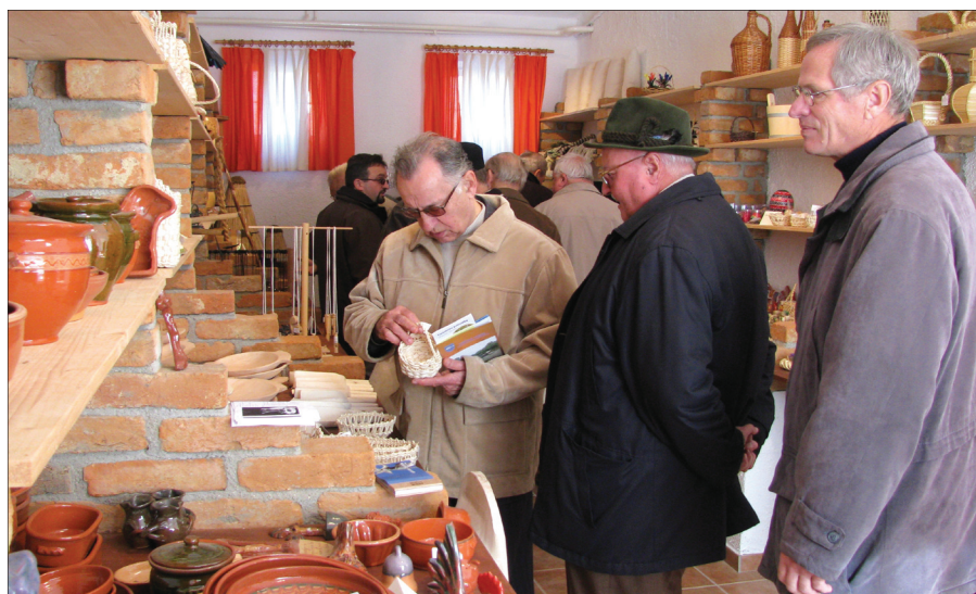
Obisk Društva seniorjev Pomurja

TIC Veržej je organiziral ali sodeloval pri organizaciji različnih dogodkov, tako gostujočih kot tudi domačih organizacij in posameznikov. V okviru Zavoda Marianum smo sodelovali pri organizaciji Kovačičevega in Puščenjakovega večera, Razstave slovenskih