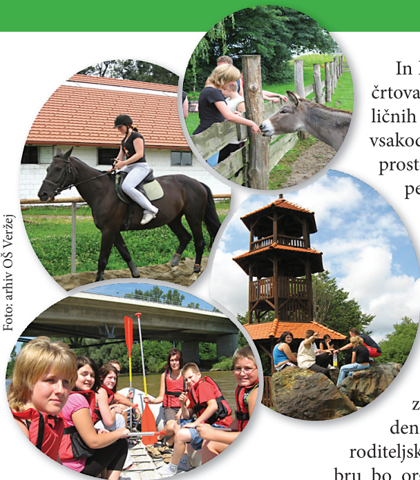
DELČEK POČITNIŠKIH UTRINKOV V SLIKI: Jahanje v Zatonu na Tišini, Prijateljstvo z osličkom, Spust po Muri, Na najvišjem vrhu Prekmurja, Kugli