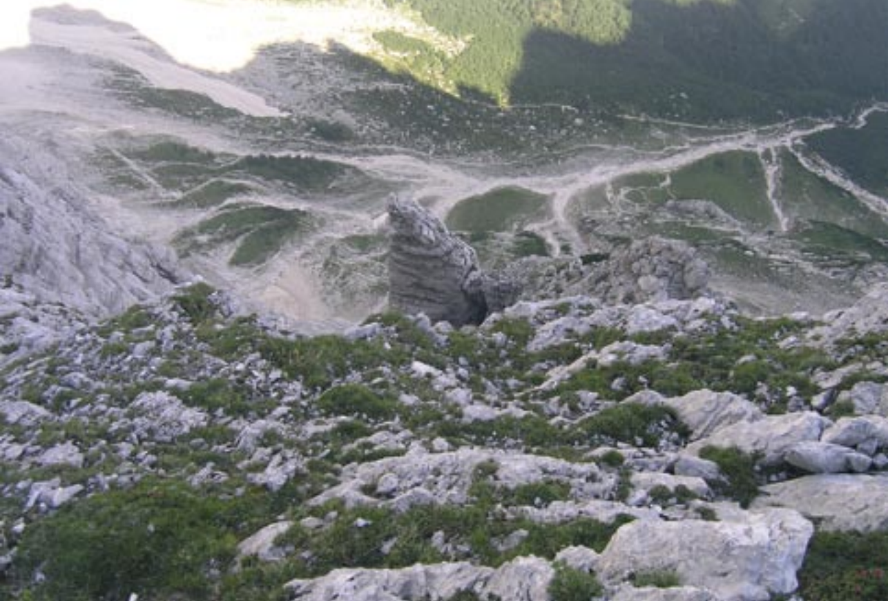
Grad z Nemškega Turnca

zanja izbirajo za svoje cilje. Med njimi je tudi Nemška smer v Steni, ki obenem postaja priljubljena vodniška tura. In letos mineva 100 let od njenega nastanka.