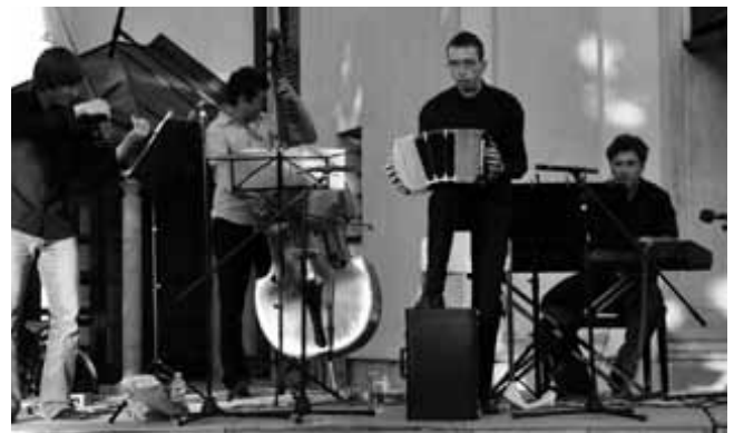
Veris bo tudi letos postregel z odlično glasbo.

Delavnice in recitali za najmlajše bodo v dvorani Glasbene šole Logatec, večerni koncerti pa v cerkvi in na trgu sv. Nikolaja ter v večnamenski dvorani Logatec. Cena za obisk vseh festivalskih prireditev (13, abonmajska karta) je tudi letos simbolična. Za odrasle