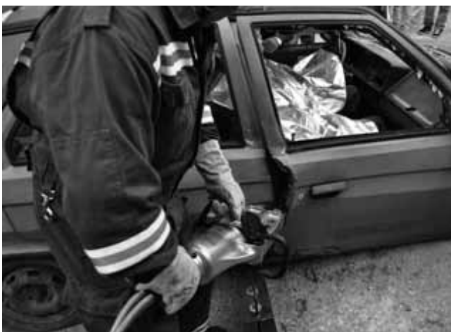
Gasilci so preizkusili različne tehnike razreza vozil in različno orodje.

Člani Prostovoljnega gasilskega društva Dolnji Logatec smo se ob 18. uri zbrali pred gasilskim domom v kar lepem številu, bilo nas je 24, in se s tremi avtomobili odpravili na Vodovodno ulico 16. Tam smo imeli kar šest različnih avtomobilov, pripravljenih