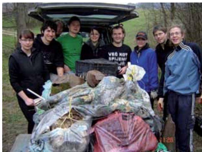
Ekipa Kluba logaških študentov je očistila kotanjo na polju pod Širokimi njivami. Med smetmi so našli gume, pralni stroj, hladilnik, akumulatorje, ogromne količine plastenk in konzerv pa tudi poginjene miši ter kravo ali konja.