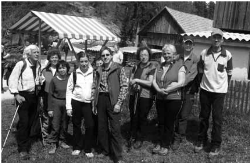
Pri Bočkovem mlinu na Bloški planoti.

Na pohod po Krpanovi poti na Blokah smo se podali 25. aprila. Pri Bloškemu jezeru smo se pridružili koloni okoli 2.000 pohodnikov in po označeni poti hodili po mirni in spomladansko prebujajoči se Bloški planoti. Na ravnici se razprostirajo obsežni vlažni travniki, ki ponekod prehajajo v nizka barja. Med drugim smo se