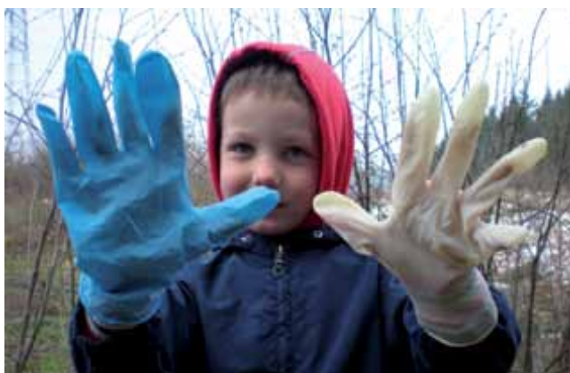
Me prav zanima, za kom moram pa jaz pobirati smeti.