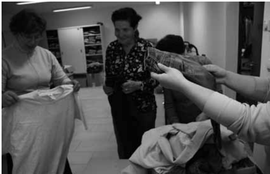
V skladišču Rdečega križa v upravnem centru so na voljo tudi oblačila.