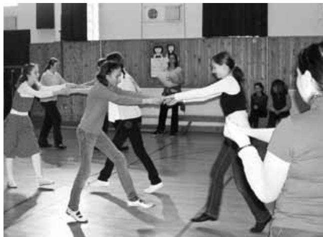
Poleg angleškega valčka obvladajo tudi ča ča in swing.

Na Osnovni šoli Rovte že več let sodelujemo na tekmovanjih, ki jih organizira Plesna zveza Slovenije. Naši učenci so že bili zelo uspešni, lani sta se dva uvrstila na odlično 14. mesto na državnem plesnem tekmovanju. Letos smo se ne le udeležili tega tekmovanja, ampak smo ga drugič tudi organizirali.