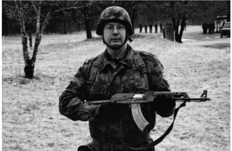
Usposabljanje je bilo naporno, a nujno potrebno.

Žena Vanja me toliko pozna, da ve, kako trdno stojim za svojimi odločitvami, med katerimi je bila tudi ta misija. Sama je rekla, da se zaveda, da s svojimi nasprotovanji ne bi nič dosegla, zato me je ves čas podpirala. Zanj je bilo težko tudi zato, ker še študira, imava pa tudi 9-letno hči Ano, ki jo voziva v Ljubljano na treninge plavanja. Tu se je poznala moja odsotnost, saj sama ni zmogla vsega. Povsem jo razumem, saj družina povsem drugače deluje, če sta doma oba starša, ne pa samo eden od njiju. Celotno breme je padlo na njena ramena, medtem ko je življenje na misiji potekalo povsem drugače kot v vsakda-