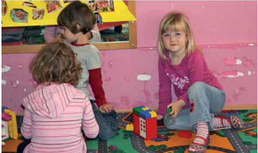
V vrtec Kurirček je tudi letos prispelo več vlog, kot je prostora. Prvi podatki kažejo, da bi morali zavrniti skoraj 50 otrok, a se bo ta številka do septembra zagotovo še spremenila.

Našo vlogo za ureditev prehoda za pešce v središču kraja je Direkcija za ceste RS zavrnila. Pripraviti moramo poseben projekt. Za gradnjo prve faze pločnika, od Loga do galskega doma, imamo dokumentacijo, potrebnega zemljišča, ki je v lasti posameznih občanov, pa še ne. Krajanji, lastniki zemljišč, v primerjavi z lastniki zemljišč v mestu Logatec postavljajo nesprejemljive pogoje (cena, menjava zemljišč, ...). Če bomo uspeli dobiti zemljišča, se bo projekt začel izvajati in se bodo za to porabila odobrena sredstva v višini 285.000 evrov, sicer pločnika ne bo, sredstva pa se bodo preusmerila v druge projekte v Logatcu (obnova cest). Z lastnikom pa smo se dogovorili za odkup dobrih 300 kvadratnih metrov zemljišča ob šoli, na katerem bomo postavili ograjeno košarkarsko igrišče za potrebe šole in krajanov. Naročili smo parcelacijo območja ceste, od ceste G2 – 102 do POŠ, da ugotovimo, koliko zemljišča pod cestiščem je v lasti občine, koliko v lasti