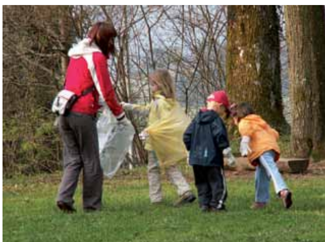
Taborniki za sabo sicer ne puščajo smeti, so jih pa pridno pobirali za drugimi, najprej okoli taborniške kočice na Naklu, nato pa v Širokih njivah.

1.700 prostovoljcev, predstavniki 25 društev, šolarji in otroci iz vrtca, starši, mladi in stari, vsi, ki jim ni vseeno, so 17. aprila na Logaškem čistili okoli 30 večjih ter številna manjša črna odlagališča. Komunalno podjetje je poskrbelo za 1.200 vrečk za embalažo, 1.500 vrečk za nekoristne odpadke in 800 rokavic, pa je vsega kljub temu zmanjkovalo. Razlog: preveč smeti. Na deponijo na Ostrem vrhu so navozili 53 ton odpadkov, med njimi veliko takih, ki so jih ljudje na zbirna mesta navozili kar od doma. A kljub temu lahko rečemo, da je akcija Očistimo Slovenijo v Logatcu uspela. Odzivi ljudi, ki so čistili: »Ne moreš verjeti, koliko smeti. Kaj vse smo našli. Zakaj sploh imamo deponije, če pa nekateri raje kot tja smeti zapeljejo v naravo? Če bom zdaj videl koga, ki bi rad smetil, si bom zapisal registrsko številko in ga prijavil. Upam, da bodo tudi inšpektorji v prihodnje imeli oči na pecljih. Kazni za nepravilno odlaganje smeti bi morale biti višje. Upam, da se je akcija dotaknila tudi onesnaževalcev, čeprav se nam pri čiščenju niso pridružili.«