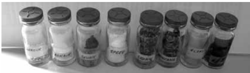
V takih epruvetkah policisti pošljejo vzorce prepovedanih drog v analizo forenzikom.

Lani je na slovenskih cestah umrlo 49 voznikov enoslednih vozil, med njimi 18 kolesarjev. Kljub temu da zadnji poleg pešcev sodijo med bolj ogrožene v prometu, bodo policisti več pozornosti posvetili motoristom. Kot pravi Žaren, bodo predvsem ob koncih tedna pogosteje merili hitrosti na relaciji proti Primorski in nazaj. Obdobje po koncu zime je za njih nevarno pred-