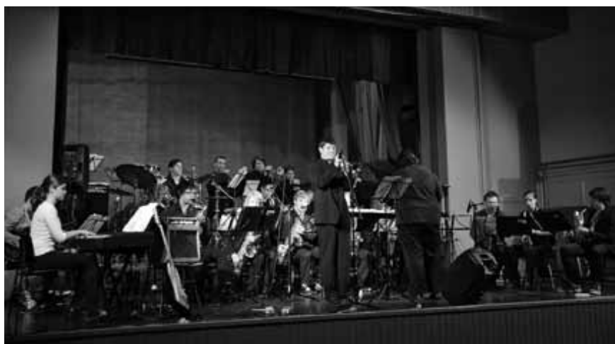
Člani big banda Wonderbrass so navdušili.