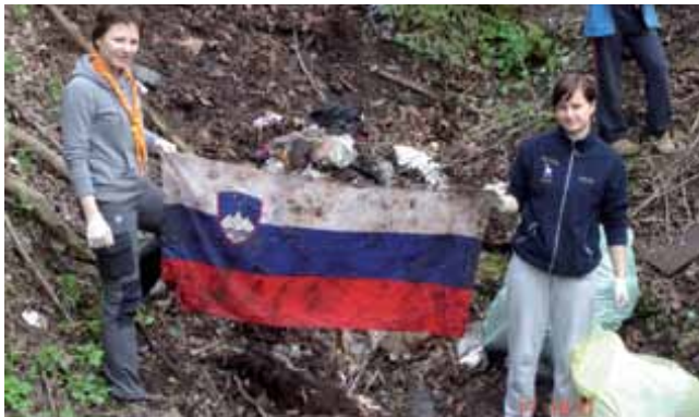
Študentje so se zgrozili, ko so pod kupom nesnage na dnu kotanje našli slovensko zastavo.