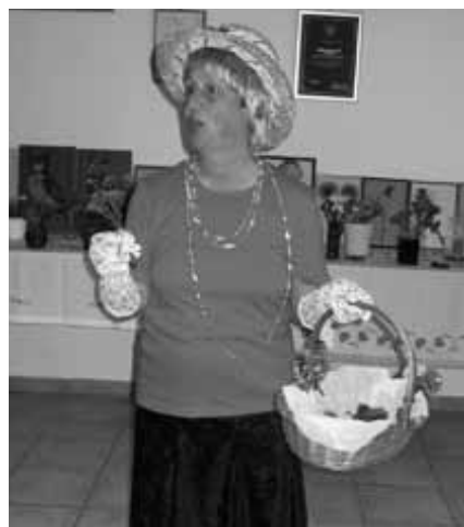
Razstavo je odprla prodajalka vijolic.