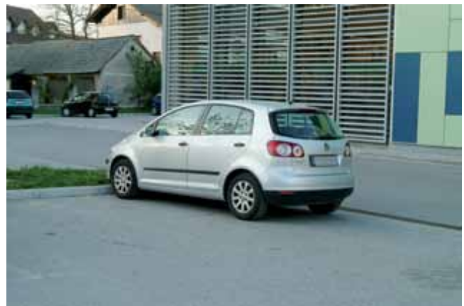
Talne označbe so komaj vidne, znak za invalide sredi parkirnega prostora pa je le slutiti.

Zanimivo je tudi, da lahko v Logatcu stanovalci nekaterih blokov mirno parkirajo na zelenicah, čeprav je okoli blokov dovolj parkirnega prostora. To sicer niso več zelenice, temveč zorane njive. Redoljubov to ne zanima, je menda prenevarno.