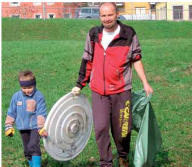
Otroci iz vrtca Kurirček in njihovi starši so bili začudeni nad količino, predvsem pa nad raznovrstnostjo smeti, ki jih brezvestni ljudje odvržejo na travnike.