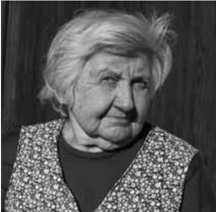
Štekljeva Rezka.

Štekljeva Rezka iz Laz se spominja življenja ob Planinskem polju, časov, ko so se k maši pa tudi na pogreb vozili s čolni