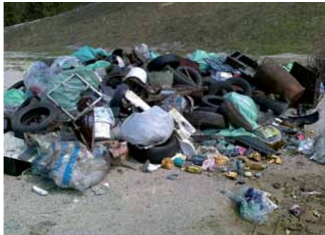
Odpadki so se kopičili tudi v Hotedršici.