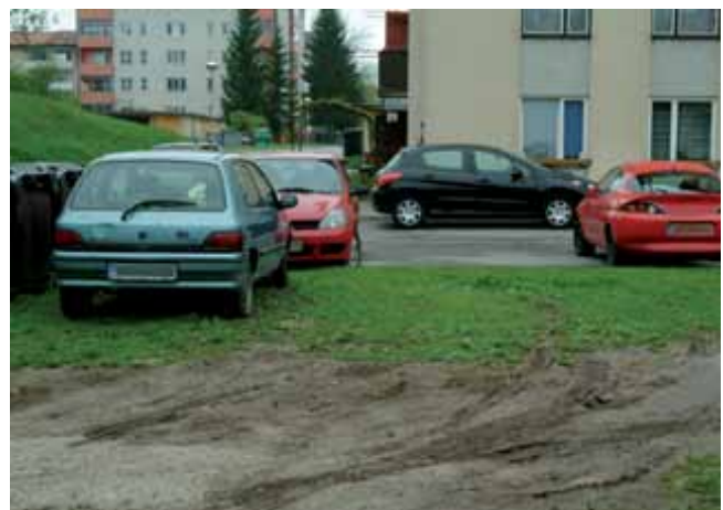
Zelenico so vozniki s parkiranjem zorali v pravo njivo.

Kazen za parkiranje na neoznačenem parkiranem prostoru je v mojem primeru 80 evrov. Za ta denar morajo delavci delati 20 do 25 ur. Sicer pa vsak dela po svoji pameti, tudi če je nima. Nad njihovo modrostjo in odločitvijo se ne morem pritožiti – je torej to moja pravica v tej »pravni državi«? Redarji operirajo z mojimi podatki. Meni pa so dali na znanje, da me je obravnaval REDAR O7 SLIKA 2. Ne vem, s kom operiram. Kaj je tukaj ime in kaj je priimek? Nekdo nekaj od mene hoče oz. me kaznuje, pa ne vem niti, kdo je, saj se skriva za nekimi psevdonimi.