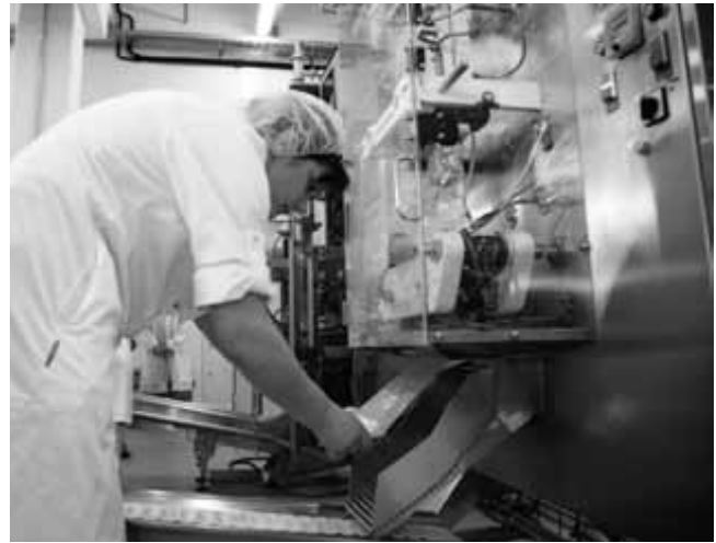
Mercator-Emba je celotno proizvodnjo v Zapolje preselila že novembra.

Podjetje Embalirka je bilo ustanovljeno pred dobrimi petdesetimi leti in se je 1968. pridružilo veletrgovini Mercator. Zdaj