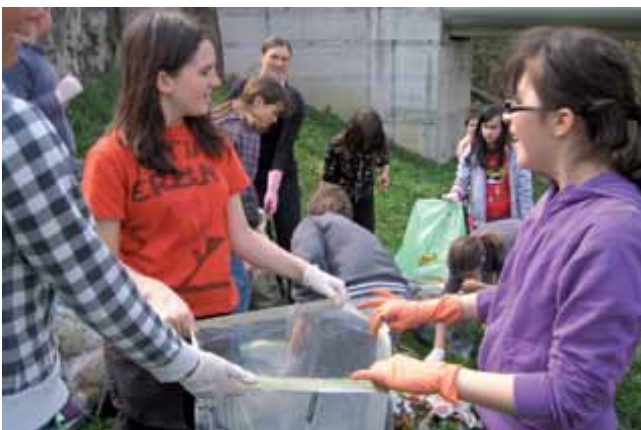
Pridni so bili tudi dolnjelogaški šolarji. Razkropili so se po Logatcu in čistili bregove Logaščice, sprehajalne in nakupovalne poti ter okolico nekaterih kulturnih in naravnih spomenikov. Mlajši učenci pa so dan popestrili z izdelovanjem lutke iz odpadnega materiala in lesenih mlinčkov.