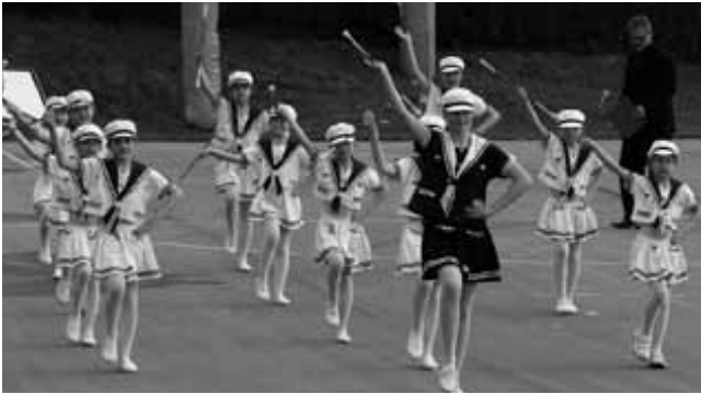
Članice Twirling kluba logaških mažoret osvajajo medalje.

Logaške mažorete in twirlerice so med najboljšimi