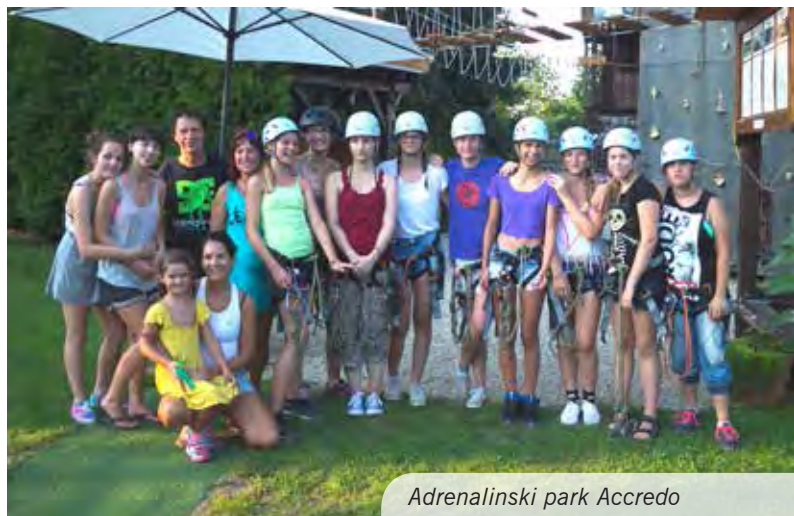
Adrenalinski park Accredo

Tudi tokrat zabave in dobre volje ni manjkalo. Poleg kopanja v toplicah, plesanja raznolikih koreografij, mnogih novih organiziranih oblik aktivnosti, kot so poti doživetja, številnih plesnih in zabavnih iger, filmčkov po lastnih scenarijih, kina pod zvezdami ipd., smo letos pripravili kar nekaj presenečenj. V torek smo dekleta presenetili z obiskom dogodka "Porcijunkulovo" v mestu Čakovec, na katerem smo z navdušenjem opazovali, kako so številni lampijončki osvetlili nebo. V četrtek smo obiskali adrenalinski park "Accredo Centar", kjer smo streljali z lokom in puško, plezali, se spustili po »zipline« in igrali ročni nogomet v človekovi velikosti. Da se je ta dan zaključil v stilu,