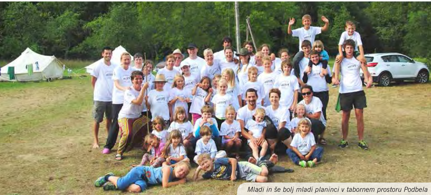
Mladi in še bolj mladi planinci v tabornem prostoru Podbela

Letošnja vročina je nam, planincem, zadnji julijski teden prizanesla v času taborjenja ob reki Nadiži v Podbeli (Breginjski kot) in predvsem z nočnim dežjem omogočila ravno pravšnjo atmosfero za premagovanje tur različnih težavnosti (Nizki vrh, Krasji vrh, Matajur, Kobariški Stol, Krn, pradolina Nadiže in še več) ter tudi popoldanske različno tematsko obarvane aktivnosti.