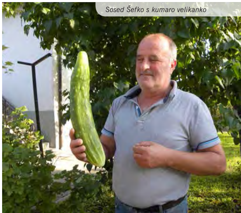
Sosed Šefko s kumaro velikanko