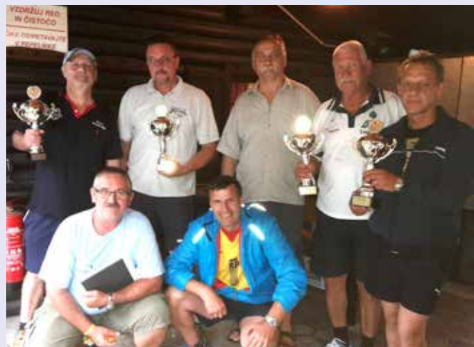
Dobitniki pokalov na turnirju ob 30. letnici balinanja v Mengšu