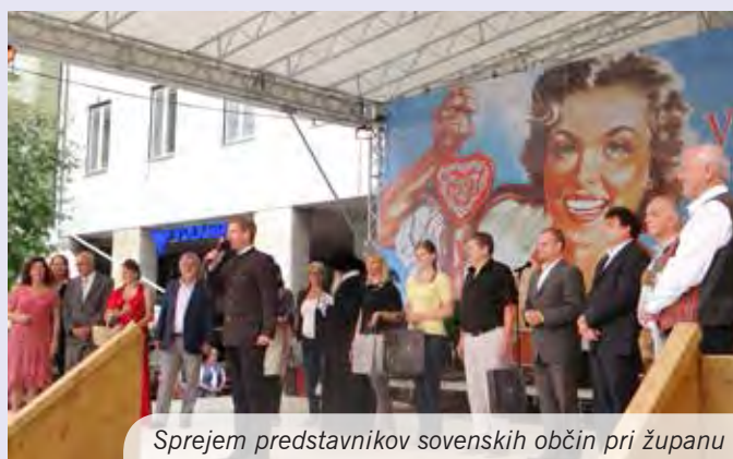
Sprejem predstavnikov slovenskih občin pri županu