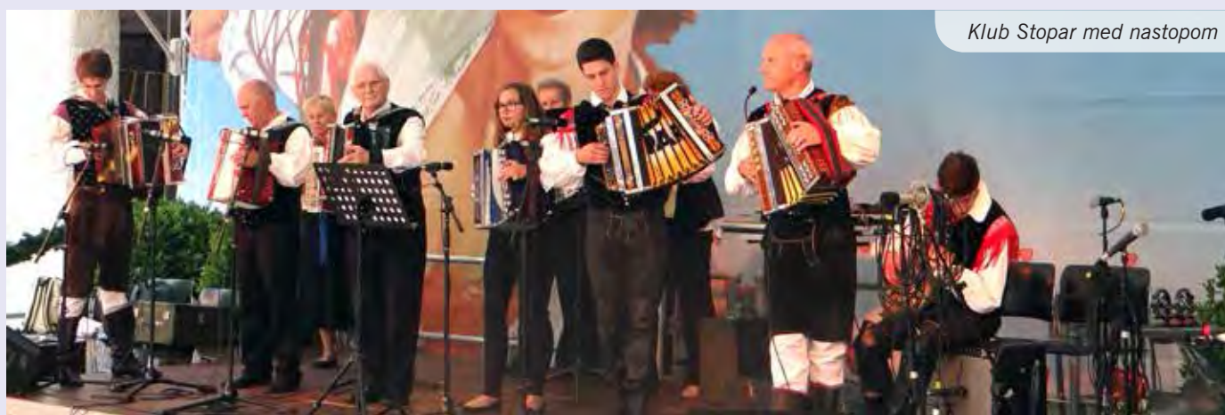
Klub Stopar med nastopom