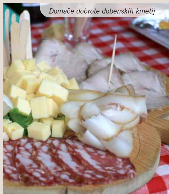
Domače dobrote dobenskih kmetij