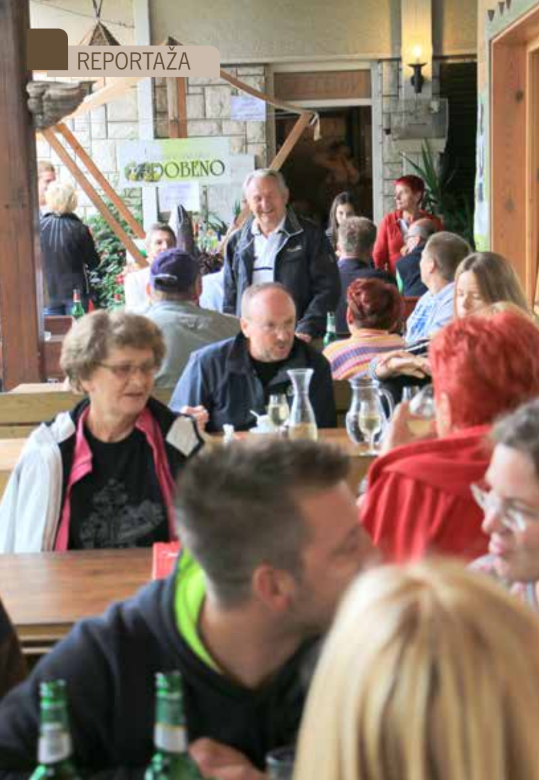
Kljub slabemu vremenu se je zbralo kar veliko število ljudi za tovrstno prireditev