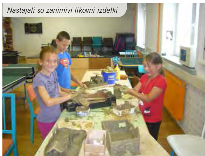
Nastajali so zanimivi likovni izdelki