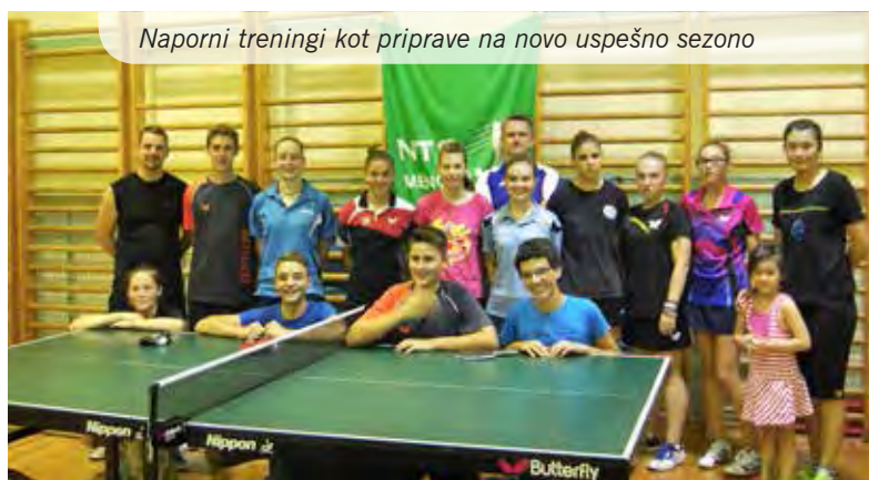
Naporni treninki kot priprave na novo uspešno sezono