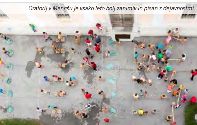
Oratorij v Mengšu je vsako leto bolj zanimiv in pisan z dejavnostmi