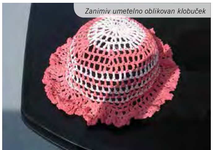
Zanimiv umetno oblikovan klobuček

Besedilo in foto: mentorica Dari Korošec