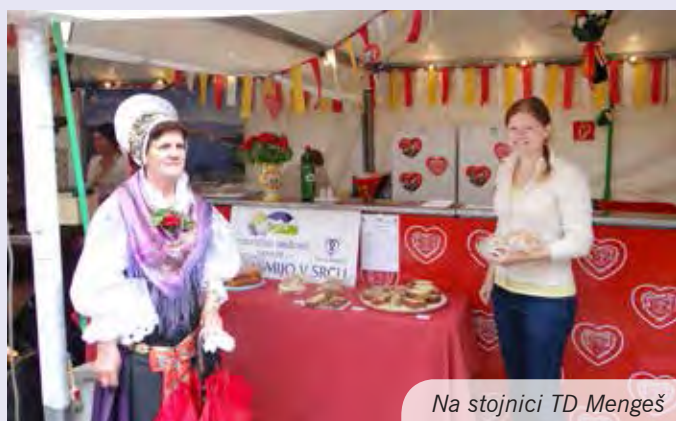
Na stojnici TD Mengeš