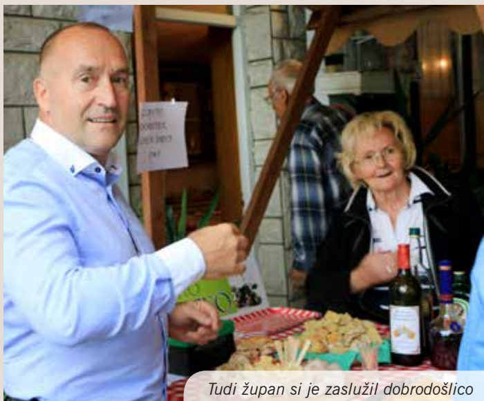
Tudi župan si je zaslužil dobrodošlico