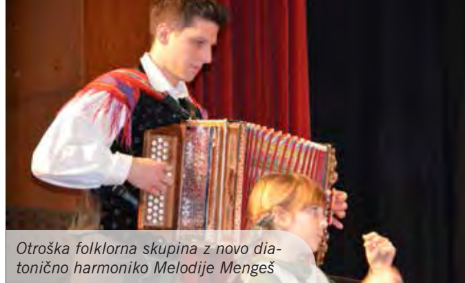
Otroška folklorna skupina z novo diatonično harmoniko Melodije Mengeš

Mednarodne turneje so zagotovo magnet, ki privabljajo plesalce k folklori. Z vztrajnostjo in dokazano kvaliteto je tudi naši folklori uspelo priti do odmevnega festivala v Indoneziji, o katerem smo poročali v prejšnji številki Mengšana. Našo kulturo pa v