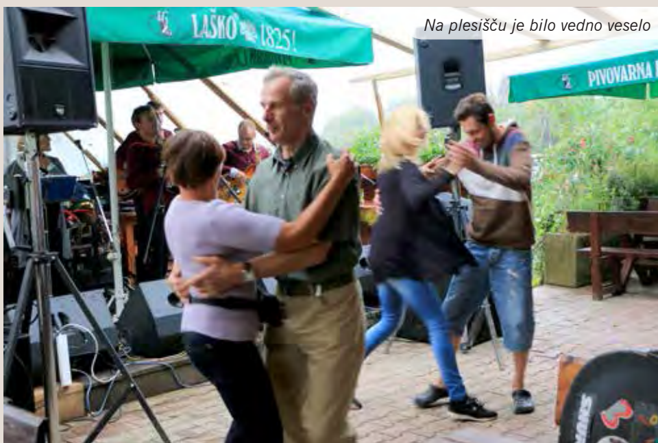
Na plesišču je bilo vedno veselo