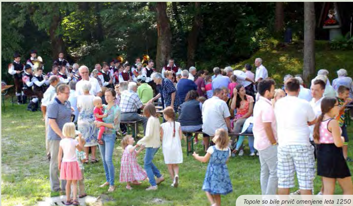
Topole so bile prvič omenjene leta 1250