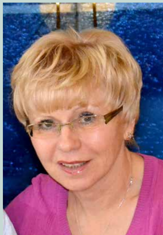
Najrazličnejše prispevke zaposlenih in stanovalcev je možno prebrati tudi v letnem glasilu Spomini, ki je dostopno na spletni strani Doma počitka Mengeš

Trenutno v Domu počitka Mengeš bivajo 204 stanovalci, v enoti Trzin pa še 59. Dom nudi vse štiri kategorije oskrbe in tri kategorije zdravstvene nege.