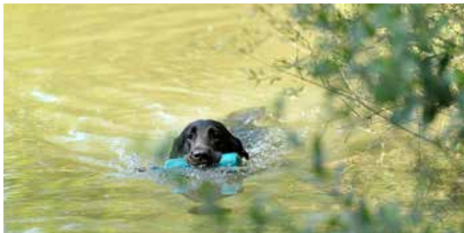
Za uspešno prinašalsko delo je potrebno tudi vodno delo psov