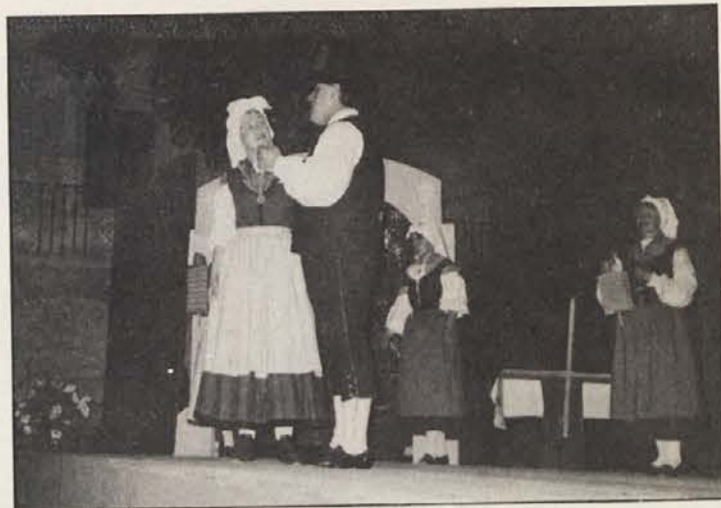
Dva prizora iz Kraške ohceti, ki vam jo bo predstavila folklorna skupina s Krasa