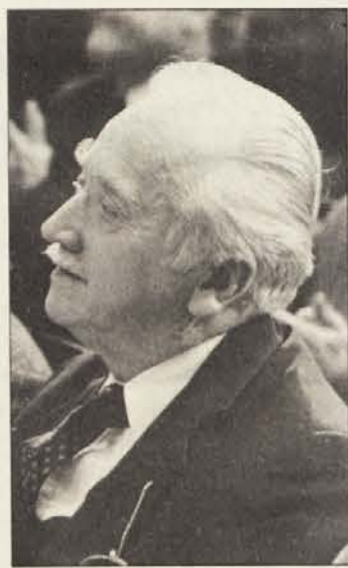
dr. Valentin Inzko