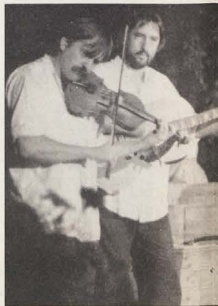
Skupina Székiáltó se je predstavila z

Pod geslom „Glasba sosedov“ je SPZ priredila letošnji osrednji koncert. Po raznovrstnosti glasbe in kvaliteti izvajanja je bil to prav gotovo eden najzanimivejših koncertov v zadnjem času. Zanimanje je bilo temu primerno, telovadnica Mladinskega doma, spremenjena v dvorano, je bila polna in občinsko navdušeno.