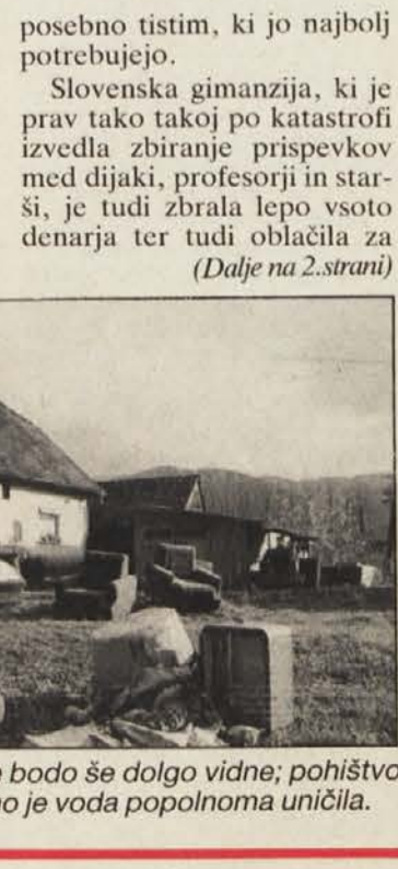
Posledice naravne katastrofe bodo še dolgo vidne; pohištvo in drugo stanovanjsko opremo je voda popolnoma uničila.

imeli možnost, da pomagate od naravne katastrofe prizadetim v Sloveniji. Doslej vplačano vsoto bomo še ta teden izročili Rdečemu krizu Slovenije, ki nam je zagotovil, da bo Vaša denarna pomoč posredovana posebno tistim, ki jo najbolj potrebujejo. Slovenska gimanzija, ki je prav tako takoj po katastrofi izvedla zbiranje prispevkov med dijaki, profesorji in starši, je tudi zbrala lepo vsoto denarja ter tudi oblačila za (Dalje na 2. strani)