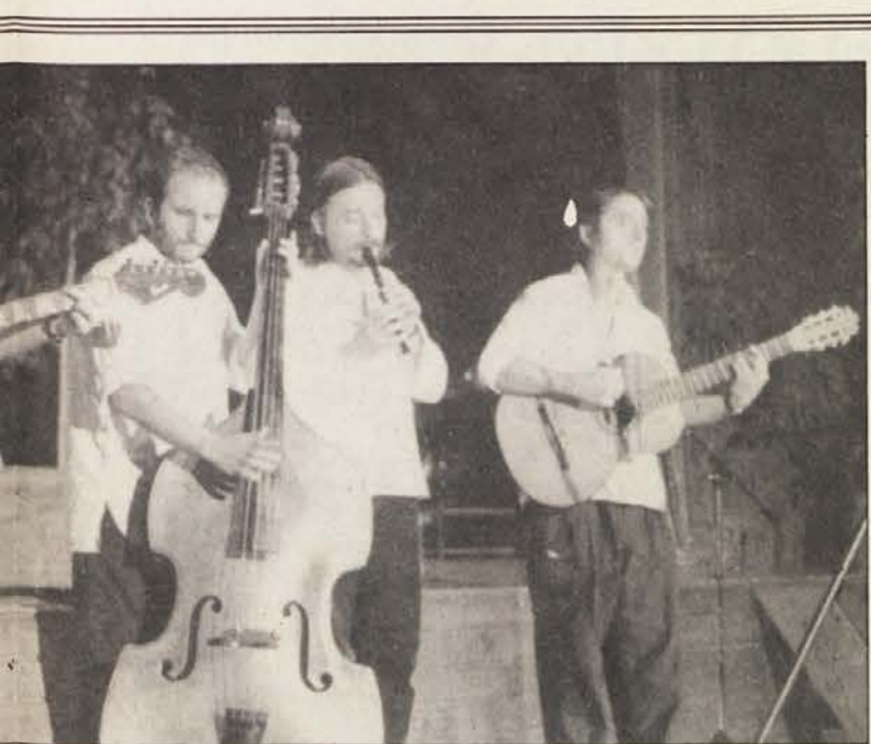
Z ljudsko glasbo več narodov.