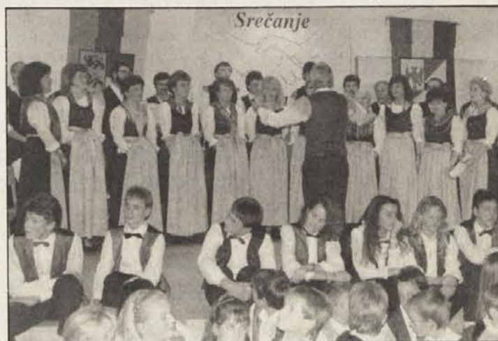
Zbori SPD „Radiše“ so se predstavili narodu sosedu.