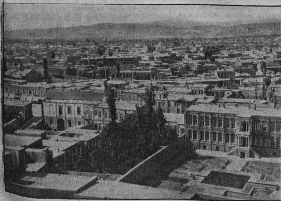
Sovjetske bombe na Taebrija

Taebrija po Teheranu drugo največje trgovsko mesto Irana, katerega so boljševiki zjutraj 25. avgusta brez svarila napadli z bombami.