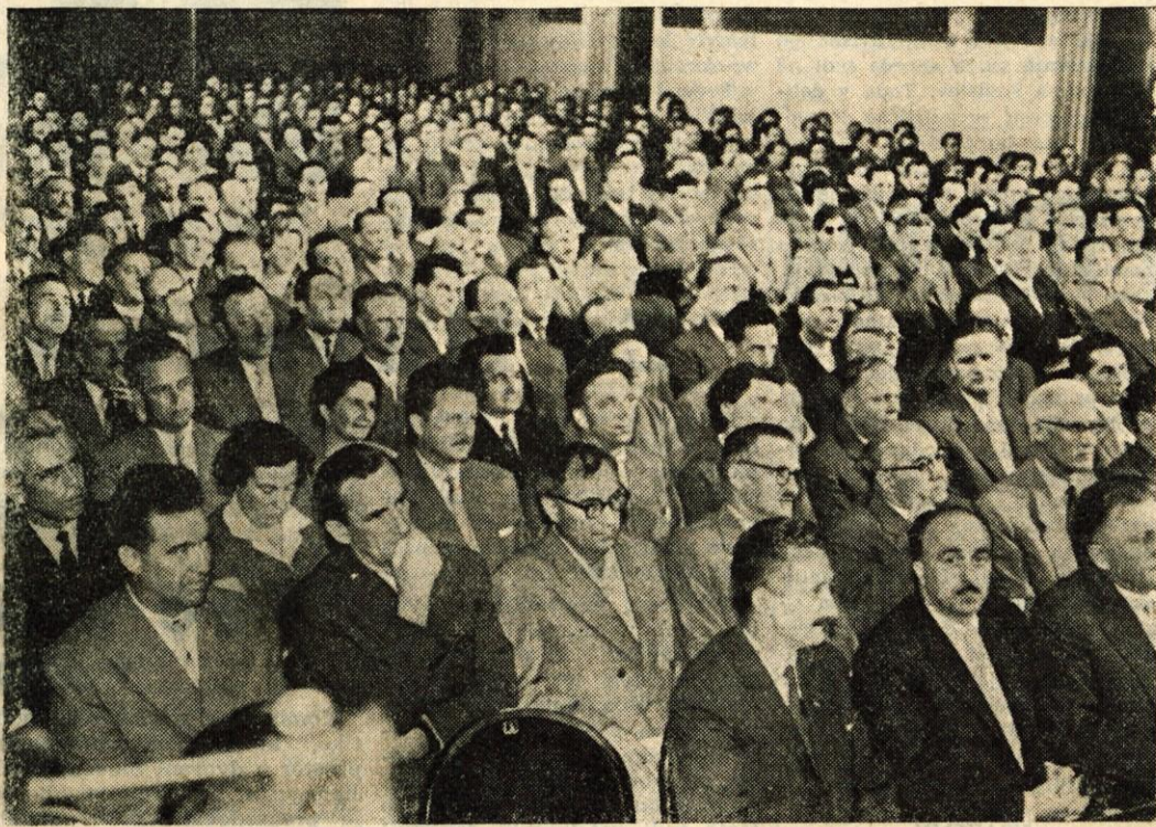
Delegati med zasedanjem na IV. kongresu Zveze komunistov Slovenije

Tako je šlo do danes. To stanje, kot je ugotovila posebna komisija, povzroča lesni industriji veliko škodo. Preko Kluba gospodarstvenikov se v našem okraju zelo uspešno izmenjujejo različne izkušnje, se uveljavljajo nove oblike dela in podobno. Toda do pomembnejših združenj med gospodarskimi organizacijami še ni prišlo. Seveda ni moč tega uresničiti čez noč. Tako združevanje narekuje sam interes kolektiva, sam razvoj v primernem času. To se je že pokazalo v drugih, industrijsko močnejših deželah. Gre torej za to, da napotke kongresa upoštevamo kot perspektivne smernice, ki jih komunisti morajo imeti pred očmi na svojih delovnih mestih ter kot močna subjektivna sila usmerjati razvoj k temu cilju. K. M.