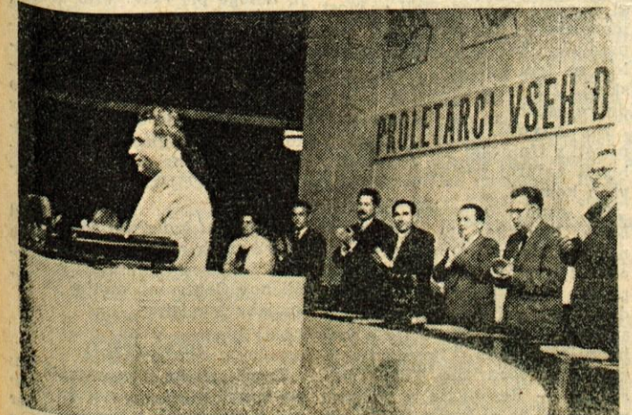
V imenu CK ZKJ je kongres pozdravil tov. Aleksander Ranković

(Iz govora Mihe Marinka na IV. kongresu ZKS)