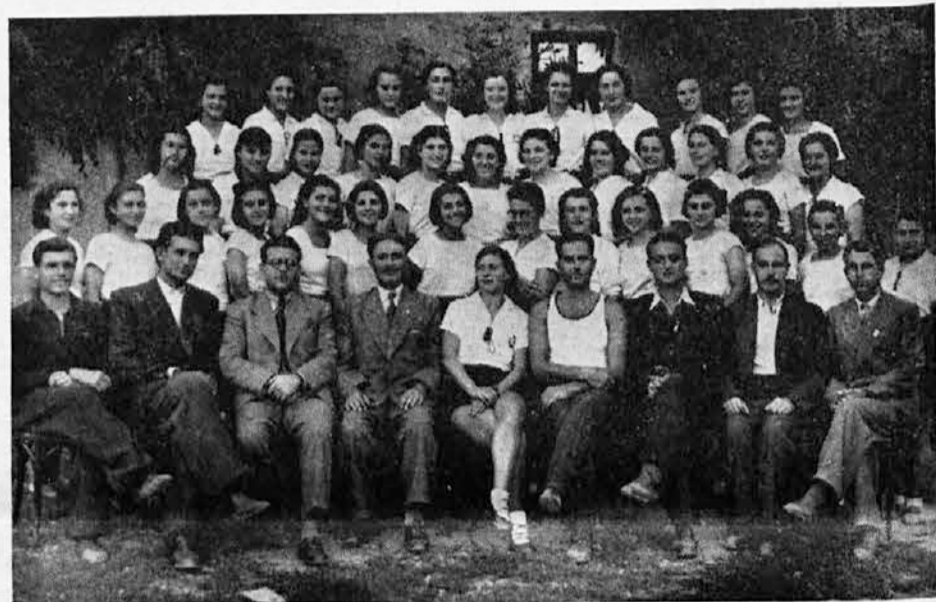
Prednjački tečaj za članice u župi Skoplje (1—15. IX. o. g.).