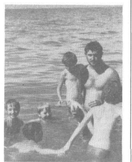
Tudi letos bo prišlo iz Pacuga veliko mladih plavalcev.