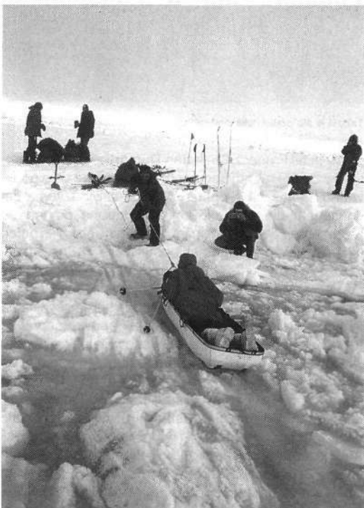
Potem ko sta dva člana odprave padla v vodo, ker se jima je udrla pretenka ledena skorja, je na nevarnih mestih tvegala eden, ki je potem druge na saneh – pulkah takole zvezel preko nevarnih mest.

Orientacija je bila ob lepem vremenu zelo preprosta. Sonce je okoli Severnega tečaja v določenem letnem času in mesecu vseskozi enako visoko; zjutraj je bilo točno na desni strani, na vzhodu, šest ur pozneje na jugu, za hrptom torej, še šest ur pozneje na levi strani, na zahodu, in opolnoči tik pred popotniki, na severu.