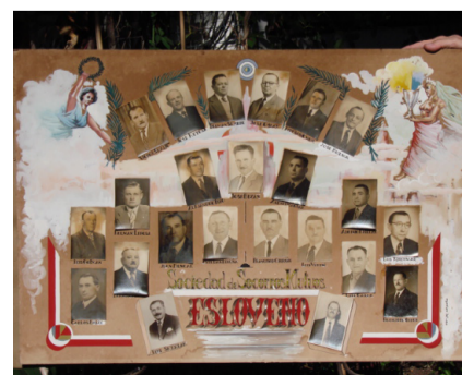
Prva komisija ob ustanovitvi društva