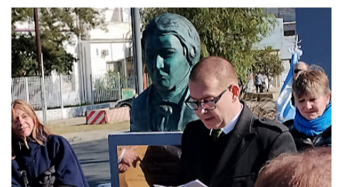
Veleposlanik med govorom