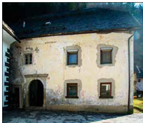
Rojstna hiša Antona Globočnika v Železnikih.

Z radijsko uro, obiskom njegovega groba in razpisom likovnega natečaja Globočnik v Postojnski jami so se moža, po katerem je poimenovana OŠ Antona Globočnika, spomnili tudi njeni učenci in učitelji. 29. marca pa so nadarjeni učenci OŠ Antona Globočnika obiskali Železnike. Sprejeli so jih v OŠ Železniki. Učenci turističnega krožka so jim razkazali stari del Železnikov. Sprehodili so se mimo njegove rojstne hiše do muzeja. Tu so si ogledali muzejske zbirke in plavž.