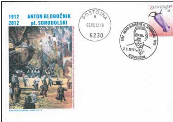
Ovojnica, dopisnica in žig, 2. marec 2012.