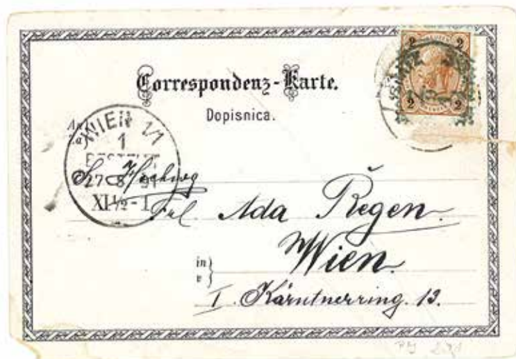
Prva poslana razglednica iz Postojnske jame, 24. maj 1891.