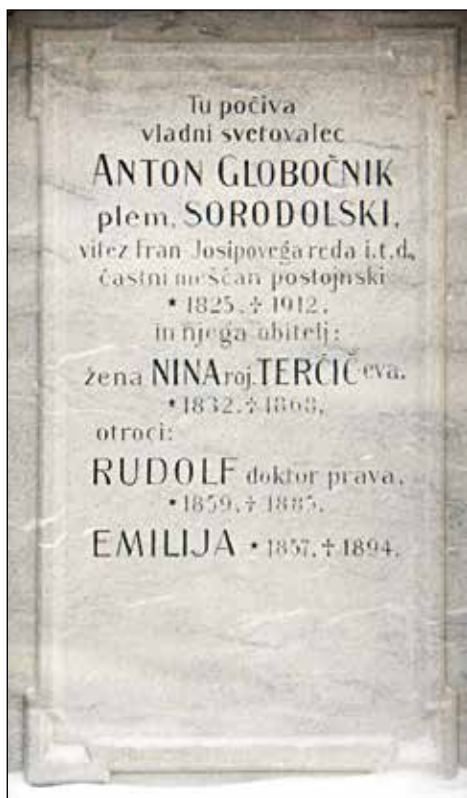
Napis na grobu Antona Globočnika, žene Nine, otrok Emilije in Rudolfa.

• Položitev železniških tirov med kapnike v letu 1872. Potiskanje posebnega voza z eminentnimi gosti ob tolmunih, kjer se zrcalijo kristalaste