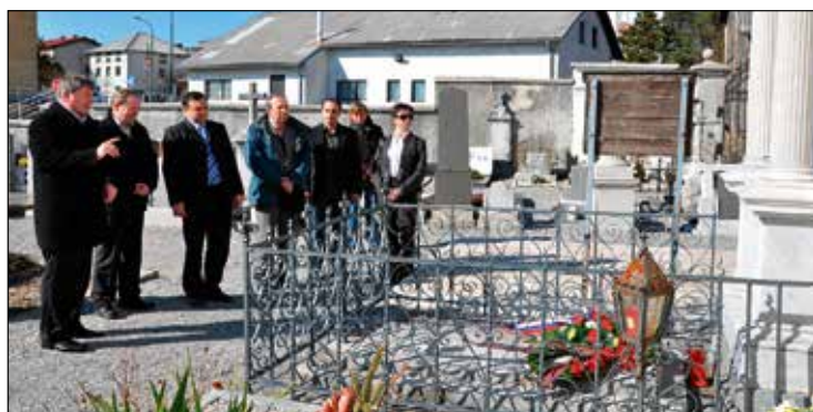
Polaganje venca.