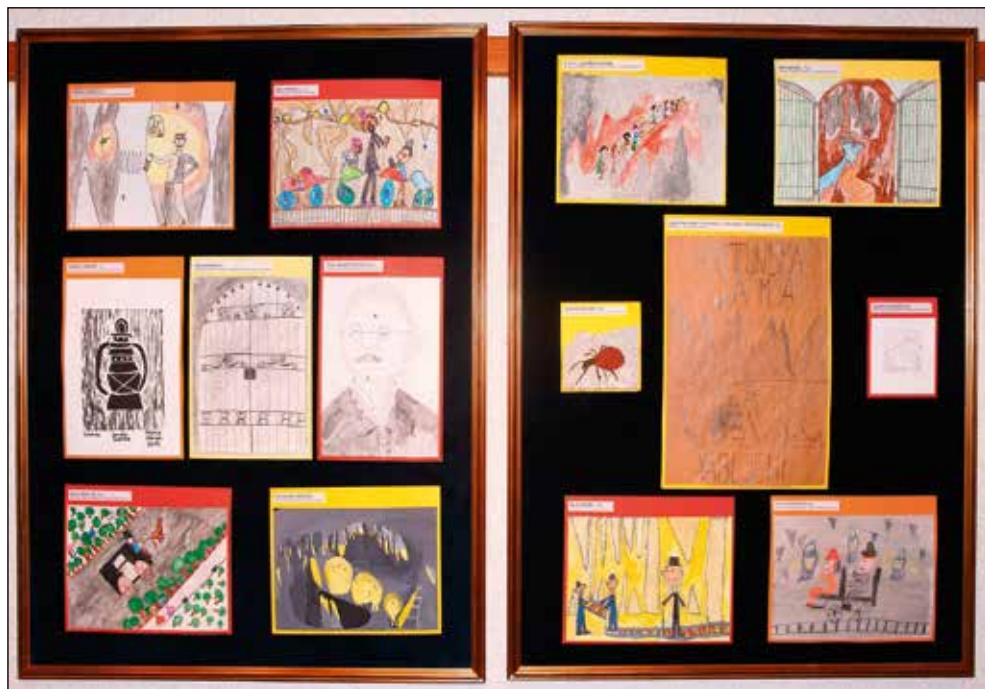
Nagrajena dela učencev.