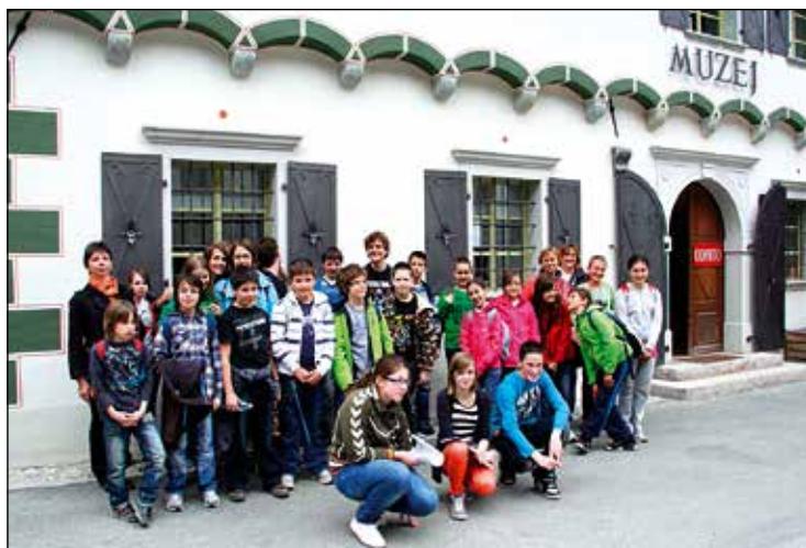
Nadarjeni učenci OŠ Antona Globočnika pred muzejem.