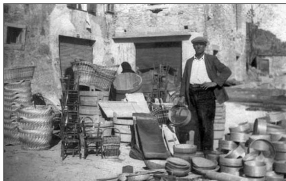
Gregoričeva trgovina s suho robo v Pazinu (Digitalna zbirka Muzeja Ribnica. Original v zasebni lasti).

znano pomembno mesto v razvoju zasebnega kmetijstva. 51