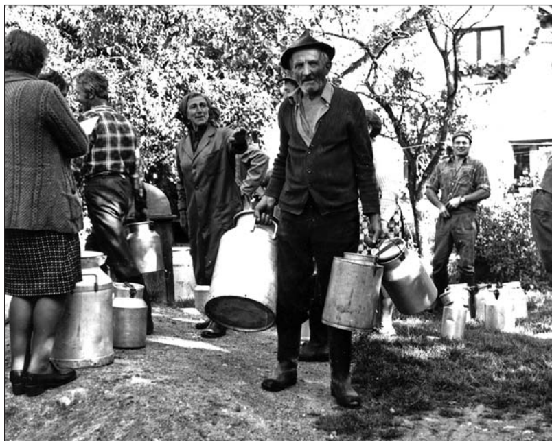
Zbiranje mleka na Poljanah za prodajo v Mlekarno Velike Lašče (Digitalna zbirka Muzeja Ribnica. Original v zasebni lasti).

Inles v Ribnici. Ves čas so ga uporabljali tudi za izdelovanje suhe robe.