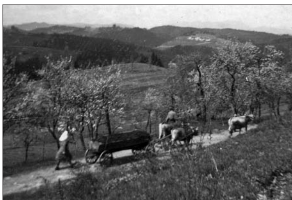
Prevoz gnoja z gnojnim vozom in kravami pri Fistrovih.