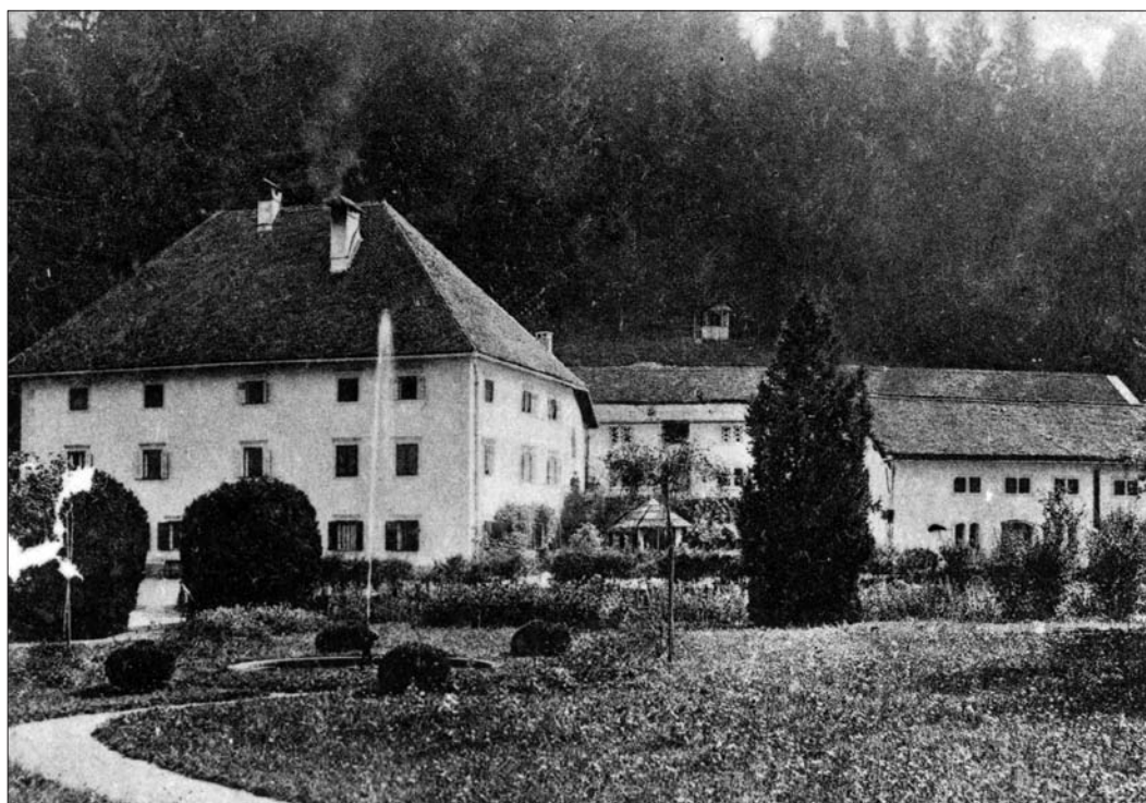
Graščina Ortnek pred drugo svetovno vojno (Digitalna zbirka Muzeja Ribnica. Original v zasebni lasti).

V Ortneku je bilo takole. Kosler je vse pokupil. Tu je bil mlin, kjer je bila potem žaga. Vse je pokupil in ljudi izplačal. Potem ko je odkupil, je začel ustvarjati po svoje. Ljudem je dal stanovanja in službe. Kosler se je centraliziral, tako se je reklo v komunizmu, saj je centralizacija pomenila vse, zato je vse pokupil. Ko se je Oskar vrnil