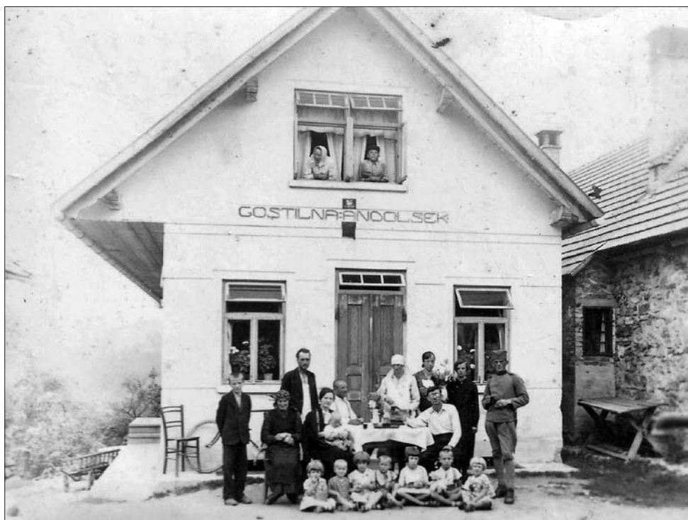
Gostilna na Poljanah pri Mežnarjevih (Digitalna zbirka Muzeja Ribnica. Original v zasebni lasti).