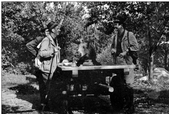
Lovci ob lovskem plenu (Digitalna zbirka Muzeja Ribnica. Original v zasebni lasti).