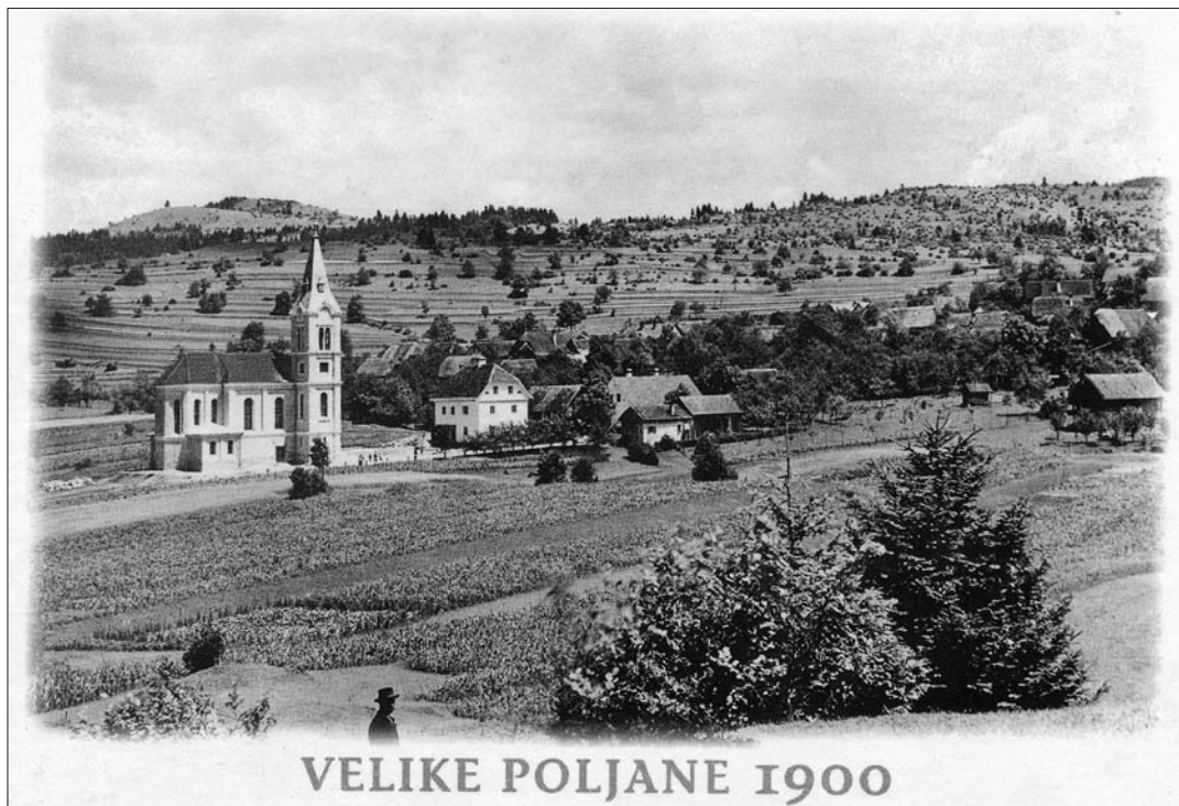
Farna cerkev sv. Jožefa leta 1900.