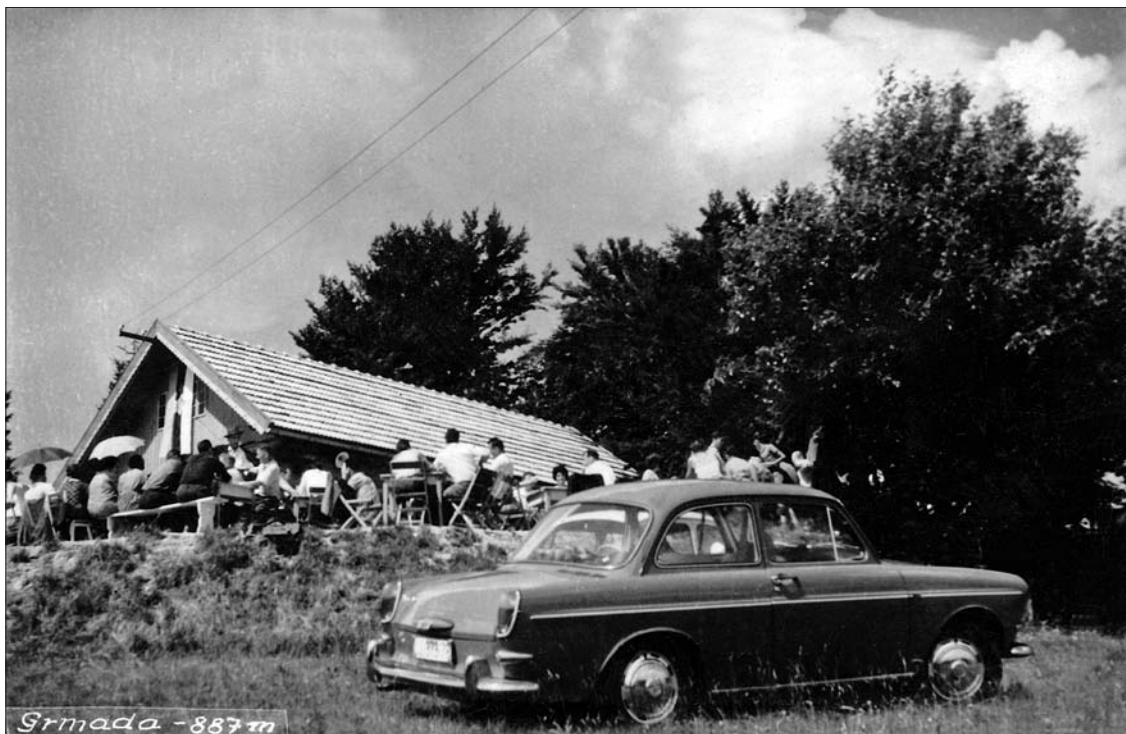
Zbrana družba Poljancev na Grmadi v sedemdesetih letih 20. stoletja