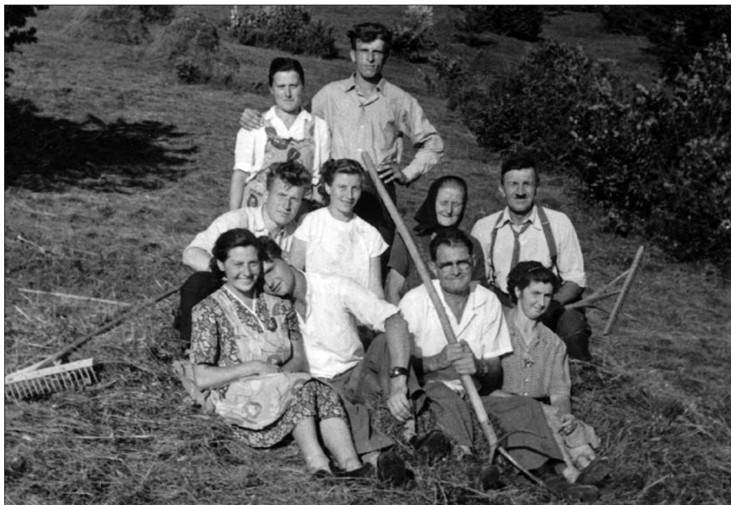
Drobničevi iz Žukovega, zbrani ob grabljenju v Senožetih (Digitalna zbirka Muzeja Ribnica. Original v zasebni lasti).

Do uveljavitve mehanizacije pri kmečkih opravilih in množičnejšega zaposlovanja so ljudje ob