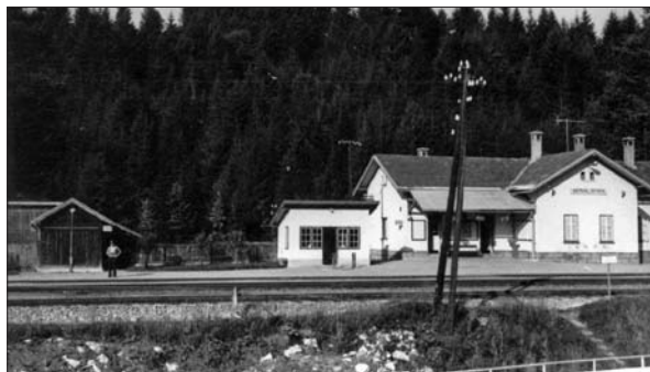
Železniška postaja Ortnek (Digitalna zbirka Muzeja Ribnica. Original v zasebni lasti).

Železnica je pomemben transportni in komunikacijski vir, omogoča razvoj gospodarstva in napredek kraja. V Ortnek ter naprej do Ribnice in Kočevja je vlak pripeljal leta 1893. V Ortneku je bila potniška in tovorna postaja. Veliko zaslug za progo skozi Ortnek imajo Koslerji, ki so prispevali zemljo in les za izgradnjo. 38