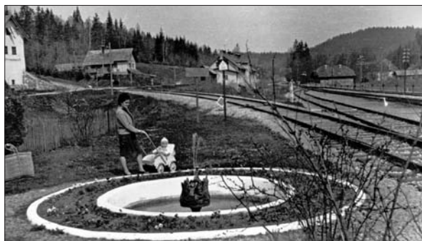
Postaja Ortnek je zaradi parka z vodnjakom veljala za eno najlepših postaj (Digitalna zbirka Muzeja Ribnica. Original v zasebni lasti).