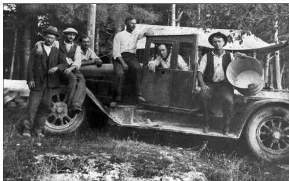
Tovorni avto iz leta 1928 za prevažanje robe po sejmih v Italiji (Digitalna zbirka Muzeja Ribnica. Original v zasebni lasti).