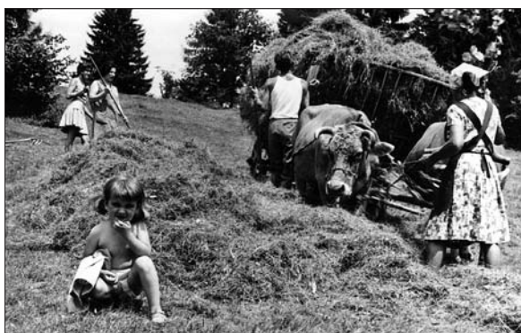
Šuštarjevi pospravljajo seno v Senošetih (Digitalna zbirka Muzeja Ribnica. Original v zasebni lasti).

do lova. Kdaj ste se včlanili med lovce? Že petdeset let imam dovoljenje, to je bilo leta 1960. Ste prej kaj 'raubšičali'? Ti bom pošteno povedal, da sem 'raubšičal'. Včasih ste morali biti ljudje bolj korajžni kot danes. Bolj, bolj. Bilo je čisto drugače kot danes. So vas kdaj do-