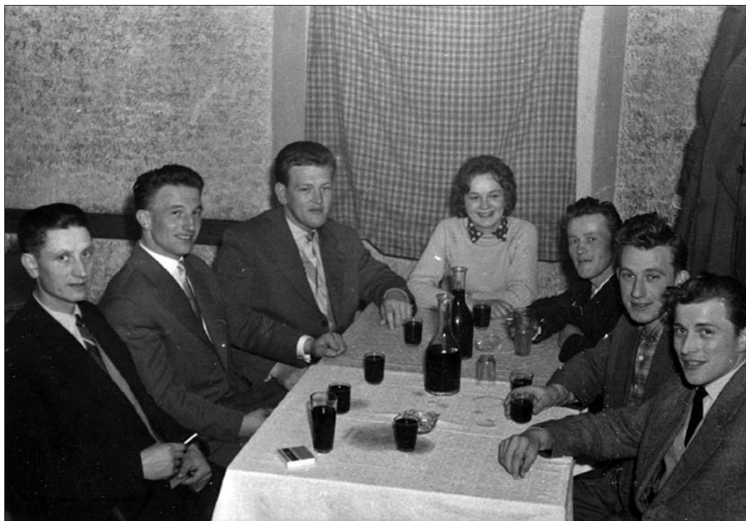
Družba poljanskih pevcev, zbrana pri Matjaku v Ortneku (Digitalna zbirka Muzeja Ribnica. Original v zasebni lasti).

različnih priložnostih veliko peli. Peli so, ko so zvečer sedeli na klopcah, se zbirali na vasi, hodili kosit in grabit v Senožeti, postavljali mlaje ob porokah in sedeli v gostilni, seveda pa tudi ob vseh družinskih in cerkvenih praznikih in svetih mašah. Ljudje so se družili pri delu, v gostilni, na veselicah, plesih, prireditvah, družinskih praznovanjih, ob letnih šegah, šegah življenjskega kroga in cerkvenih praznikih. Tako so se ob druženju ohranjali medsebojni, medsosedski in prijateljski stiki. Za časa mladosti in aktivne dobe večine informatorjev so se družili sredi vasi pri kapelici ali pri posameznih hišah. Danes so Poljanci povezani prek krajevne skupnosti in različnih društev (Gasilsko društvo, Športno turistično društvo Grmada). Na ta način se krepijo medsebojni in medsosedski odnosi. 16