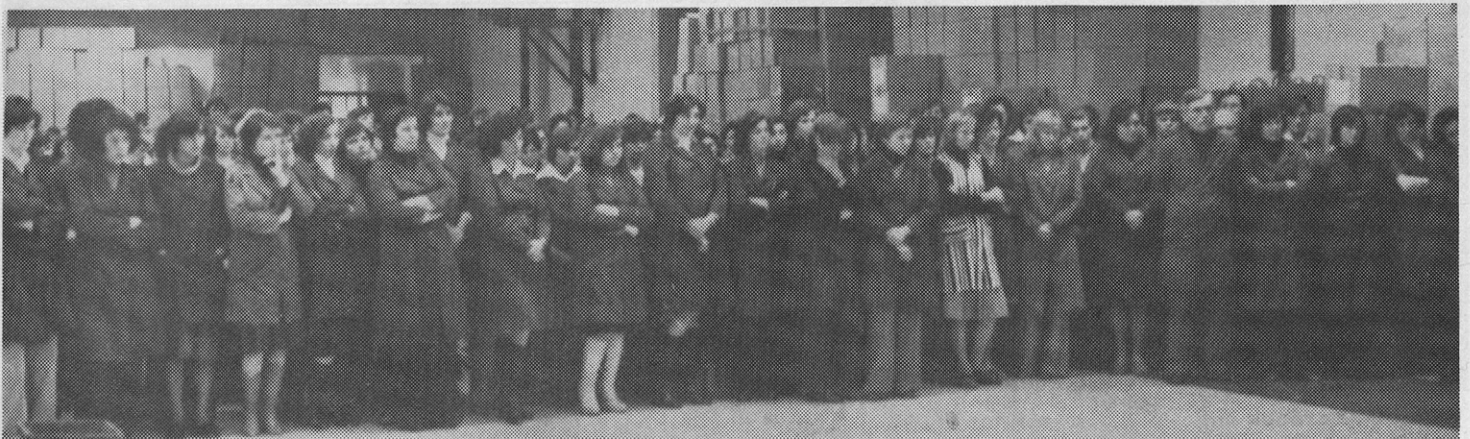
Komemoracija v Budućnosti.