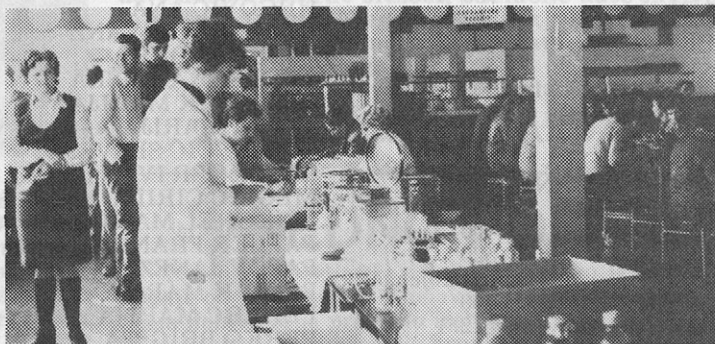
Darovana kri se skrbno spakira.