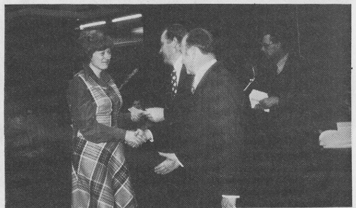
Jubilejna nagrada in stisk roke