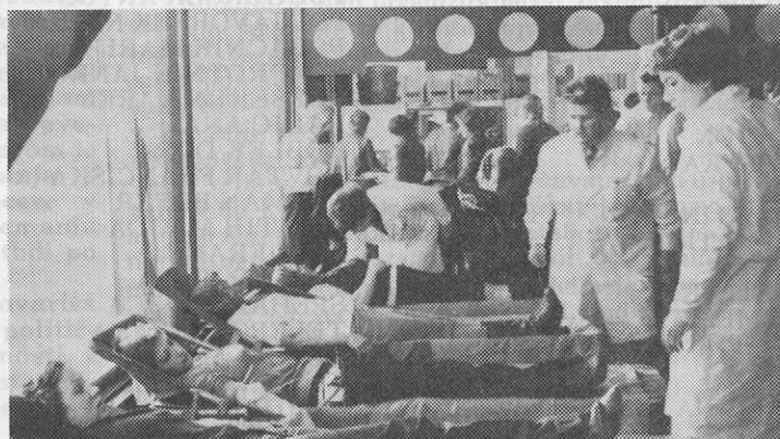
V februarju je bila v Ludbregu krvodajalska akcija. Preko 100 delavcev iz TOZD Budućnost se je udeležilo odvzema in tako pokazali svojo plemenitost, humanost in ljubezen do sočloveka. Vsak krvodajalec je pri sebi sigurno občutil resnično zadovoljstvo pri zamisli, da je s svojo krvjo rešil neko življenje.