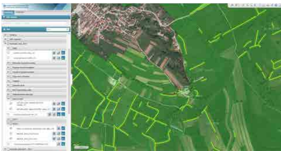
Označene mejice (le rumene črte), za katere se kmetje lahko vključijo v ukrep KRA_MEJ, seveda zgolj znotraj območja Natura 2000 (zelena barva prosojnice) v okolici cerkve sv. Jakoba v Blatni Brezovici. Kar nekaj robov ni vključenih niti v območju Natura 2000.