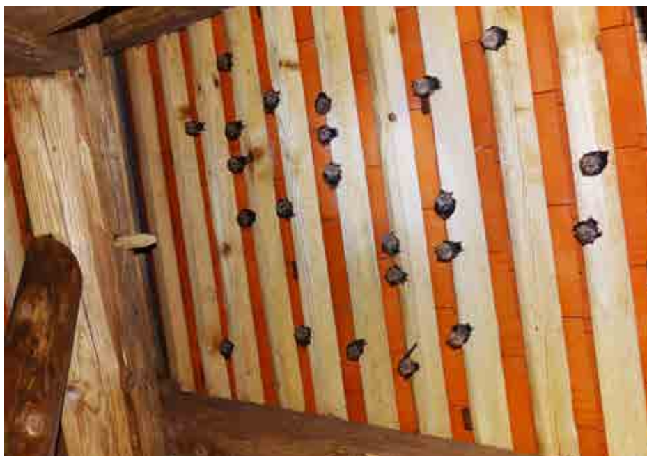
Desetina skupine malih podkovnjakinj ( Rhinolophus hipposideros ) z mladiči v cerkvi sv. Jakoba v Blatni Brezovici.

Prispevek je nastal v okviru projekta MEJ-MO JIH! – Pomen ohranjenih MEJic in MOKrišč za prilagajanje podnebnim spremembam in ohranjanje biodiverzitete (nosilec SHS, partner CKFF), ki ga sofinancirata Eko sklad, Slovenski okoljski javni sklad, in Ministrstvo za okolje in prostor v okviru razpisa za sofinanciranje projektov nevladnih organizacij na področju varstva okolja in podnebnih sprememb. ☘