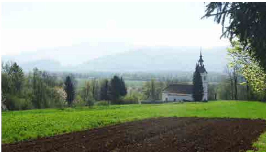
Do kotišča na cerkvi sv. Jakoba v Blatni Brezovici vodijo male podkovnjake zaenkrat še dobro ohranjene mejice.

Za uvod v branje priporočam kratka Navodila za izvajanje operacije Ohranjanje mejic v okviru ukrepa kmetijsko-okoljska-podnebna plačila (KOPOP), ki lepo orišejo naravovarstvene, okoljske, krajinske in kmetijske vidike mejic. Razumno so navedeni tudi vzroki, zakaj jih je vredno ohranjati, le definicija, kaj mejica je ali ni, je zelo ozka. Opredelevitev tako ne zajame vseh obstoječih mejic, živic, vetrozaščitnih pasov, živih mej in obrežne lesne vegetacije, skratka vseh podolgovatih pasov lesne vegetacije, ki jih pogosto poimenujemo kar linijske strukture (oz. mejice v širšem smislu). V prispevku besedo »mejica« tako uporabljam v najširšem možnem smislu. Mejice predstavljajo okrnjene koščke naravnih gozdnih robov, ki bi obstajali, če se človek ne bi naselil v Evropo in začel s kmetovanjem. Pri tem ne pozabimo, da tudi vrhovi krošenj predstavljajo svojevrsten rob. Kjer gozdov ni, morajo netopirji uporabljati njihov najboljši približek – in to so robovi, ki jih nudijo mejice. Na primer, med popisom netopirjev na obrobju Krasa smo več kot 80 % netopirjev zaznali v pasu, ožjem od 20 m od roba mejic. Seveda vse vrste netopirjev niso enako