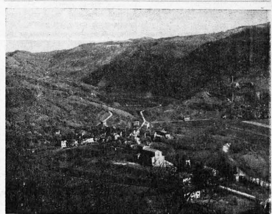
SV. LENART SLOVENOV

Nekateri narodi sploh ne poznajo naših posode in jedilnega orodja, s tem jih sezanijo šele tam naseljeni posamezni Evropejci. Vsi prirodni narodi se zelo neradi privadijo evropskim običajem. Kar velja pri teh ljudeh za samo ob sebi umetno, bi smatrali pri nas za neolikarstvo in nedostojno. S tem pa še ni rečeno, da vsi belokožci brez izjeme jedo dostojno. Mnogi jedo še grše kot največji divjaki in lepo jesti je velika umetnost, kateri ni vsakdo kos.