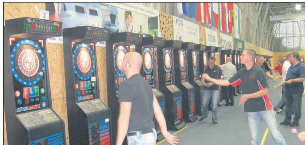
Štirje dnevi elektronskega pikada. Z evropskega prvenstva v elektronskem pikadu, ki je bilo v večnamenski dvorani v Podčetrtku.