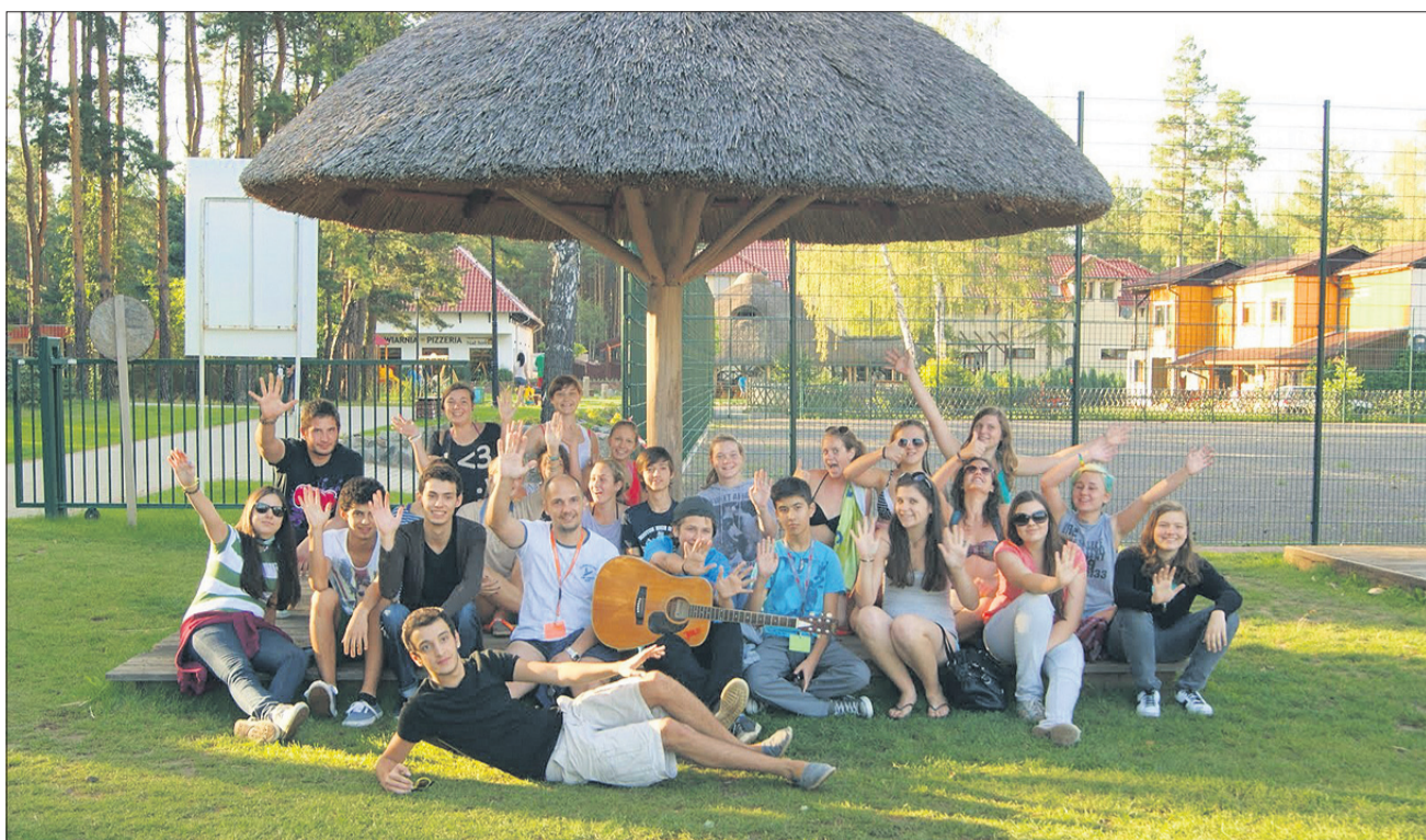
Šentjurčani so plesali in muzicirali tudi na Poljskem.