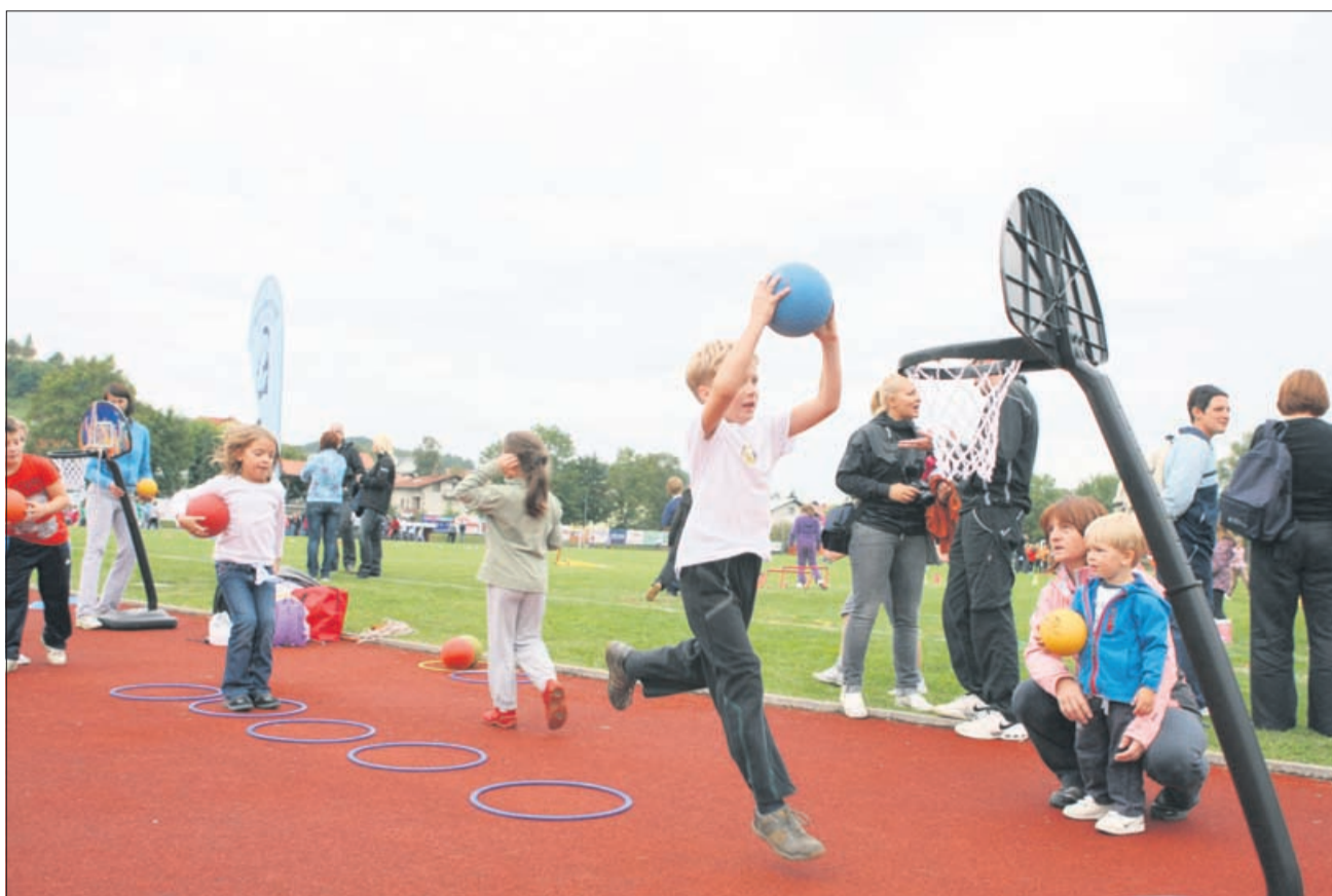
Zabijanje žoge v koš je vedno zabavno.