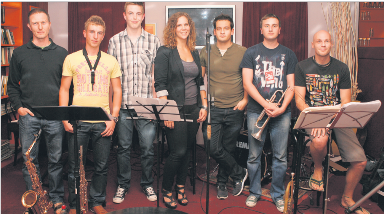
JB&Students so v Metropolu odigrali prepričljiv večer džez standardov in džeza različnih slogovnih obdobj.