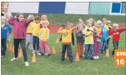
V Šentjurju zavlada olimpijski duh