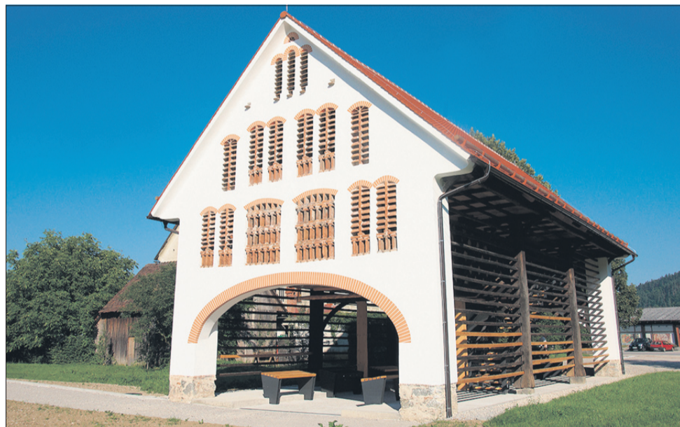
Bohačev toplar v središču Nazarij ponuja številne možnosti za družabne stike.

Muzejska zbirka se posveča še razvoju žagarstva, od ročnega razreza lesa do razvoja vodnih žag venecijank, dotakne pa se tudi razvoja splavarstva. Prav tako nam približa razvoj mizarstva in tesarstva v dolini. Poseben del razstave je posvečen razvoju lesne industrije, ki ima še danes pomembno vlogo v Zgornji Savinjski dolini.