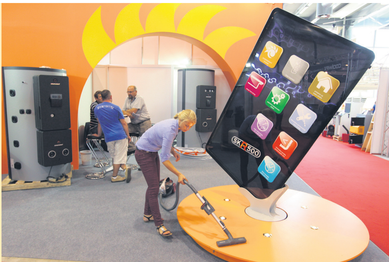
Med dogajanjem na Mosu smo velikokrat slišali opozorila, da brez učinkovitih vladnih ukrepov gospodarstvo ne bo preživel.

Po zatrjevanju ministra Žerjava imata v okviru tretjega paketa ukrepov za spodbujanje gospodarstva