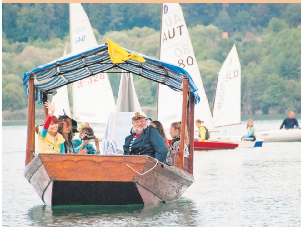
Novost na letošnjem Pikičnem festivalu je vožnja z ladjico in gusarskim kapitanom.