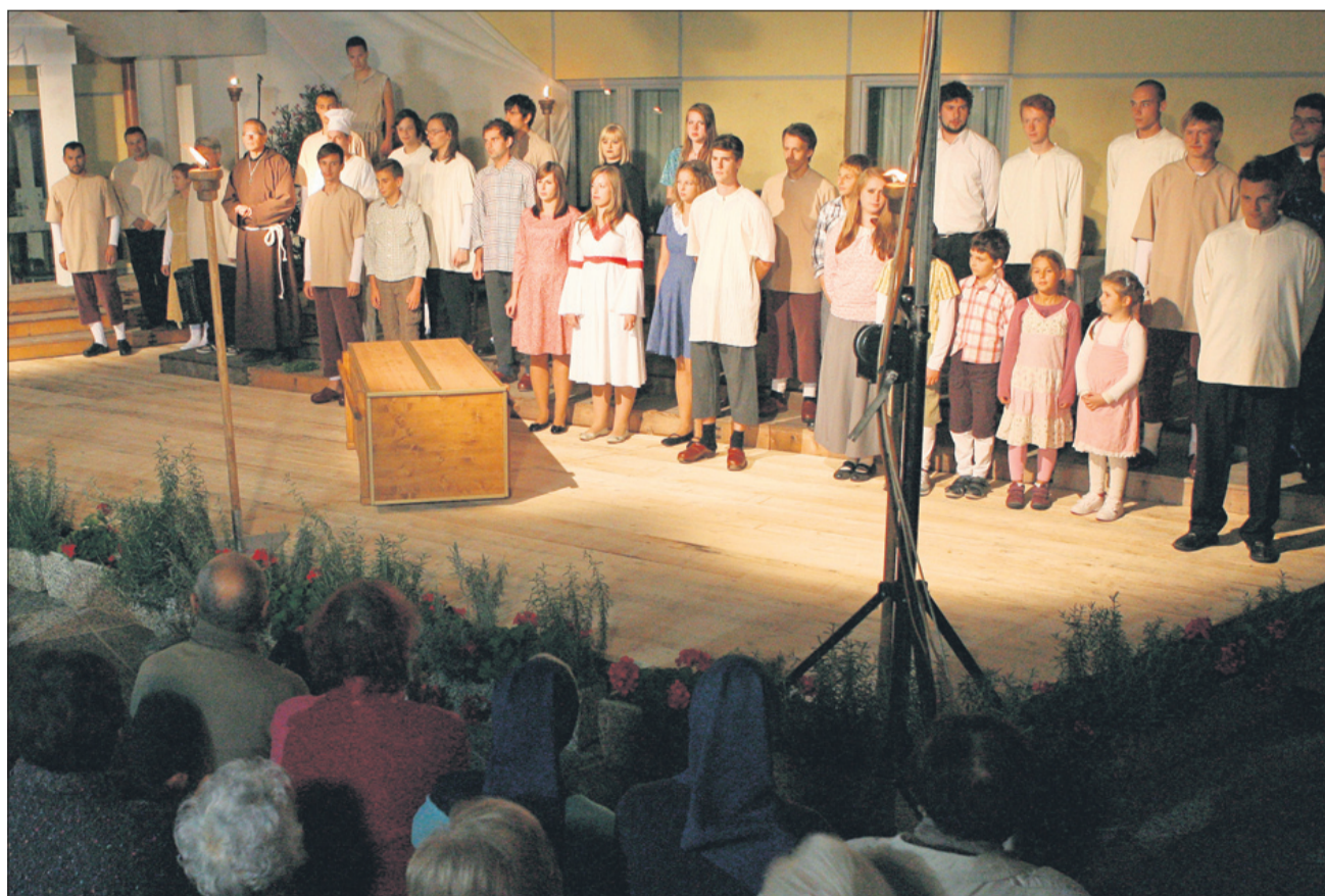
Slehernik je napolnil atrij pri sv. Jožefu do zadnjega kotička.