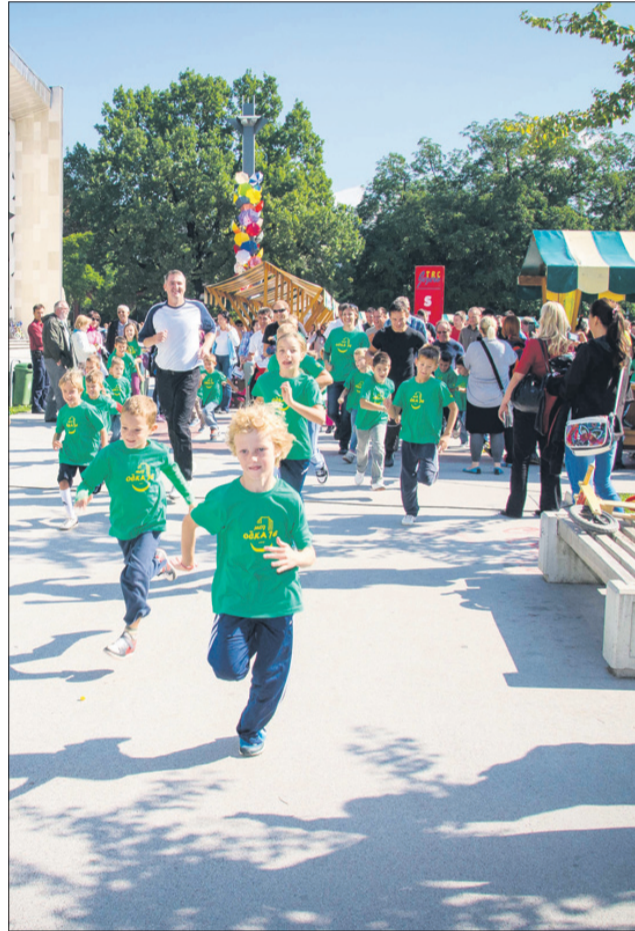
Otroci so se lahko pomerili tudi v sabljanju ter spoznali druge rekreativne športe. Očetje pa so se z otroki podali na tradicionalni tek.