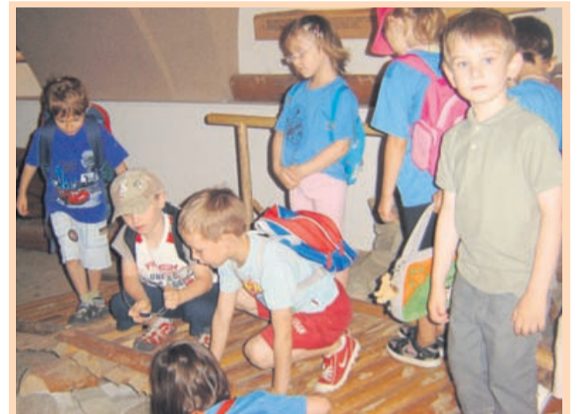
Najbolj številni obiskovalci muzeja so otroci.

Vsi posegi v kozolec ter njegovi elementi so zasnovani tako, da je zagotovljena celostna podoba objekta in posameznih prostorov, z vsem spoštovanjem do kozolca kot dela slovenske kulturne dediščine. Tudi zato danes predstavlja Bohačev toplar pomemben kulturni spomenik kraja. Dogajanje so obogatili s pomočjo projekta Dobimo se na tržnici.