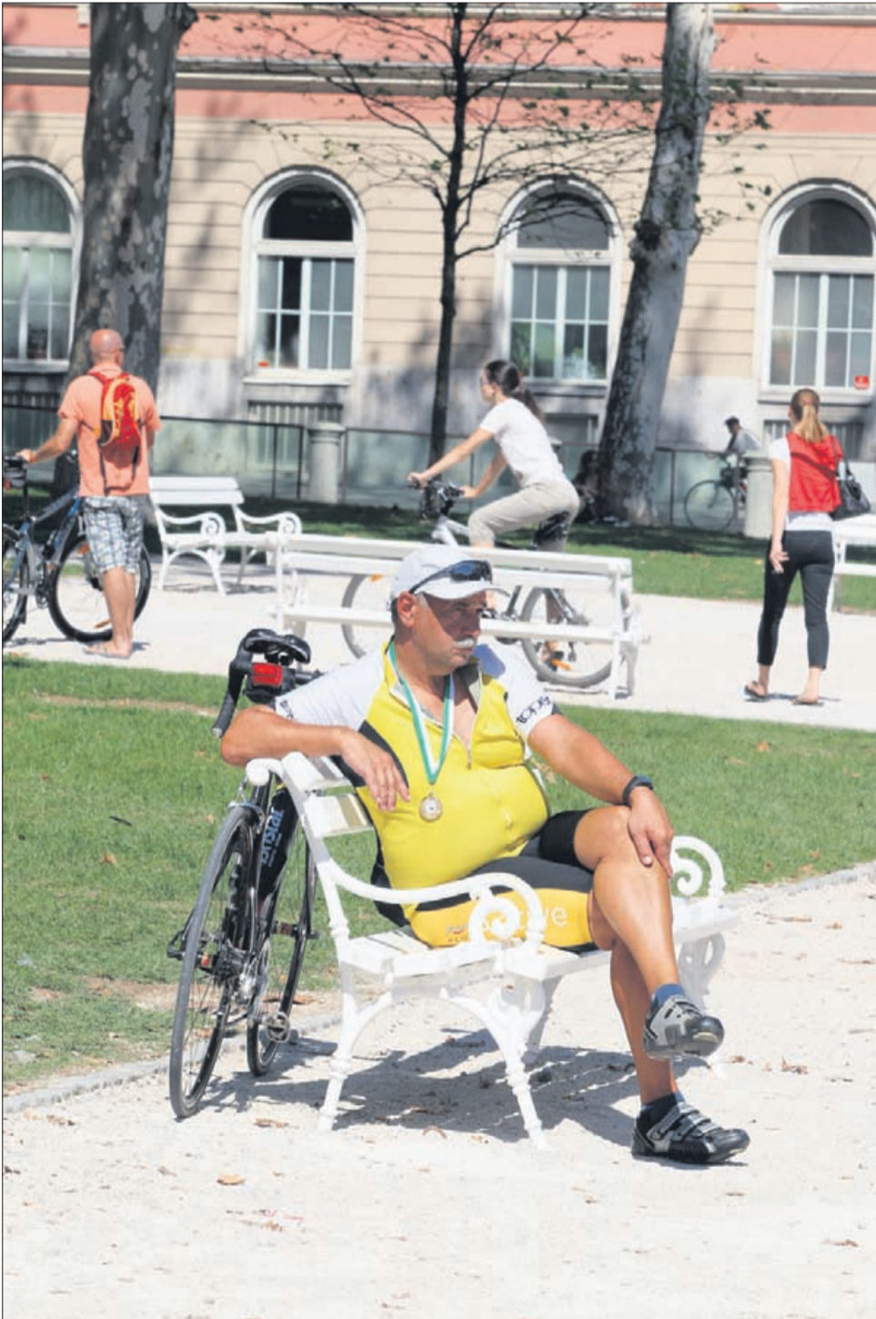
»Šport nam je vsem v pogubo!« (vir: Samo Roš, facebook)