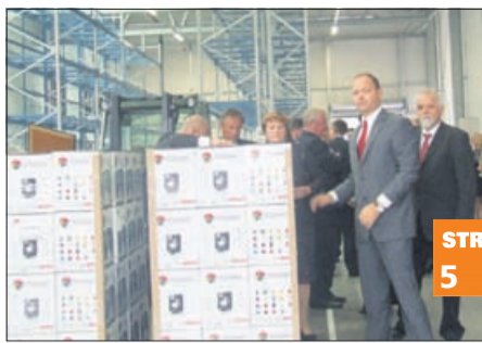
BSH utrjuje svoj položaj