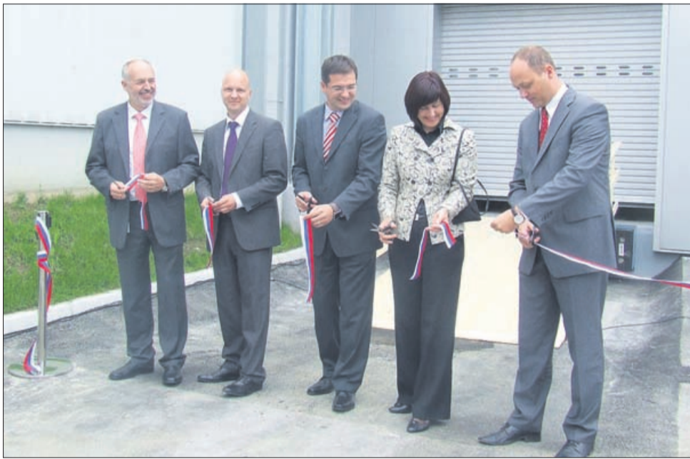
Pred nazarskimi Hišnimi parati so prerezali še en otvoritveni trak.

To je odgovor OZS tudi na morebitne spremembe zborničnega sistema in na zagotavljanje članstva. »Priča smo sesuvanju te hiše, vendar tega ne bomo dovolili. Vsak, ki sodeluje pri projektu Mozaik, ki predstavlja to, kar potrebujemo, oblikuje zgodbo tisočih priložnosti, ki bo povezala male obrtnike in podjetnike v še močnejšo organizacijo,« je odločen. Pismo o nameri so v petek podpisali tudi s Hrvaško obrtno zbornico. US