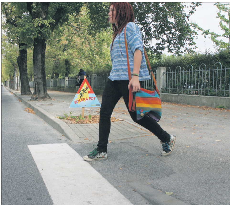
Profesorji, kaj je šolska pot?

Plaz. In ravno njene zadnje besede odpirajo enega od vidikov, ki se ga menda vsa vodstva šol ne zavedajo dobro. Pri pripravi člankov na to temo v zadnjih letih smo bili večkrat opozorjeni ravno na to: da šole sicer odreagirajo, kadar se nasilni primer med šolarji ali dijaki zgodi na šolskem prostoru, ko pa se nasilje dogaja na šolski poti, torej na poti dijakov in šolarjev v šolo ali iz nje, pa se šole rade od problema distancirajo. Ob tem je treba dodati, da vseh šol ali profesorjev ne smemo metati v isti koš, res pa je – česar se profesorji tudi zavedajo, ko se z njimi neuradno pogovarjamo – da skoraj vsak pozna primer, ko so kakšen spor, pretep ali šikaniranje med