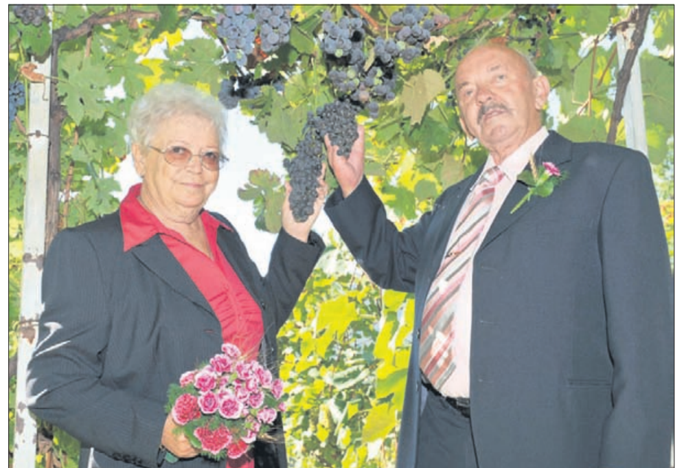
Zlatoporočenca v svojem vinogradu