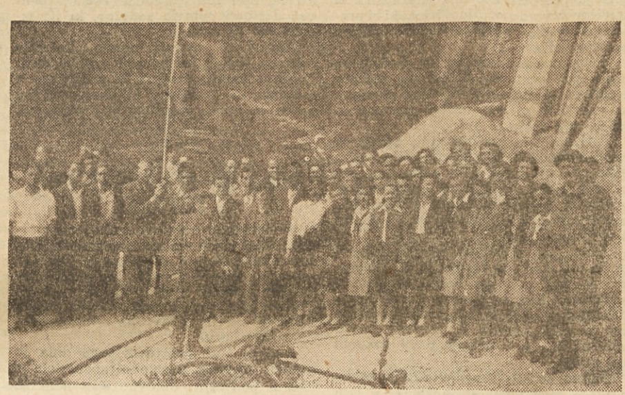
Frontna brigada iz Zagorja odhaja na sečnjo lesa v Mozirje