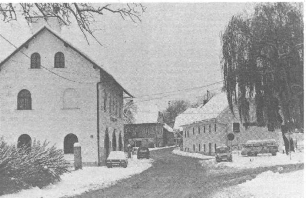
Viška panorama: novi metri asfalta in stanovanja servisov ob Viški očitno ne bo nič, ker se je zataknilo pri denacionalizaciji zemljišč. Jasno ni tudi, kaj bo z viškim pokopališčem. Že nekaj let je v načrtu njegova razširitev in gradnja nove mrliške vežice, vendar

pa se zadeva nikakor ne premakne z mrtve točke. Vse več je pripomb, da je treba zadevo že vendar enkrat pospešiti, toda nikomur ni jasno kako. BRANKO VRHOVEC