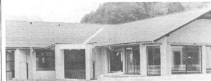
Trgovina osnovne preskrbe je za krajanje Šaleka velika pridobitev

Nova trgovina bo za stanovalce nove stanovanjske soseske Šalek in bližnje okolice zelo velika pridobitev, razbremenila pa bo tudi trgovino Prehrana v krajevni skupnosti Edvarda Kardelja. Namenu jo bodo predali prihodnji četrtek, 7. julija ob 10. uri. (mz)