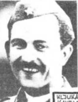
RUS. SA-HISTORIK KOSARK. KLUB KLUKA, KAVELJ