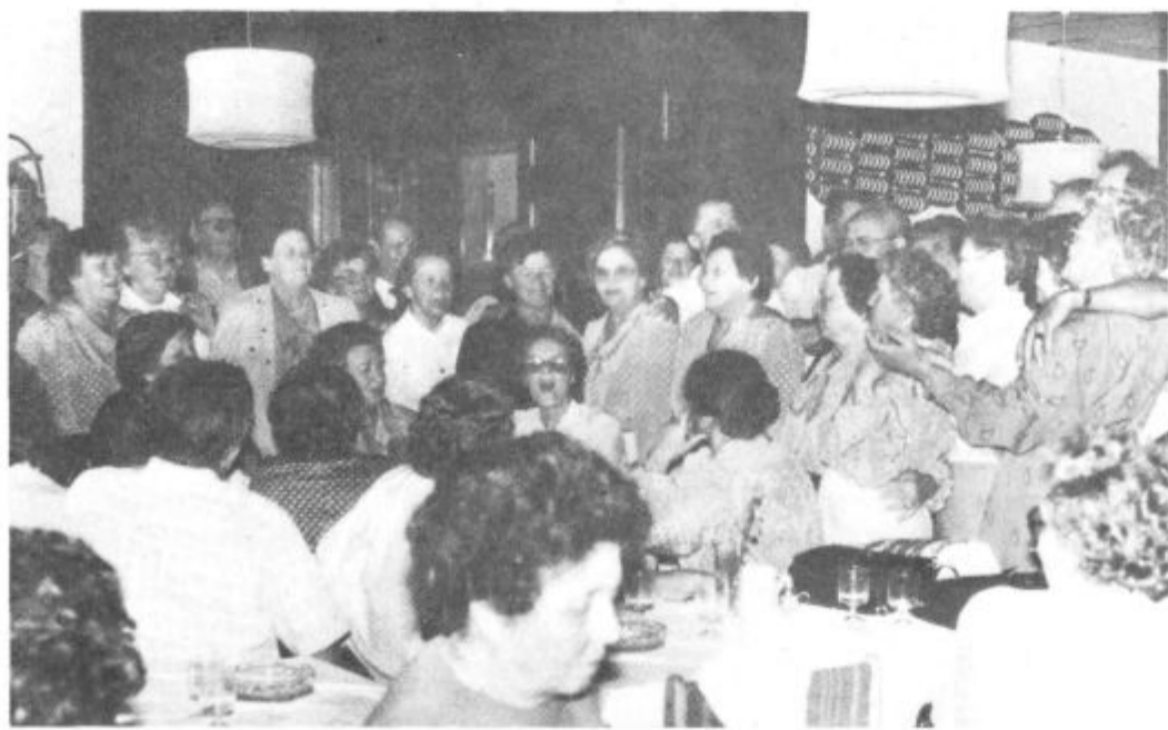
Ves prejšnji teden so v občini Velenje potekale prireditve ob tednu upokojencev. Številnih športnih, kulturnih srečanj in družabnih dogodkov se je udeležilo veliko članov vseh štirih društev. Prijeten konec je bil v soboto na Rogli. Več o tem na 6. strani.

Danes ob 15. uri bodo v kavarni Reka podelili priznanja članom jamske reševalne čete, v soboto ob 18. uri bo v glasbeni šoli v Titovem Velenju slavnostna seja delavskega sveta sozda REK, osrednja prireditev ob prazniku pa bo 3. julija na kotalkališču v Titovem Velenju, skok čez kožo. Prireditev se bo pričela ob 9. uri.