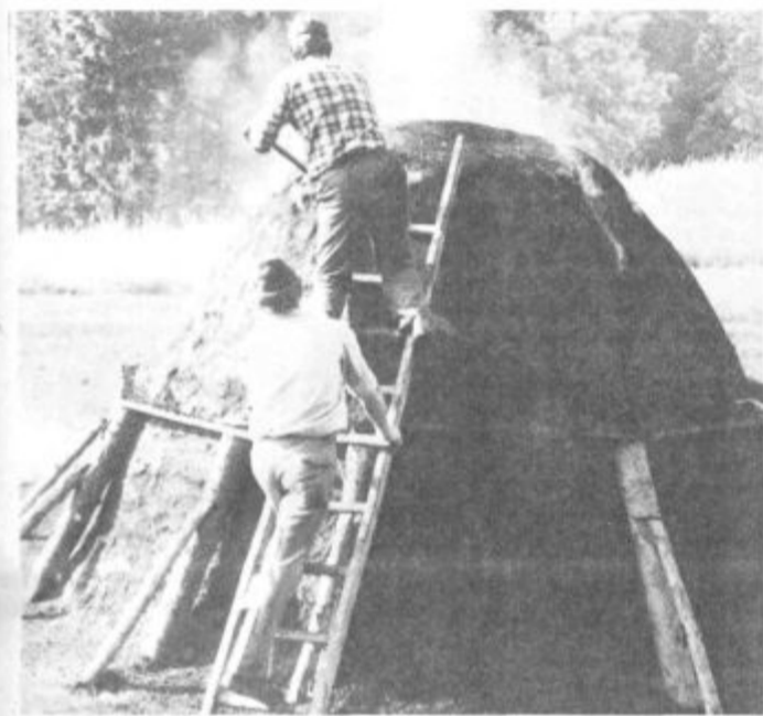
Pred prižgano kopo