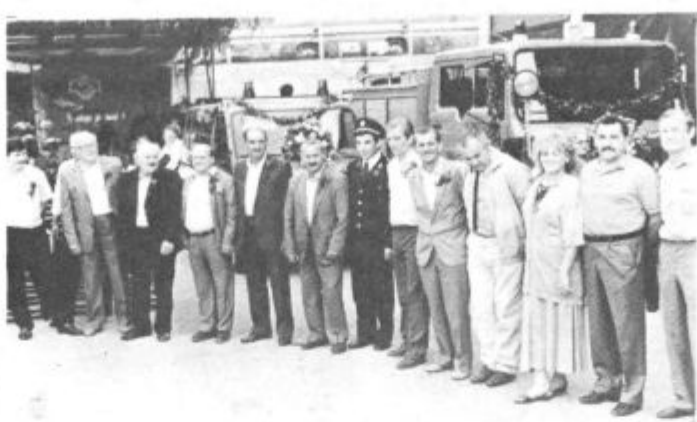
Novi vozili z botri