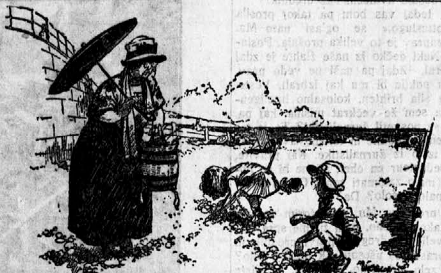
V morskem kopališču.

»Kaj pa delata tu, otročiča?« »Iščeva strica, ki sva ga tu nekje zakopala v pesek.«