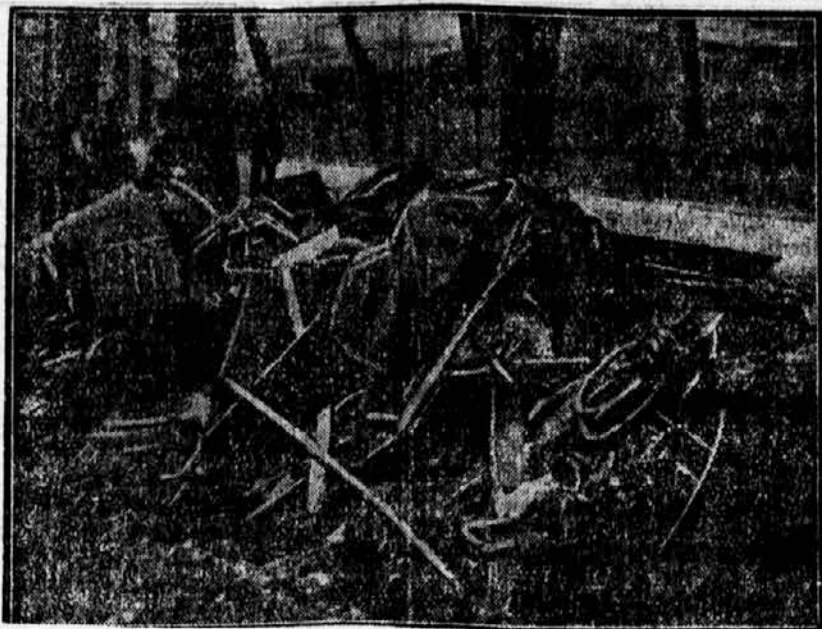
se je pripetila pri Schleizu v Nemčiji. Neki vojaški avtomobil se je zaletel v drevo in se popolnoma razbil, kakor vidimo na sliki. Štirje vojaki so bili pri tem ubiti, štirje pa težko ranjeni.