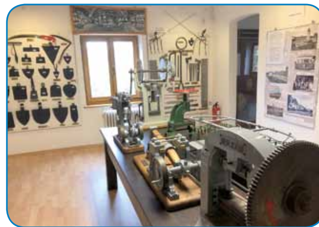
Na stenej kose, motke pa žage - na stoli modeli mašinski klapačov

material vküppobrati, smo čüli od direktorice. »V arhivaj smo najšli kejpje o gasilskom društvi pa šaulski mlajšaj. Gor smo ponücali stare razglednice tö.«