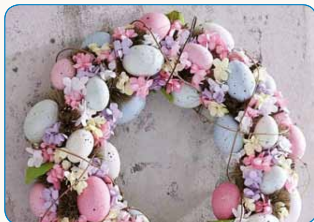
VELIKA NOČ JE ZAZNAMOVANA TUDI Z ZELENJEM stran 4