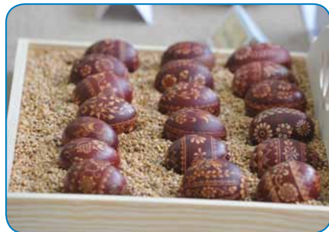
Z lükovimi lopinjami pofarbana djajca