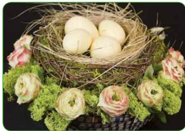
Dekoracija, primerna za velikonočni zajtrk

Največji krščanski praznik, velika noč, je povezan z nekaterimi rastlinami: drevesi in grmi, zelišči in cvetjem.