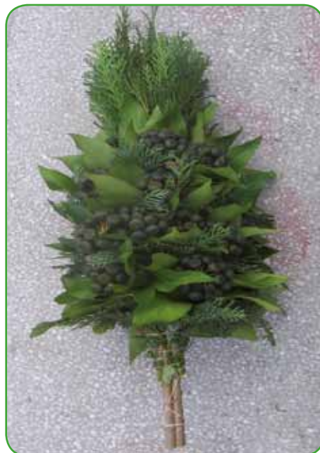
Butara oziroma presmec iz drevesastega bršljana s plodovi iz kleka

uporabne. Nekatere cvetijo že pozno jeseni, pozimi in zgodaj spomladi. Moške rastline s samo prašnimi mačicami so lepše. Pri nas v Prekmurju so s komasacijami skoraj izginile. Slišala sem, da naši cvetličarji uvažajo tudi mačice iz Nizozemske in jih prodajajo po dokaj visoki ceni. Mačice se sicer množijo z lesnatimi potaknjenci ali z grebenicami. V