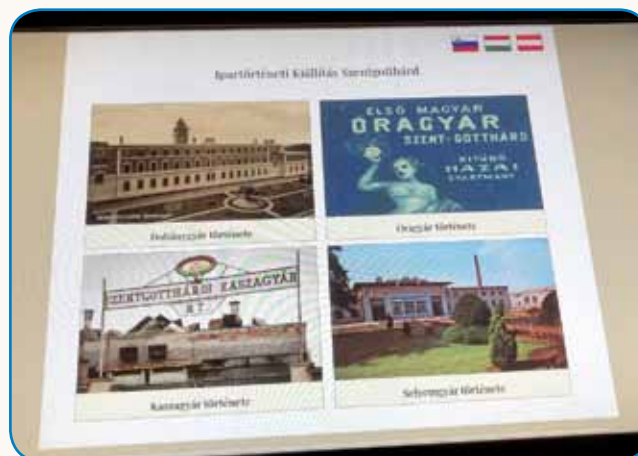
FABRIKE, GDE SO DOMANJI SLOVENCI DELO NAJŠLI stran 9