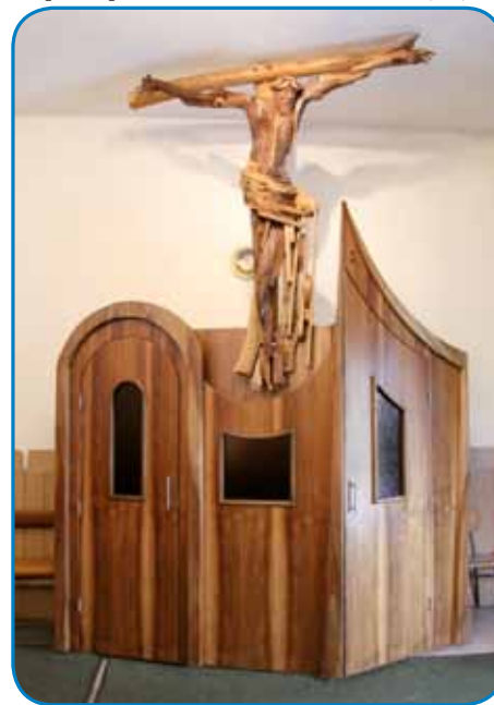
Kristus, cerkev Črenšovci