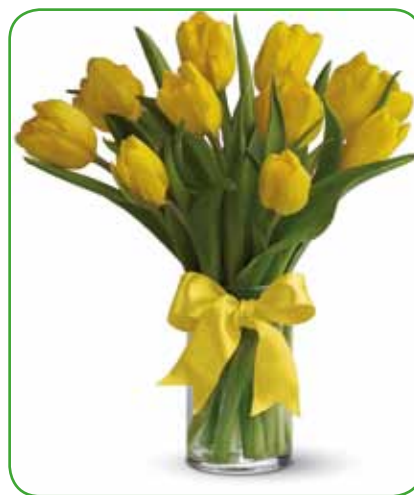
Rumena barva tulipanov prinaša v prostor poseben čar

Izbor narcis se nenehno veča in pri ljudeh so čedalje bolj priljubljene. Poznamo jih več vrst in jih delimo na: troben-taste z valjastim privenčkom, skledičaste, pladnjaste, vr-