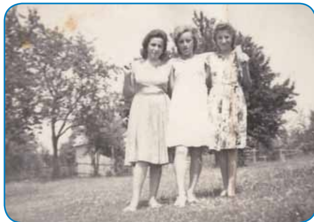
Na starom kejpi s padaškinjami

sausadje bilej, pri nas so edno kozo njali. Müva z Zetjin Pištinom sva pasla krave, kozo smo pa nej gledali. Kak je vöparvezana bejla