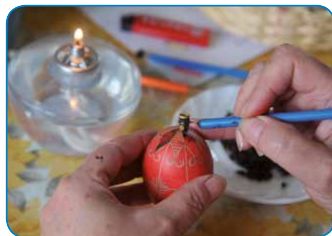
Tak se pišejo djajca