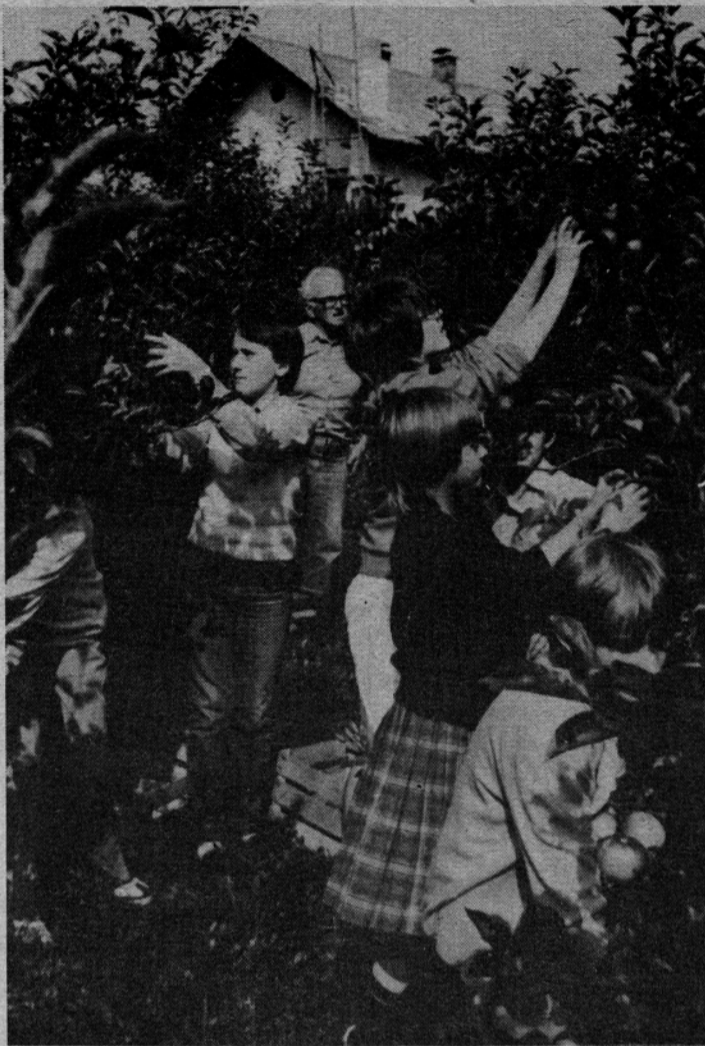
Šolski sadovnjak v Mozirju je obilo obrodil

Misli, ki nas obdajajo, ko stopamo sklonjenih glav mimo takih ali drugačnih grobov so kaj različne. Le malo kdo izmed nas pa je toliko močan, da ob tem pomisli na svoj konec in na usodo lastne gomile. Takšno razmišljanje ni prijetno, je pa potrebno, kajti, če bi tudi o tem malce razmislili, bi ravnali drugače. Spomnili bi se tudi tistega osamljenega groba na robu gozda za katerega največkrat skrbe šolski otroci in položili cvetje in prižgali svečo tudi na sosednjem, zapuščenem grobu. Občutili bi v sebi zadovoljstvo da med mrtvimi ni razlike!