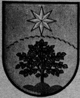
REČICA OB SAVINJI