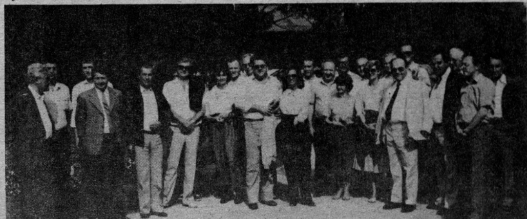
Mešana avstrijsko-jugoslovanska komisija za mejna vprašanja je obiskala tudi Savinjski gaj