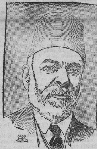
Ismael Kemal Bey

Poročali smo, da so v Valoni in drugih mestih albanski voditelji proglasili samostojnost Albanije in s tem vstvarili na Balkanu novo državo. Postavili so se takoj pod varstvo Avstro-ogrške in Italije. Izvolili so provi-