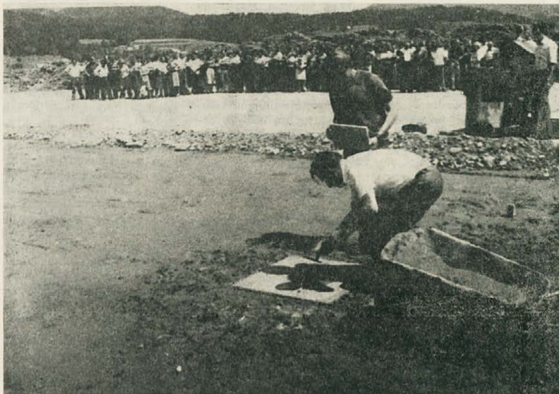
V soboto, 5. 8. 1978, smo položili temeljni kamen za izgradnjo novega lesnopredelovalnega kompleksa v Sp. Vižingi pri Radljah