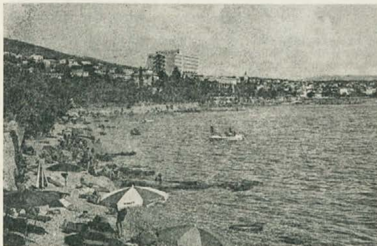
Sončniki vzdolž naše obale se bodo kmalu zaprli

Odločili smo se, da vprašamo nekaj naših delavcev, kako so bili zadovoljni z domačo turistično ponudbo.