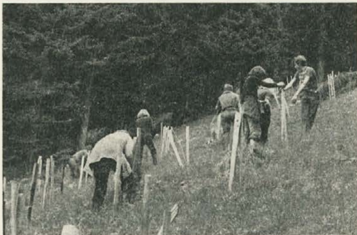
Pri štetju macesna, ki so ga poškodovali mufloni