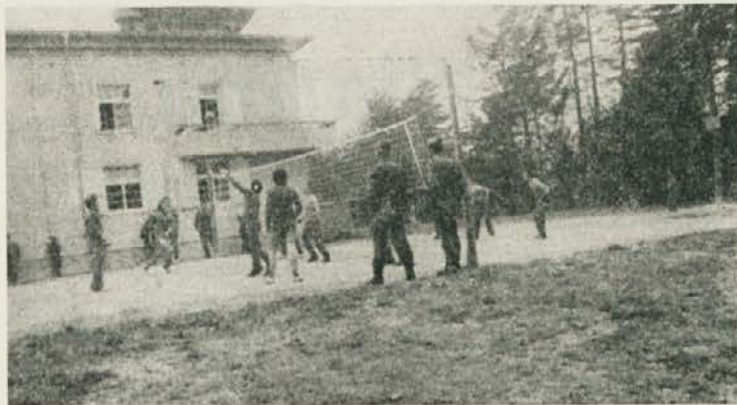
Pomerili smo se na športnem polju