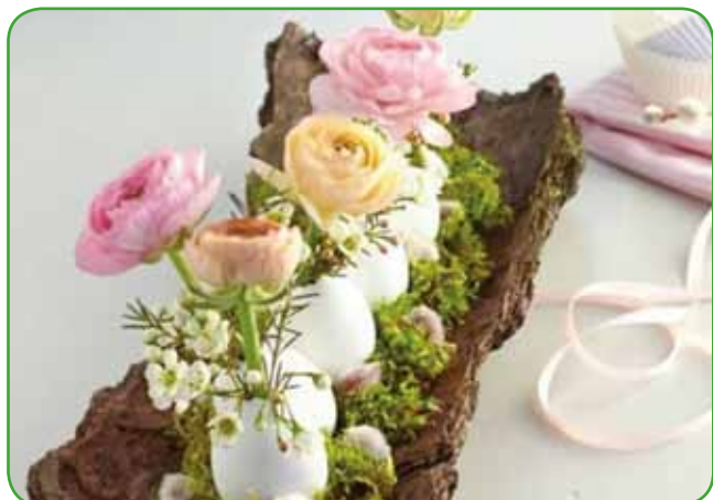
Spomladanske zlatičevke (ranunkule) v jajčnih lupinah

se svoji domišljiji in uživajmo pri ustvarjanju iz naravnih materialov zelenja in cvetja. Praznovanje ve-