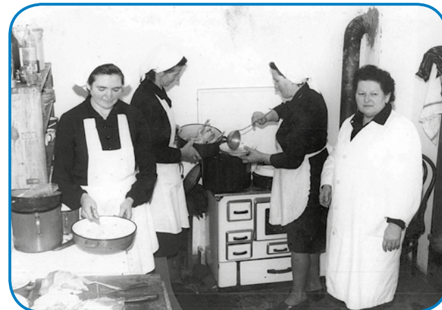
Küjarski tečaj v Küstanovcaj konec 60. lejt 20. stoletja

Prekmurci, s sterimi se je pogučavala, so v glavnom pravli, ka so nej bili lačni. »Mi smo brez krüja nej bili, bili smo siromacke, dapa krüj smo sigdar meli, ka so odili na repo, pa smo sigdar