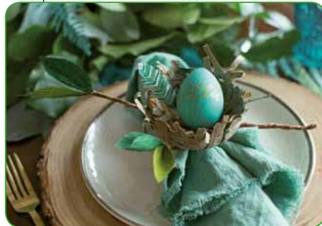
Vse okusne jedi pridejo toliko bolj do veljave ob okrašeni mizi

odrežemo in postavimo v večjo okrasno posodo, kjer je prav tako napolnjena z vodo.