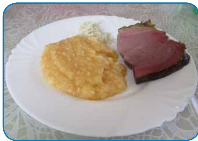
Šunka z grenom in krumplovimi žganiki v Trdkovi

tudi kak se je prenašalo küjarsko znanje. Med tistimi, steri so njoj pripovedjali, so bili tudi takši, steri so se spaumili, kak je bilau v prvi polovici 20. stoletja, za tisto, ka se je godilo prva, pa je podatke