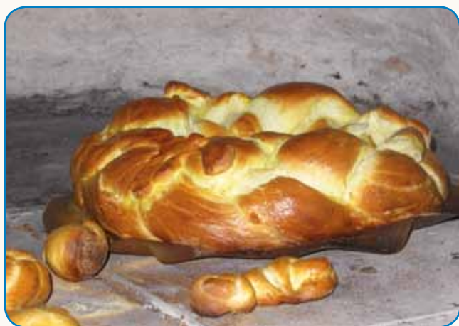
Biba, zounik, gibanca, beliš ... stran 3