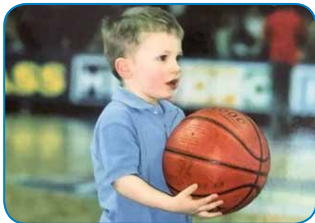
Luka Dončić je s košarkarsko labdo gorraso

Tisti ljubitelji športa, steri ponoči ne moremo spati, mamu tau srečo, ka leko po televiziji večkrat gledamo kakše vragolije s košarkarsko žogo v ligi NBA dela Luka Dončić, steri je