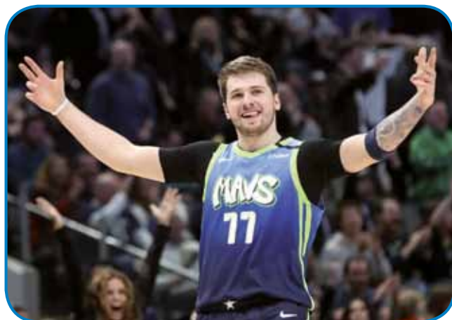
Luka Dončić od leta 2018 špila za ekipo Dallas Mavericks

8 trojnih dvojčkov. V lanski sezoni je svojo ekipo prvopaut pripelo do končnice, med ekipe, stero se odlaučale o prvaki NBA. V šestih nastopaj, v sterih je s 4:2 bila baukša ekipa LA Clippers, je Dončić v povprečji dau 31 točk, meu pa je ške 9,2 skoka