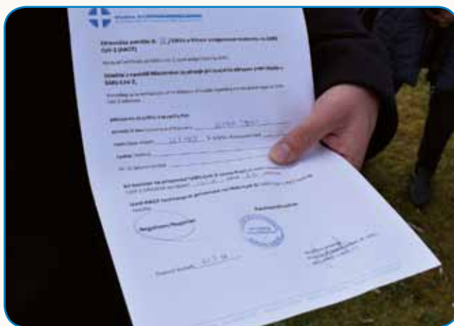
Za lažji prestop meje stran 4