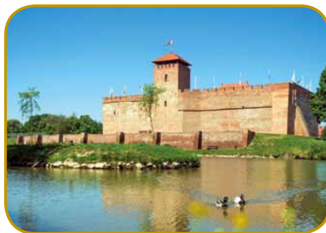
Grad v Gyuli ne stogi na visikom bregej - z jezera kauli njega leko napravimo lejpe fotografije

Té varaš je venak najlepši kinč županije Békés. Največ lüdi ga gvušno zavolo ciglenoga grada gorpoiške, šteroga so zozidali v 14. stoletji, je pa eden sami cejli gorausto