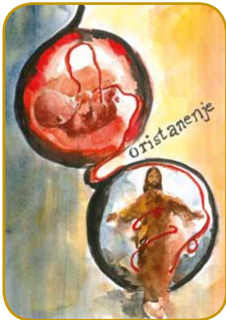
Jezoš je pravo: »Jas sem goristanenje i žitek; ki vörje v meni, če tüdi mrgé, živo baude. I vsakši, ki živé i vörje v meni, ne mrgé na vöke.« (Jn 11,25-26)

milov naturov pa je dose-gno, ka so stari Slovinci radi gorvzeli krščanstvo. Poganske rabuke so vövdarile samo po njegvoj smrti. Modest je mrau kauli leta 763, pokopani je pri Gospej Svetoj. Njegvi den držimo 31. marciuša .