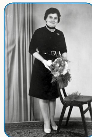
Dosta delati pa dosta se smejati stran 8