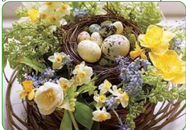
Preprosta dekoracija za bivalni prostor iz vej vinske trte, različnih narcis in različno velikih jajc z dodatki modrih hruščic

vrbovih vej, njihove konice upognemo do mesta, kjer so bile odrezane. Ne bodo se zlomile. Nato s tanko žico ali rafijo obesimo na te upognjene veje prazne jajčne lupine, jih napolnimo z vodo in dodamo cvet ali dva. Šopek spodaj ravno