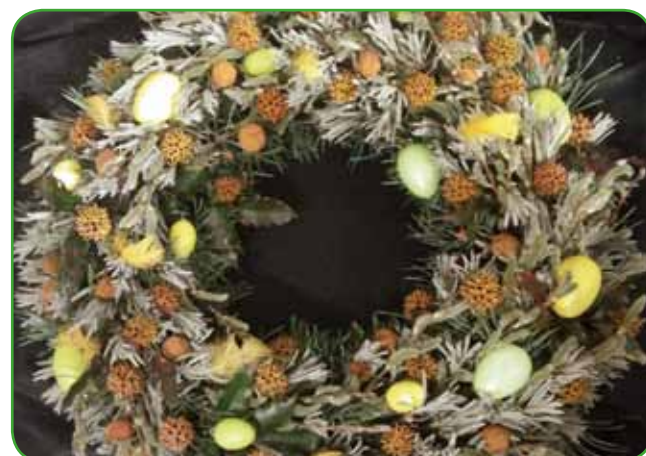
Velikonočni venec je bogat z materiali, nabranimi v naravi, popestrjen z jajčki in perjem

Spomladanske čebulnice so pravšnje za namestitev v okrasno posodo ali ple-