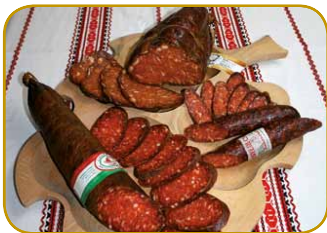
»Čabianska klobasa« je hungarikum - samo kauli Békéscsabe pa brezi fejfra go leko redijo

Končno pridemo v varaš Orosháza , od šteroga parlamentarni poslanec je med letoma 1869 in 1872 biu revolucionarni pisatelj in političar Mihály Táncsics. Od gimnazije, štera nosi njegov