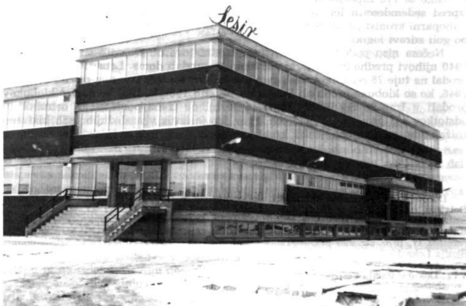
Novo poslopje Tovarne klobukov Šešir v Škofji Loki

naložbe in si nakupili dvaindvajset novih strojev in aparatov ter sušilnico, čez pet let pa so si nakupili še dodatne nove stroje. V sedemdesetih letih so se domala vsako leto nekoliko posodobili in se po modernizacijah v zadnjih desetih letih menda enakopravno merijo s podobnimi tovarnami v razvitem svetu.