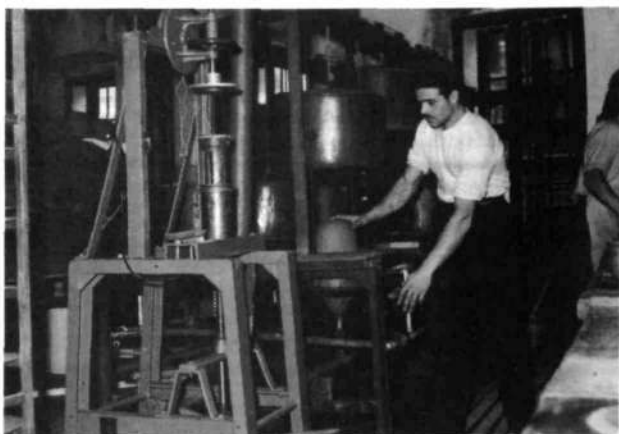
Strojno oblikovanje v starem obratu

Leta 1945 je že 20. maja Narodna vlada Slovenije postavila svojega delegata, 9. novembra naslednjega leta pa so ustanovili Tovarno klobukov Škofja Loka, ki