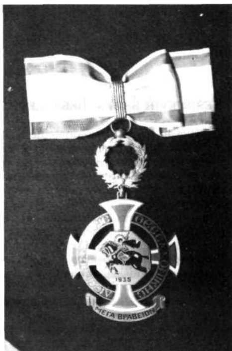
Odlikovanje: Velika nagrada Šeširju za najkvalitetnejše izdelke na mednarodni tekstilni razstavi v Solunu leta 1935