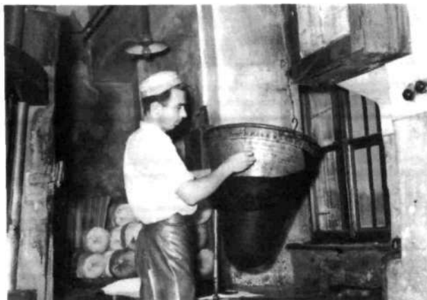
Snemanje tulcev z zvona v starem obratu

Toda Šešir je le ostal »šešir«, se pravi tovarna klobukov, razširitve poslovanja pa nedvoumno kažejo na birokratizem povojnega obdobja, na čase, ko je prejšnji gluhi kapital zamenjal državni aparat in proti kateremu je bilo tudi stavkati večji greh kot tedaj, v težkem letu 1935. V povojnih letih je bila tovarna namreč v izredno težkem položaju. Podedovala je izredno osiromašen strojni park, saj ga v času vojne niso vzdrževali, pa tudi vsa oprema je s stavbami vred kazala težavno sliko. Šele leta 1959 so začeli stroje zamenjevati; tedaj so kupili dva italijanska stroja za polstenje, enega za pihanje dlake, enega za brušenje glave, še enega za brušenje okrajev in enega za apretiranje. S tem se je renoviranje začelo, se v letih 1960 in 1961 skromno nadaljevalo, 1962 pa so si v Šeširju privoščili nekoliko večje