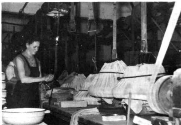
Peščena stiskalnica v starem obratu

so jo 25. februarja 1947 tudi registrirali in ji določili kot predmet poslovanja izdelovanje moških klobukov in ženskih tulcev. Kot vidimo, so zbrisali prejšnje ime tovarne, kar pa so 13. marca 1954 popravili in Šešir je postal spet Tovarna klobukov »Šešir« Škofja Loka. Predmet poslovanja so širili v letih 1956, 1957, 1959, 1960, 1963 in 1964, ko so si med drugim pripisali tudi »izdelovanje sobnega in stavbnega pohištva za družbeno pravne osebe v mizarški delavnici«.