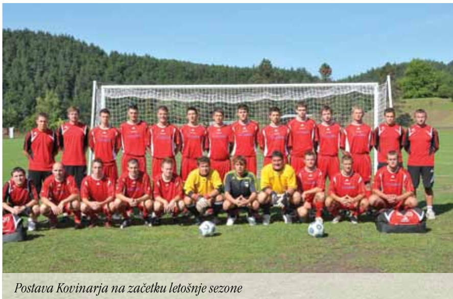
Postava Kovinarja na začetku letošnje sezone