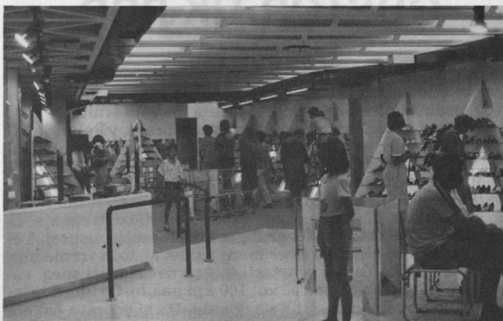
Na Deteljci je končana prenova spodnjega dela trgovine. To je ženski oddelke urejen na samopostrežni način.

Ne vem kako se ne spoznam, ker še nisem dolgo tu. Če primerjam oddelke ni bistvene razlike. Pričakujemo seveda več. Prav je da smo šli v novo ocenjevanje, ker pravijo, da je bilo zadnje pred več kot desetimi leti. Ocenjevanje mora biti seveda objektivno in pravilno. V kolikor pa to je, ne vem.