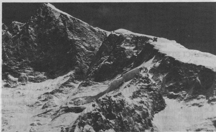
Gora se ni pustila poraziti. Spodaj levo je označen tabor 2, v sredini tik ob snežnem previsu tabor 3, z znakom x pa označena dosežena višina.