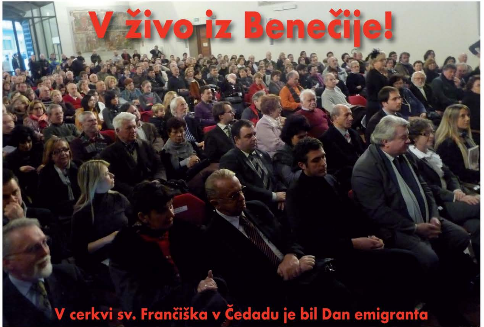
V cerkvi sv. Frančiška v Čedadu je bil Dan emigranta