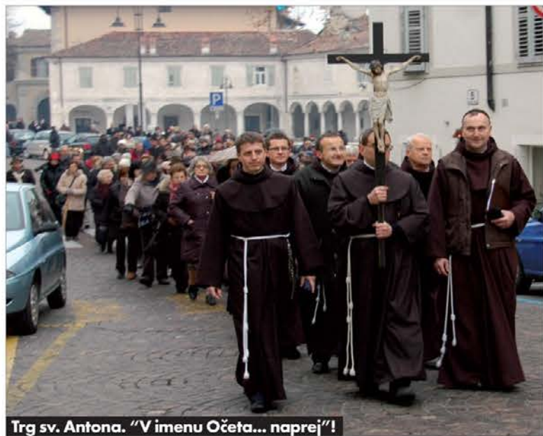
Trg sv. Antona. "V imenu Očeta... naprej!"

leti je bila tu ustanovljena Slovenska čitalnica, tu so potekala protestna zborovanja za uveljavljanje pravic Slovencev v Italiji, tu je 100-letna slovenska knjigarna in sedež naših ustanov. Slovenska prisotnost je močna tudi v Gosposki ulici, kjer so imele sedež slovenska posojilnica, Goriška tiskarna, narodna knjigarna, Goriška matica idr. Pod obokom nekdanjega gostišča Pri treh kronah, kamor je z drugimi pomembnimi goriškimi Slovenci rad zahajal tudi Simon Gregorčič, se začena ul. Favetti (nekdanja Kočijaška ul.). Procesija, ki so jo vodili frančiškani z