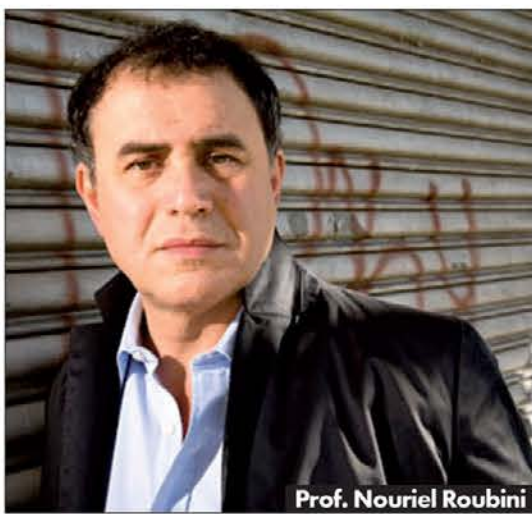
Prof. Nouriel Roubini