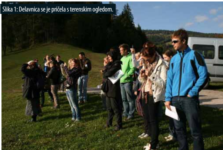
Slika 1: Delavnica se je pričela s terenskim ogledom.