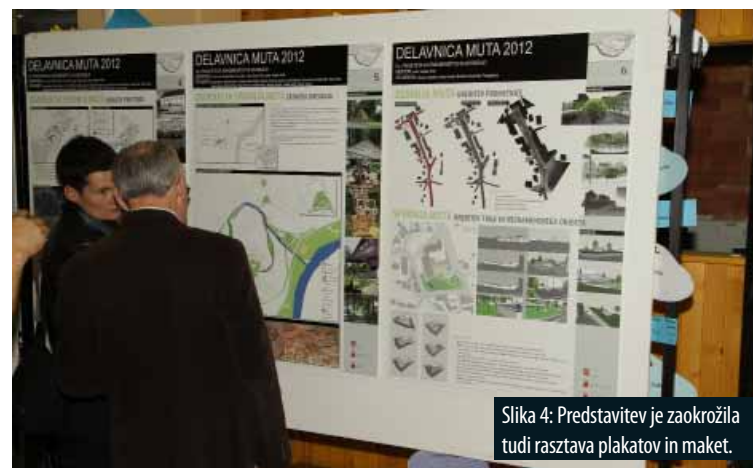
Slika 4: Predstavitev je zaokrožila tudi razstava plakatov in maket.

The main challenge was poor development of functions and public services, and problems in the current traffic and spatial arrangement in the key settlements of the Muta Municipality. To make matters worse, the town of Muta is divided into Zgornja Muta ('Upper Muta') and Spodnja Muta ('Lower Muta') which function as two different settlements. The proposal consisted of a stronger connection of both areas and of diversification and distribution of public services between the two. In Zgornja Muta, a shift of the town's main axis is proposed. The new orientation is from Town Hall to the main church.