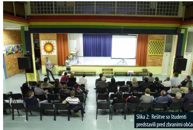
Slika 2: Rešitve so študenti predstavili pred zbranimi občani