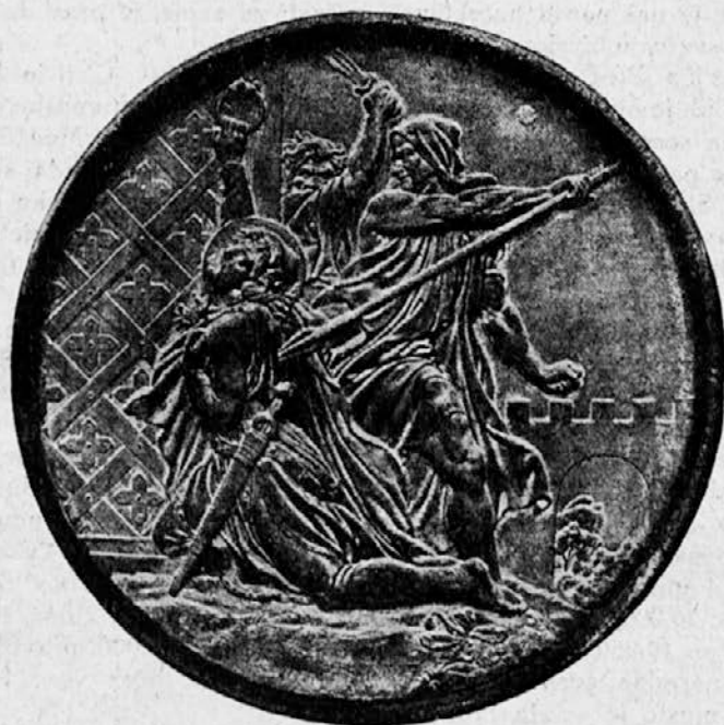
Brat umori sv. Vaclava.

Češki narod slavi letos 1000letnico mučeniške smrti svojega kneza sv. Vaclava. Na slovesen način hoče proslaviti ta spomin tudi češki Orel. Zato je povabil na to proslavo, ki se imenuje »svetovaclavska« in bo dosegla svoj višek v septembru, ko bo slovesno posvečena cerkev sv. Vida v Pragi, vse katoliške telovadce vsega sveta in seveda med njimi v prvi vrsti jugoslovanskega Orla. Naši Orli gredo v Prago 1. julija in se vrnejo 10. julija, Mladci se pa odpeljejo že 27. junija. Vam bom pa malo povedal o sv. Vaclavu, o Češki in o češkem Orlu.