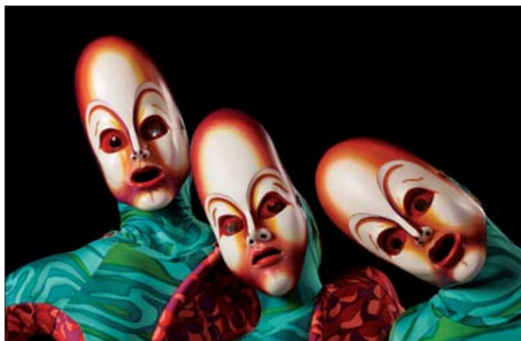
Med resničnostjo in sanjami.