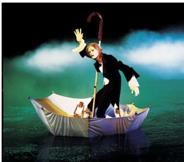
Glavni element predstave "O" je voda.