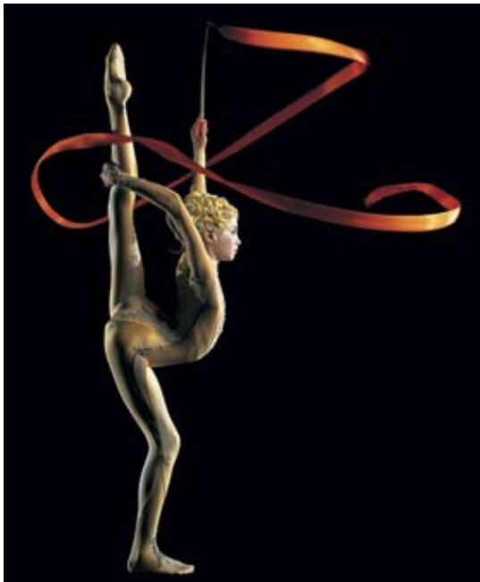
Alegria je mešanica baročnih kostumov in klasične opere.

A priložnost za uresničitev njunih sanj je prišla hitreje, kot sta si mogla misliti. Leta 1984 je mesto Quebec praznovalo 450. obletnico prihoda Jacquesa Cartierja v Kanado in njenega odkritja, praznik, ki so ga želeli posebej bogato praznovati. Potrebovali so nekoga, ki bi jim znal pripraviti nepozabno predstavo, s katero bi praznično vzdušje lahko ponesli tudi v druga mesta