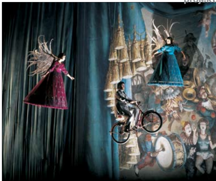
Predstava Corteo je skrivnostna komedija, ki se odvija nekje med nebom in zemljo.

Poleg šestih predstav (Mystere, Zumanity, LaNouba, "O", KA in Love), ki jih izvajajo v velikih dvoranah hotelov in zabaviščnih parkov v Las Vegasu ter v pravljичnem svetu Walta Disneyja v Orlando na Floridi, pa s svojim modro-rumenim šotorom in šestimi drugimi predstavami (Varekai, Dralion, Quidam, Alegria, Saltimbanco, Corteo) potujejo po vsem svetu in navdušujejo gledalce vseh kontinentov. Z nekaj sreče jih letos lahko ujamete v enem izmed evropskih mest in si ogledate predstavo Dralion, morda na službeni poti v Tokio naletite na njihovo Alegria ali pa počakate do leta 2008, ko bo Cirque du Soleil skupaj s podjetjem Las Vegas Sands slavnostno odprl sedmo stalno prizorišče v Macau na Daljnem vzhodu.