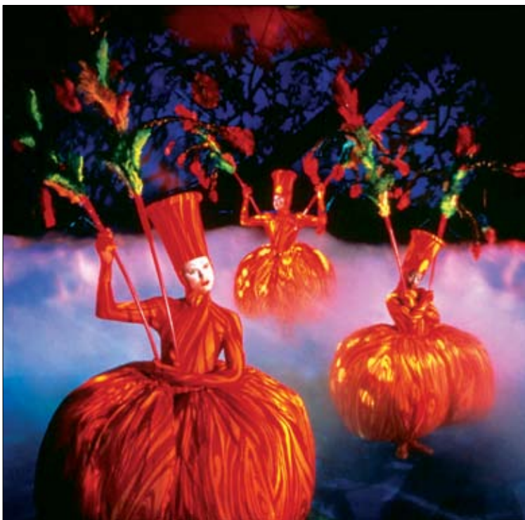
Mystere je kalejdoskop atletike in akrobatike. Igrajo ga v Treasure Islandu, Las Vegas, ZDA.

po deželi. Guy Laliberté je s svojim predlogom uspel prepričati mestne očete in predstava, ki jo je poimenoval Cirque du Soleil (Circus of the Sun), je krenila na pot.