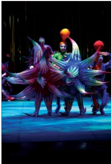
Nekje globoko v gozdu obstaja skrivnostni svet Varekai, v katerem je vse mogoče.