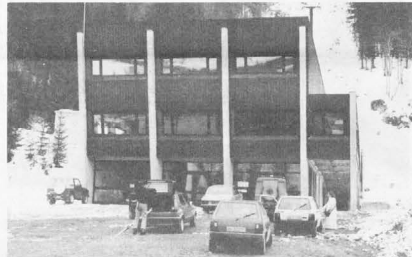
Spodnja postaja žičnice

ninka, ki ima že 15 let dela za sabo. V tem okviru je leta 1978 nastalo društvo Lepi vrh. Tu imajo tečajje slovenskega jezika — letos je že 12. leto — in glasbeno šolo, kjer poučujejo profesorji iz Kranja. Do lani pa so učitelji hodili iz Jesenic.