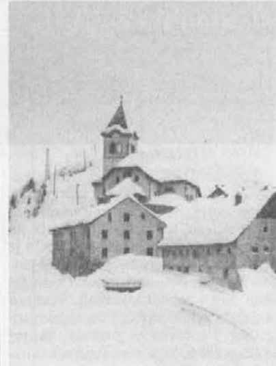
Višarje pod snegom