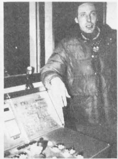
Komandni pult žičnice

Poleg Slorija deluje v Kanalski dolini, pravzaprav v Ukvah, zbor Pla-