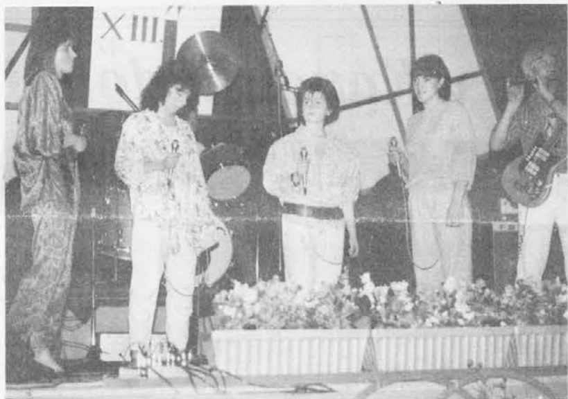
Čeče za ljubezan so lan piele «Ist čem živiet». An lietos?