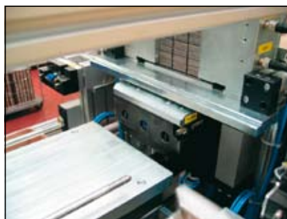
Slika 11. Dodajanje pregrad v okvir

Slika 11 prikazuje zalogovnik s pregradami in čelo pehala, ki je opremljeno z elementi za pozicioniranje pregrade, s senzorjem za zaznavanje le-te in vakuumskim prijemalom. Pregrade so zložene v zalogovniku, od koder jih mehanizem dodaja na čelo pehala.