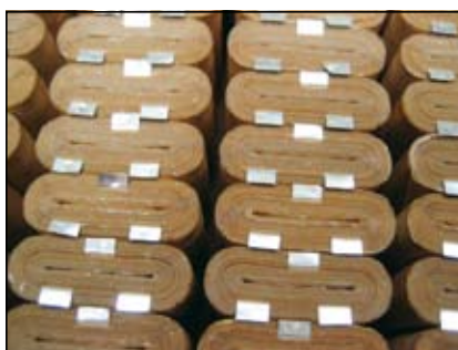
Slika 2. Zvitki z oblikovanimi kontakti, zloženi v okvir

Obstajata dve različni višini zvitkov in množica različnih premerov, od D = 19 do 28 mm premera. Na nazivni premer zvitka ima velik vpliv tudi toleranca debeline papirja, saj se