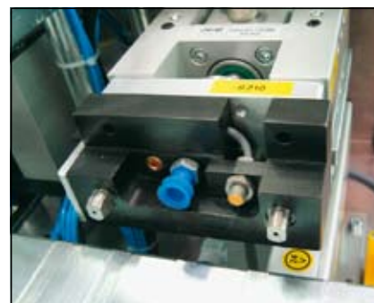
Slika 13. Enota za stiskanje okvira – stiskalnica

Slika 13 prikazuje čelo stiskalnice z opremo (zatičema za pozicioniranje prečke, senzorjem ter vakuumskim prijemalom).