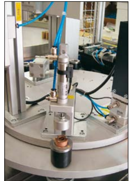
Slika 7. Enota za ravnanje kontaktov

Slika 7 prikazuje enoto za ravnanje kontaktov, ki kontakte dodatno poravnava v vodoravno lego.