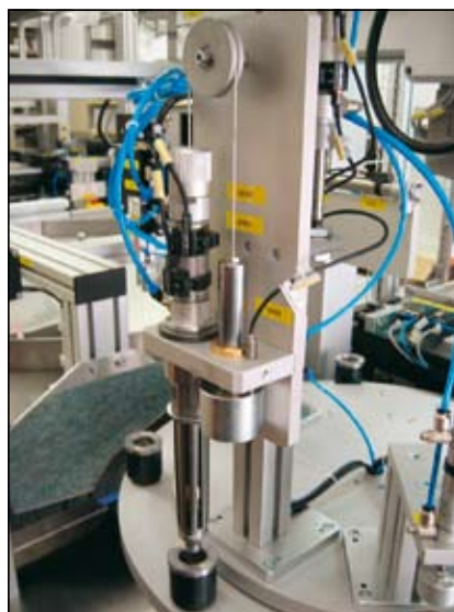
Slika 6. Enota za upogibanje kontaktov

Vzmetni prsti naležejo na zvitek, ga po potrebi potisnejo na dno vpenjala ter končno razprejo prste in prepogne kontakte.