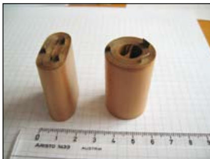
Slika 1. Zvitek

Obstajata dve različni višini zvitkov in množica različnih premerov, od D = 19 do 28 mm premera. Na nazivni premer zvitka ima velik vpliv tudi toleranca debeline papirja, saj se