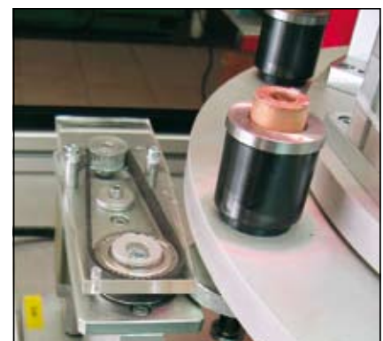
Slika 8. Orientacija in optična kontrola zvitkov

Pri izdelavi enote za orientacijo in kontrolo zvitkov sta bili dve možnosti: