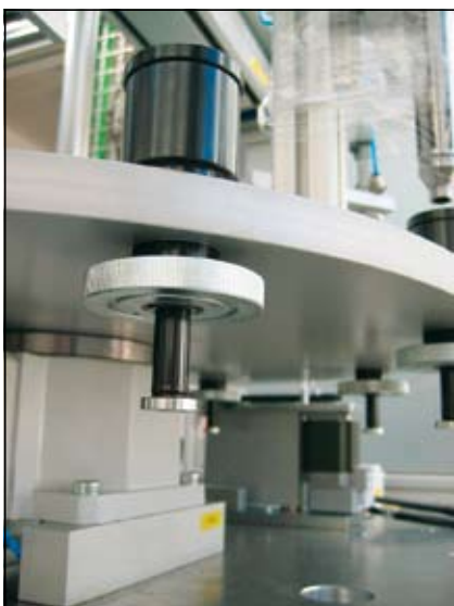
Slika 5. Vpenjalo

sport zvitkov od navijalnih strojev do montaže. Zaradi občutljivosti kontaktov na zvitkih morajo biti zvitki med transportom v pokončni legi. Pokončni položaj zvitkov zagotavlja, da se kontakti med transportom ne skrivijo oziroma poškodujejo. Kontakti so izdelani iz 0,03 mm debele pokositrane medenine. Zato so tudi pri avtomatiziranem postopku zvitki v pokončnem položaju.