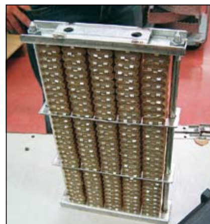
Slika 12. Okvir z zvitki (spodnja prečka s stojnima vijakoma, dve vmesni pregradi in zgornja prečka z dvema maticama)

Prvotno so bili okviri namenjeni za ročno delo in morebitne geometrijske nepravilnosti niso bile moteče. Pri avtomatiziranem postopku smo se morali čim bolj prilagoditi obstoječemu stanju, saj ima investitor preko 1000 okvirov in bi bila zamenjava le-teh prevelik strošek.