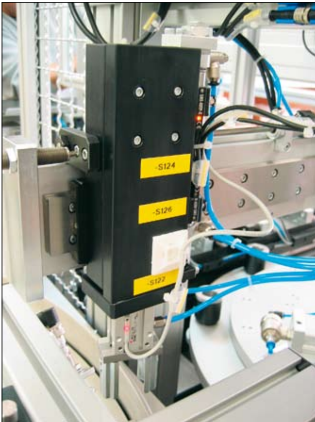
Slika 4. Dvoosni manipulator

sport zvitkov od navijalnih strojev do montaže. Zaradi občutljivosti kontaktov na zvitkih morajo biti zvitki med transportom v pokončni legi. Pokončni položaj zvitkov zagotavlja, da se kontakti med transportom ne skrivijo oziroma poškodujejo. Kontakti so izdelani iz 0,03 mm debele pokositrane medenine. Zato so tudi pri avtomatiziranem postopku zvitki v pokončnem položaju.