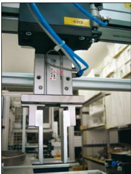
Slika 9. Dvoosni robot s kleščami

Slika 9 prikazuje robot X-Y s pnevmatično Z-osjo, z dvema višinama in kleščami. Klešče s podaljšanim hodom so izdelek firme SMC.