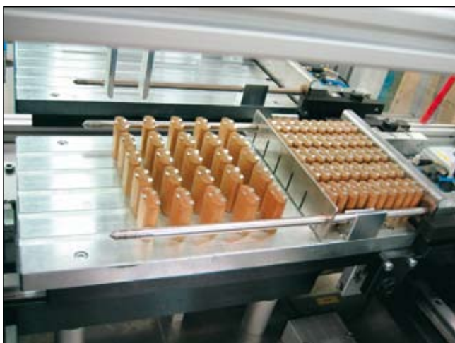
Slika 10. Nihajna miza z dvema montažnima ploščama

Slika 10 prikazuje nihajno mizo z dvema montažnima ploščama. Na ploščo, ki je trenutno v srednjem položaju, robot naklada zvitke.