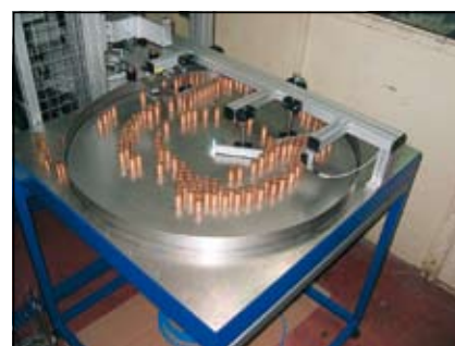
Slika 3. Krožni dodajalnik

Krožni dodajalnik je skonstruiran in izdelan »doma«. Posebnost tega dodajalnika je ravna rotirajoča plošča (ni vibracijski dodajalnik), ki s pomočjo usmerjevalnih elementov pripelje obdelovance na točno določeno mesto, od koder jih pobira manipulator.