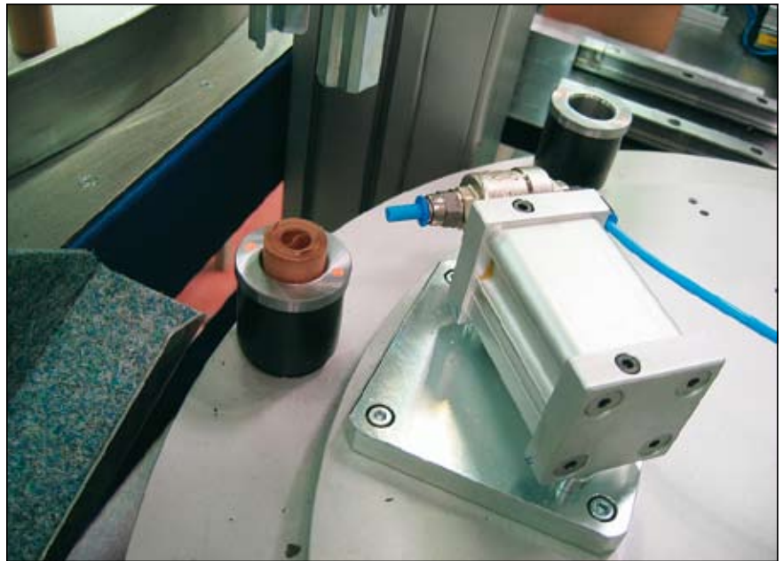
Slika 14: Odpihovanje neustreznih zvitkov

Obljubljene takt 4 sekunde za kos smo presegli: končni takt je bil 2,7–2,8 sekunde za kos oziroma 7 minut za okvir (140–180 zvitkov).