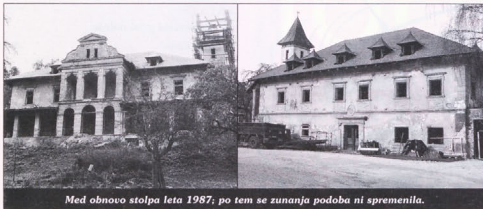
Med obnovo stolpa leta 1987; po tem se zunanja podoba ni spremenila.