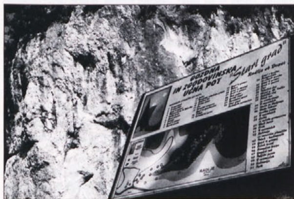
To je vabilo, posebej lepo je sedaj, ko je pomlad

Radljičani imajo eno od bolj zanimivih gozdnih učnih poti. Le redko se zgodi, da se zgodovina, gozd in sama narava tako trdno stikajo. Ne samo 51 zanimivosti, ki pritegnejo še najzahtevnejšega biologa ali navadnega popotnika, učenca, ali rekreativnega sprehajalca. Za vse je radeljska učno-zgodovinska pot primerna.