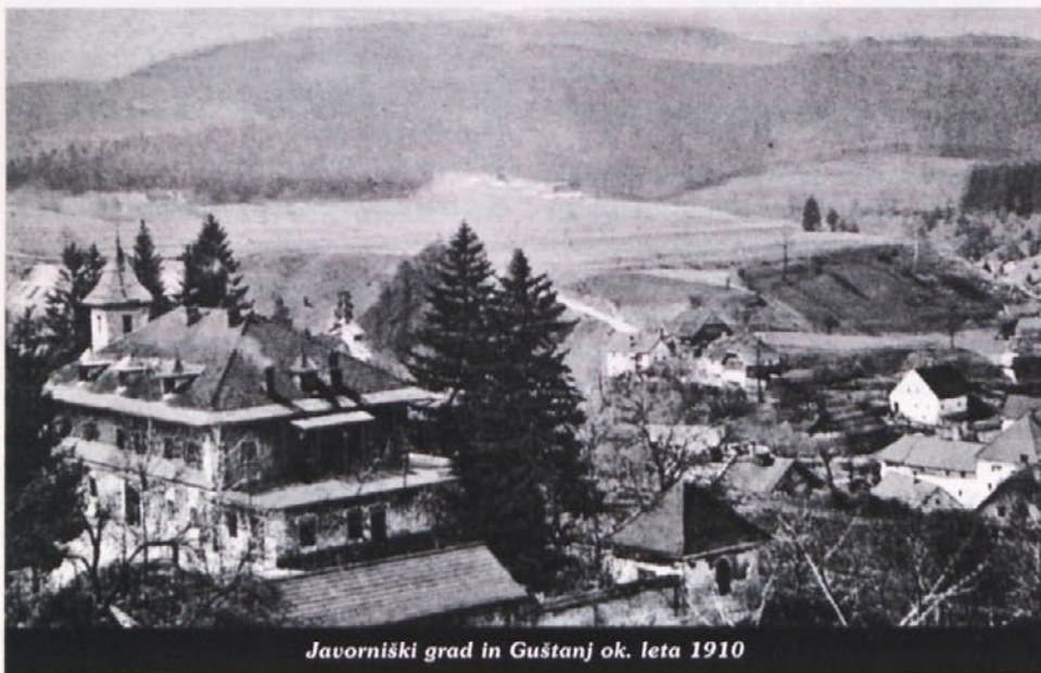
Javorniški grad in Guštanj ok. leta 1910

Javorniški dvorec leži na imenitni legi nad ravenskim trgom. Vsem na očeh. Domačini smo se nekako že navadili na njegov izgled, obiskovalca ali popotnika pa takoj zmoti pogled na sicer lepo, a času neprimerno oskrbovano stavbo na samem robu stanovanjskega naselja Javornik. Stavba je brez oken, zunanost vidno prepuščena propadanju.