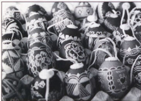
Na pisankah je še ostal dih daunine

Tisto nedeljo je bil doma za varuha, kot rečejo, le kakšen človek. Vse drugo je bilo zbrano v Osnovni šoli na Ojstrici. Tokrat je bila premala. Mnogi so stopali na prste še pred vrati, da bi ujeli kanček pestrega domačega programa, črtico ali pesem domačih ustvarjalcev, ali melodijo, ki so jo zapeli domači pevci ob spremljavi harmonike.