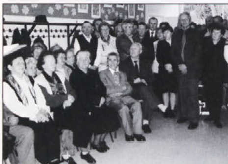
Bil je velik kulturni praznik - pravi festival