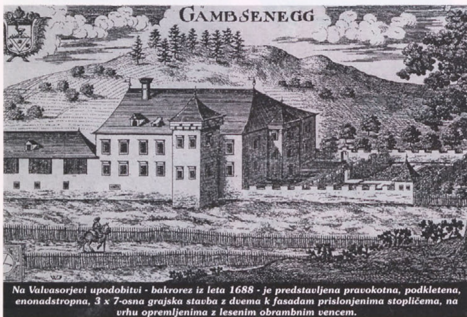
Na Valvasorjevi upodobitvi - bakrorez iz leta 1688 - je predstavljena pravokotna, podkletena, enonadstropna, 3 x 7-osna grajska stavba z dvema k fasadam prislonjenima stolpičema, na vrhu opremljenima z lesenim obrambnim vencem.