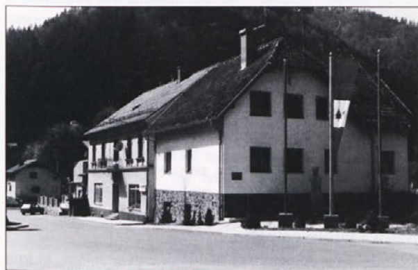
Upravičen ponos - urejenost

Le tisti, ki so jim poznane razmere, in tisti, ki znajo opazovati, trdijo, da je le malokatera od množice teh novih občin naredila tolikšen napredek, kot so to uspeli v Podvelki. Je že res, da jim kaj rado zaškriplje v dejavnosti gospodarstva, da jim gre trdo za delovna mesta - torej za kruh.