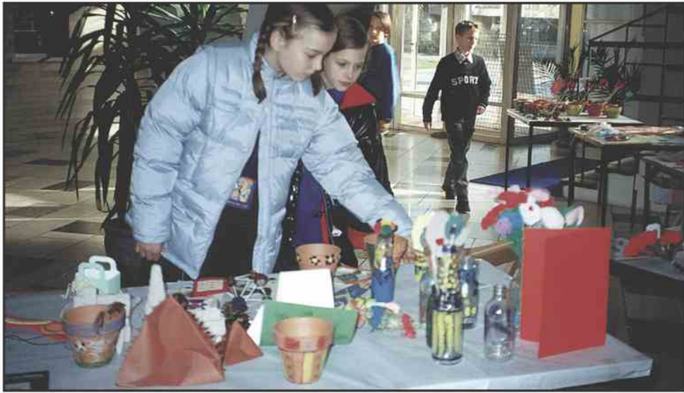
Stojnice na prvem novoletnem bazaru so se hitro praznile...