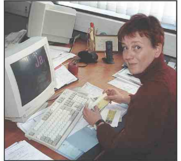
Ja, štejemo.

Nam tole 2000 mineva zelo hitro. Včasih bi si želeli, da bi šlo počasneje, pa teh naših želja čas ne jemlje resno. ■