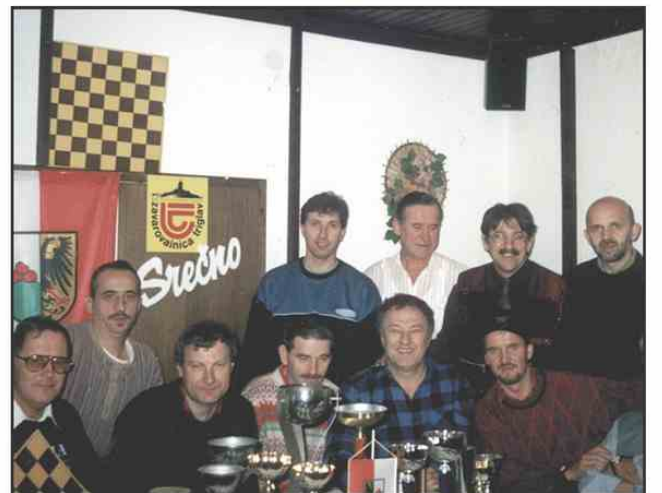
Zadovoljni s četrtim mestom

Na klubskem hitropoteznem turnirju je oktobra zmagal Šumnik pred Čulkom in Stropnikom. Šumnik je bil najboljši tudi na novembrskem turnirju, drugi in tretji pa sta bila Kovač in Stropnik. ■ G.R.