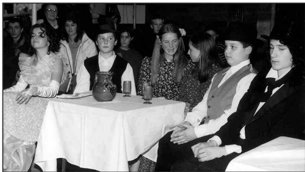
Čas v katerem je živel Prešern je bil v marsičem drugačen od tega, ki ga živimo danes.

"Ker pa je mesec december praznični, smo želeli tudi posamezne besede iz Prešernovih pesmi obelodaniti. Izigibanje prepiru, iskanje