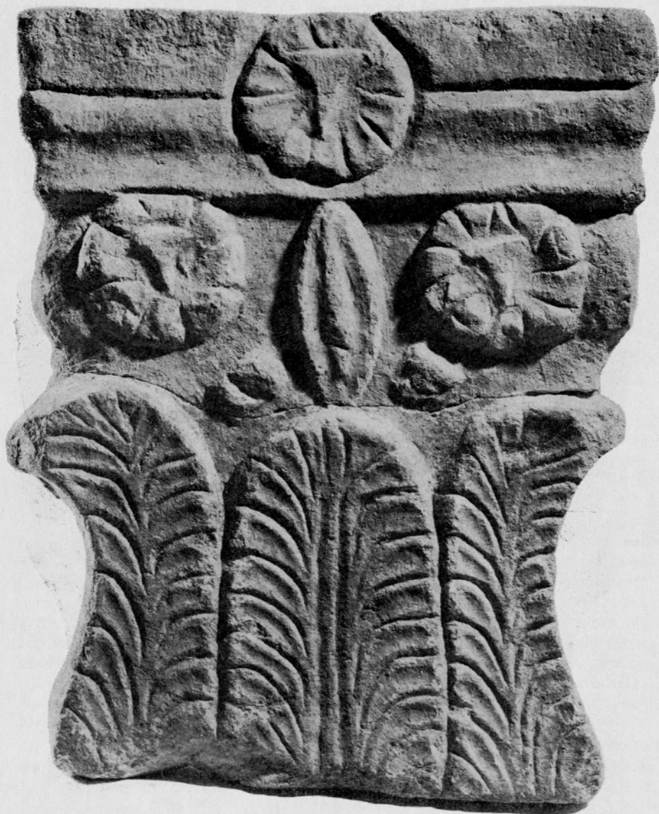
Sl. 2. Ljubljana, Ferantov vrt (Gradišče 14) — insula XX. Kapitel pilastra Fig. 2. Ljubljana, le jardin de Ferant (Gradišče 14) — insula XX. Chapiteau d'un pilastre