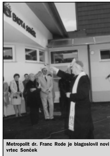
Metropolit dr. Franc Rode je blagoslovil novi vrtec Sonček

Ali pa naslednji primer: "Ja bova pa kar na klopi v vrtcu počakala, da pride otroku zelena strokovna delavka v službo". Vsi, ki delamo v vrtcu smo strokovno usposobljeni, da poskrbimo za vsakega izmed vpisanih otrok. Straši pa si morajo ustvariti tudi v predšolskem obdobju doma tako avtoriteto, da njihova odločitev drži; kar pomeni, da če so se starši odločili za vrtec, potem morajo upoštevati, da je vrtec lahko odprt od 6.30 ure zjutraj do 16.30 ure popoldne brez dodatno zaposlenih delavk edino tako, da prihajajo strokovne delavke na delo z zamikom, da so skupine združene in otroke sprejemajo glede na umik otroških prihodov v vrtec različne osebe. Skozi delavnice, ki so potekale v Tednu otroka, otroci spoznajo strokovne delavke tudi z drugega zornega kota; ne vedno v smislu, ta je pa tista, pri kateri počakam, da se vrata v mojo skupino odprejo. Vse skupine so namreč odprte ob 7.uri