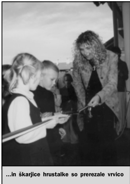
...in škarjice hrustalke so prerezale vrstico