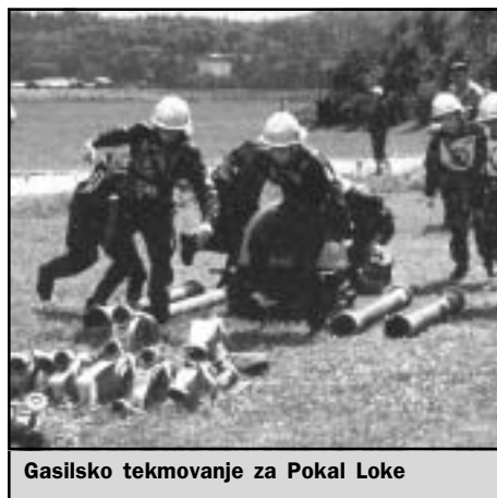
Gasilsko tekmovanje za Pokal Loke

Ena od teh je leta 1996 ustanovljena športna sekcija, ki je delovala v okviru KD Antona Lobode. Ker so okoliščine pokazale, da bi bilo potrebno zgraditi večjo ploščad, ki bi omogočila razvoj večjih športov (takrat je ekipa malega