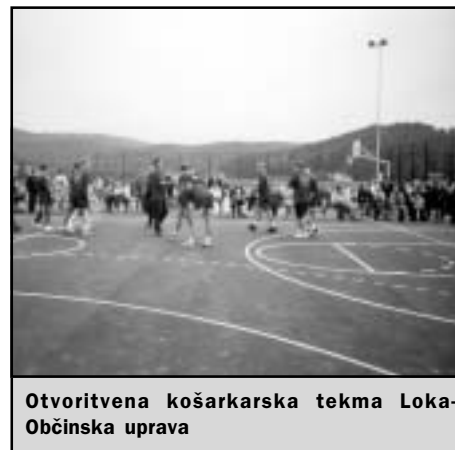
Otvoritvena košarkarska tekma Loka-Občinska uprava

Štebetu nekoliko boljšega sogovornika, vendar je bil kljub temu potreben celoten mandat, da so bili s sprejetjem Ureditvenega načrta Loke pri Mengšu (2002) dani vsi pogoji za odkup zemljišča in s tem pridobitev ustrezne gradbene dokumentacije. Omenjeno društvo je v teh letih pogajanj doseglo, da se je v idejni projekt vneslo še odbojgarsko igrišče na mivki.