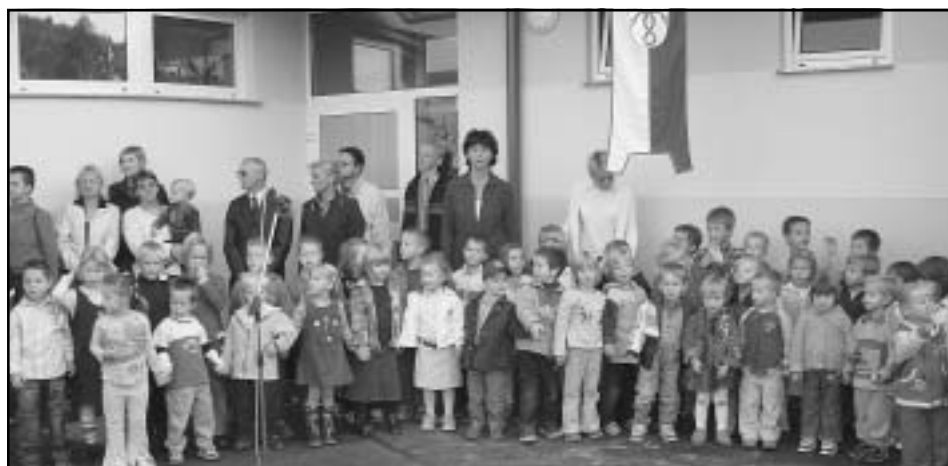
Naša četica koraka... v nov vrtec