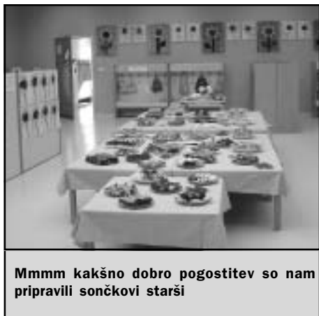
Mmmm kakšno dobro pogostitev so nam pripravili sončkovi starši