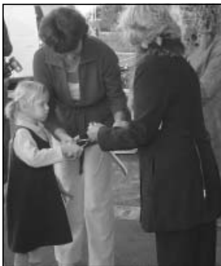
Pa še nekaj trakcev za spomin