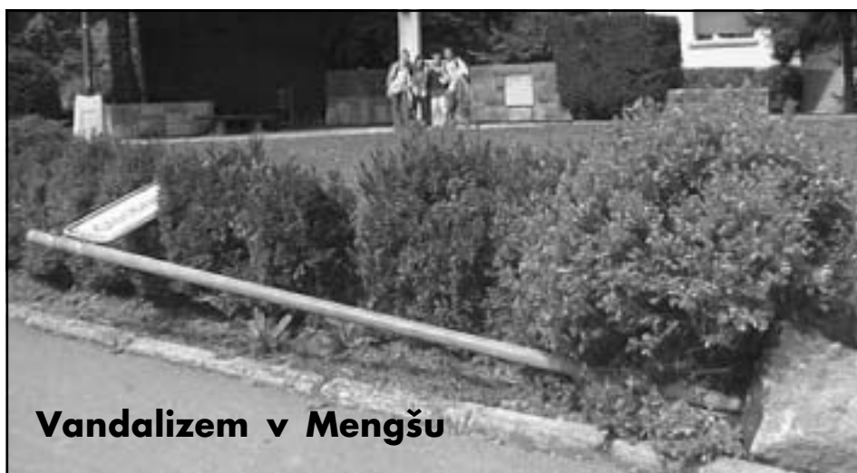
Vandalizem v Mengšu