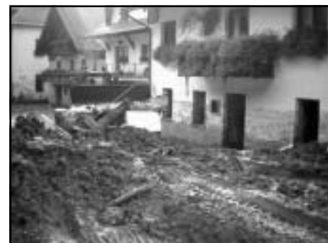
Zasuta cesta in objekti