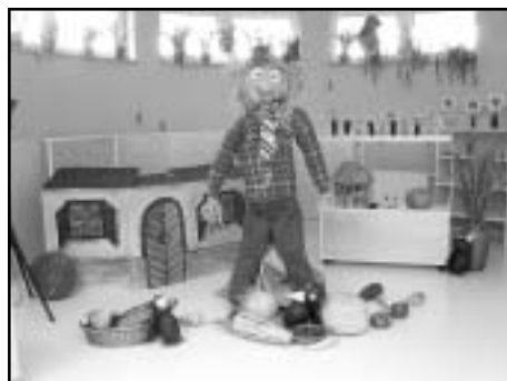
Strašilo ni prestrašilo nobenega od obiskovalcev novega vrtca Sonček

Ustreči željam staršev po daljšem odprtju obeh enot je velika umetnost. Ljudje, ki v vrtcu še nikoli niso delali imajo nad porabo občinskih sredstev za vrtec zelo veliko pomislekov, pač tega ne zmorejo in ne znajo razumeti; to nam je zaposlenim v vrtcu v večini slovenskih občin vsako leto bolj jasno.