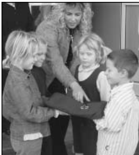
Rezanje traku je pripadlo najmlajšim prebivalcem vrtca...