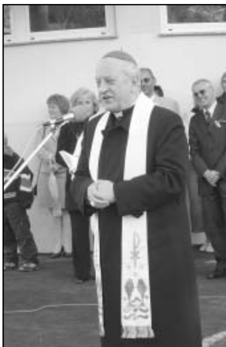
Metropolit dr. Franc Rode je poudaril pomembnost vzgoje v vrtcu