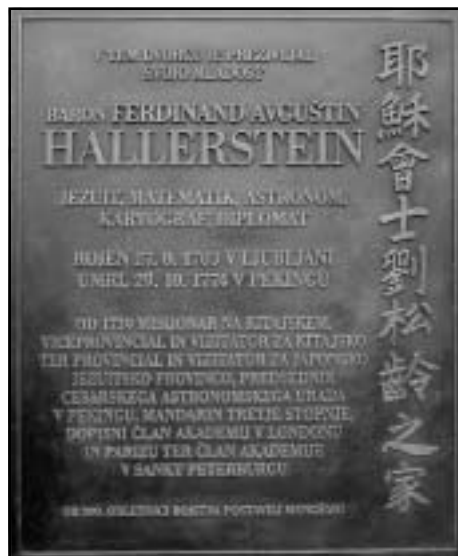
Bronasta spominska plošča A. Hallersteinu na Zgornjem ali Ravbarjevem gradu v Mengšu, ki jo je v počastitev 300. obletnice njegovega rojstva postavil Muzej Mengeš, da zapolni eno od pomembnih vrzeli v slovenski kulturni in znanstveni zgodovini.

obiskati Mengeš in si ogledati Hallersteinovo spominsko ploščo na njegovem domu. Sprejema v Levu smo se udeležili skupaj z lastnikom firme SimpS, ki je zelo pomemben sponzor Muzeja Mengeš. Vzpostavljati pomembne gospodarske stike z drugimi državami je gotovo sestavni del dejavnosti kulturnih institucij še posebno pa, če to gospodarstvo s kulturnimi institucijami sodeluje. Muzej Mengeš uresničuje take programe, ki tako kvalitetne mednarodne stike omogoča. Na sprejemu smo poleg predvidenega protokola bili deležni še posebne pozornosti. Sprejel nas je posebej veleposlanik s sodelavci,