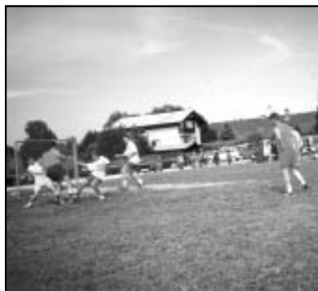
Tradicionalno nogometno srečanje Loka-Ivančna gorica