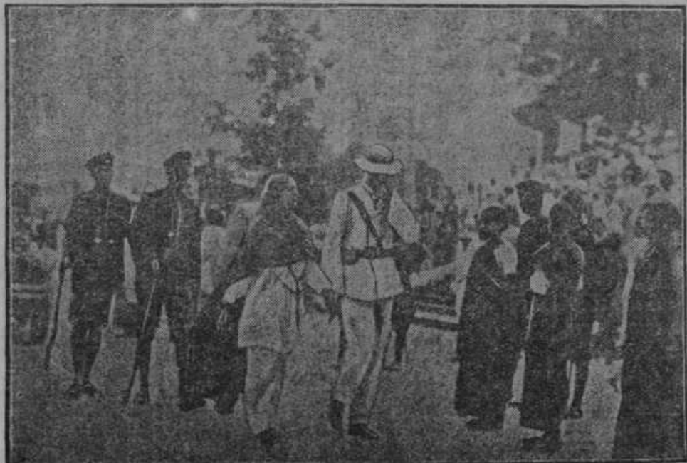
Aretacija indijske boriteljice za svobodo od angleške policije v mestu Bombay.