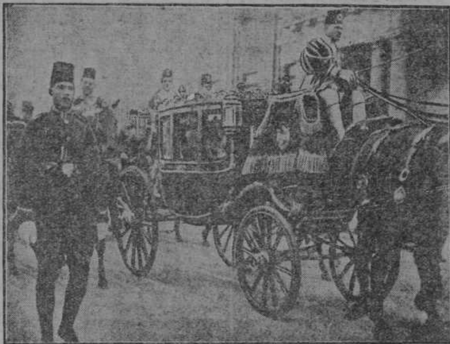
Kralj Egipta Fuad se pelje k slovesni otvoritvi parlamenta.