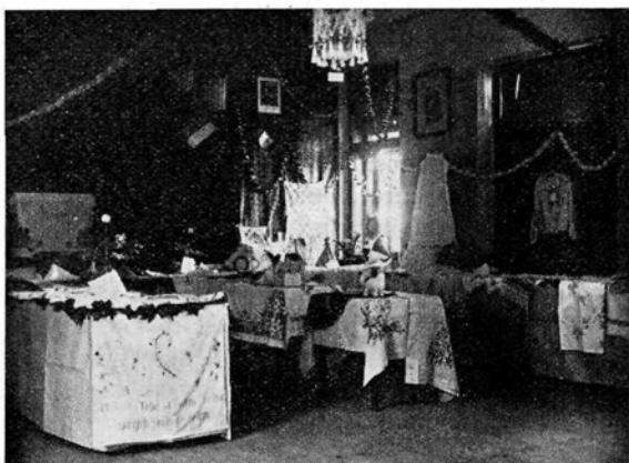
Razstava ženskih ročnih del na Hajdini

20. junija je pa priredil prireditveni krožek slavnostno akademijo v proslavo sv. Alojzija, krstnega patrona domačega č. g. župnika Skuhala — duševnega vodja naše K. Ž. Z. Med raznimi točkami (bilo jih je 16 po številu), bi se pač najbolj odlikovale sledeče: pozdrav sv. Alojziju, v katerem je desetletna deklica opevala čednosti sv. Alojzija in ga prosila v imenu svojih sovrstnic, naj jim izprosi vsem »večno lepoto in večno mladost«. Mladdenke so izvajale bajeslovno igrico »V kraljestvu rož«. Dekliški pevski zbor pa spevoigro »Na izletu«. Dekleta so vprizorila igro »Angelček varuh moj« v treh dejanjih. Igra je socialnega značaja in jo je spisal domači g. župnik. Pri jutranji sv. maši, zjutraj tega dne pa so dekleta na pobudo predsedstva Zveze v obilnem številu pri-