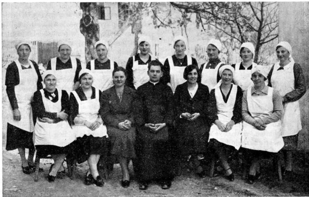
Tečajnice gospodinjskega tečaja na Breznici.

»Po trnju do cvetja« iz letošnje »Vigredi«, ki smo jo tudi ponovile. Po dvanajstih tednih dela in učenja smo tečaj zaključile z lepo razstavo, ki je bila na Markovo nedeljo. Ta je nad vse presenetila občinstvo, ki kar verjeti ni moglo, da se dá v tako kratkem času doseči tako lepe uspehe. Tu si lahko videl vsakovrstna ženska ročna dela: od zakrpanih nogavic do nove obleke in lepo vezenih namiznih prtov, od domačih žgancev in zelja do raznega peciva, ki mu še imena nisi vedel. Razstavo je obiskalo veliko število ljudi, ki je niso samo hvalili, ampak tudi še pred zaključkom pokupili razstavljene »sladkosti«. Tečajnice so priredile ta dan tudi poslovljni večer, na katerega so povabile svoje mamice in dobrotnike tečaja. Večer je minil ob prijetnem kramljanju in posebno nam bodo ostale v spominu besede o velikem pomenu dobre matere in skrbne gospodinjice v družini in za človeško družbo. Zahvalo smo dolžne posebno gđ. Fr. Žitkovi, ki je tako vestno vršila svojo dolžnost. Znala je dekleta pripravljati s silno potrpežljivostjo in materinsko ljubeznijo na njihov življenjski poklic. Tudi vsem ostalim predavateljem in dobrotnikom najlepši: Bog plačaj! Končno čutimo dolžnost, da se zahvalimo Kršč. ženski zvezi, ki nam je tečaj