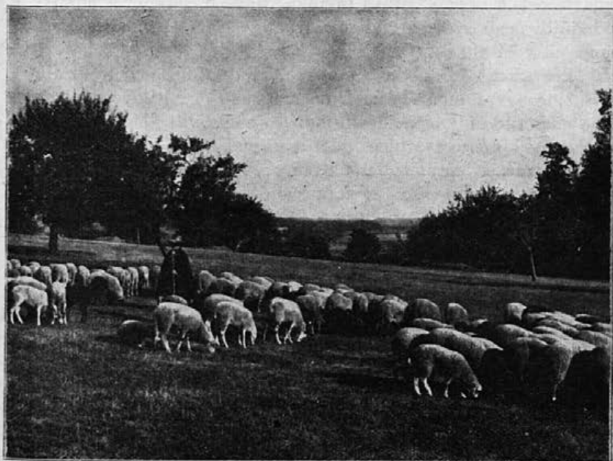
V logu že pastir — poje v tihi mir ...