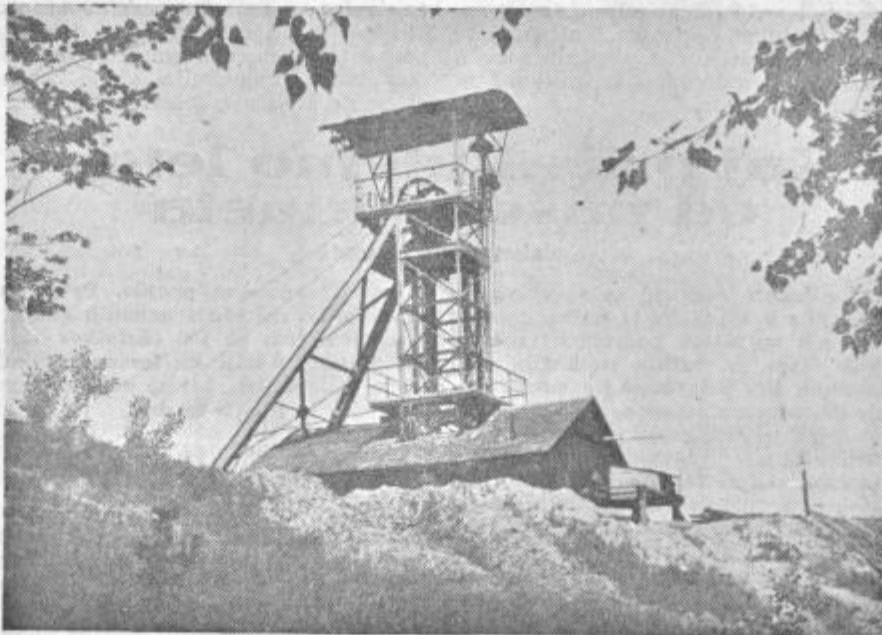
Stolp nad jaškom rudnika Zabukovca.

slovanju mesnic že dolge mesece piše naš tisk — s kategorizacijo mesa se bo morda stanje nekoliko izboljšalo, vendar še vedno ostane dejstvo, da tem podjetjem tudi potrošniški sveti zelo težko pridejo do živoga. Zato so tudi na nedavnem posvetovanju zastopniki sveta potrošnikov obširno razpravljali o tem vprašanju. Bili so mnenja, da bo v mesarijah uspešna družbena kontrola šele tedaj, če bodo dobili človeka, ki bo imel dovolj časa, da bo mesarja kontroliral od nakupa živine pa do prodaje mesa. (Nadaljevanje na 3. strani)