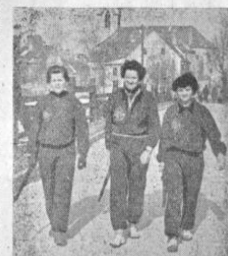
V strelski družini »Tempo« je včlanjen tudi precej žena in deklet. Na sliki vidimo žensko trojko v patrolnem teku za dan JLA čez stari celjski most.

Oglejte si našo bogato zalogo vseh vrst pohištva! Prepričajte se o naših brezkonkurenčnih cenah! Zadovoljni boste z našo posrežbo!