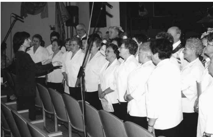
Gostje našega koncerta