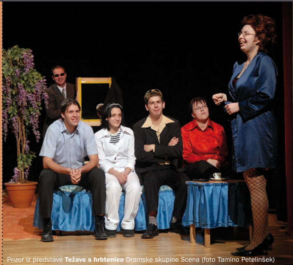
Prizor iz predstave Težave s hrbtnico Dramske skupine Scena

Zveza kulturnih društev Občine Dobropolje