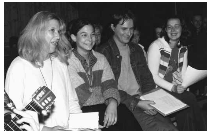
Na slikah zgoraj in spodaj levo: Nekaj utrinkov z zadnjega večera poezije v koči pri Koritu, v Podgori