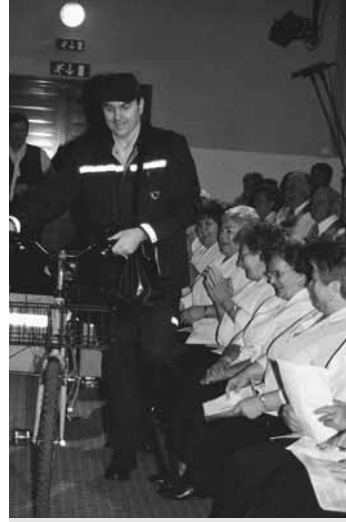
Brez PTT pa seveda ne gre