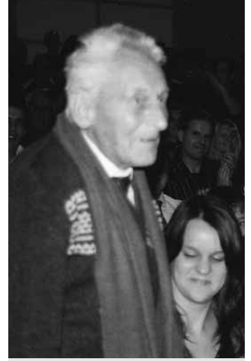
Najstarejši navijač godbe