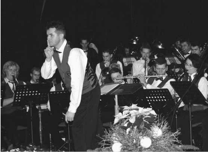
Neutrudni predsednik miri občinstvo

Za nami je še en tradicionalni božično novoletni koncert, ki se je tako kot vsako leto zgodil na Štefanovo, 26. decembra 2006 v dvorani Jakličevega doma. Prvo priznanje za svoje delo smo godbeniki dobili že ob pogledu na nabito polno dvorano, kar je na našem koncertu tudi že stalnica. Program je povezoval Igor Ahačevčič.