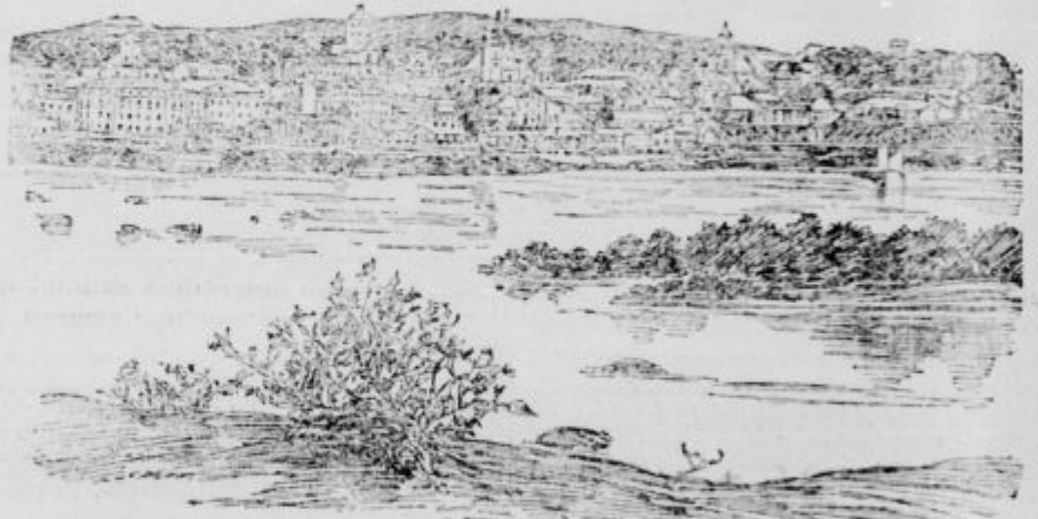
Pogled na Przemysl.

44.000 mož pehote in topništva, po 2 tretjini črnovojniških čet, od tega je odšteli 10.000 mož izgub ob priliki zadnjega izpada 19. marca, 45.000 mož na podlagi zakona o vojnih dajstvih vpo-klicanih in v vojaški oskrbi se nahajajočih delavcev, voznikov, konjskih hlapcev, nadalje železniškega in brzojavnega osebja; končno 28.000 mož bolnih in ranjenih v bolniški oskrbi. Trdnjava je bila v splošnem oborožena s 1050 topovi, od tega glavni del popolnoma zastaranih vzorcev iz leta 1861 in 1875, kateri so bili tudi uravčasno razstreljeni. Zadnji ruski napadi v noči od 21. do 22. marca so bili odbiti, ker so bili topovi večinoma že razstreljeni, s pehoto in strojnimi puškami, kakor tudi z nekaterimi še ne razstreljenimi topovi vzorca leta 1861.