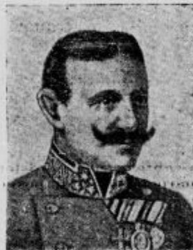
Branitelj Przemysla general Kusmanek.

Na prostoru za zrakoplove sta se nahajala samo dva zrakoplova. Rusi so obmetovali ta prostor s šrapneli. Takrat pa sta se dvignila oba zrako-