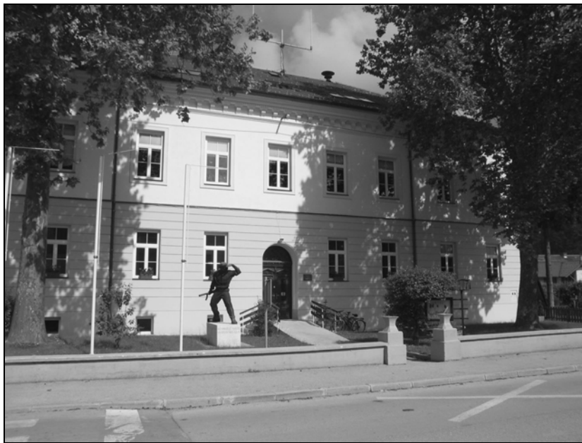
Okrajno sodišče na Vranskem.