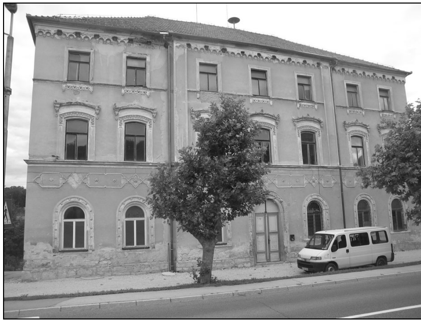
Okrajno sodišče v Šmarju pri Jelšah.

okrožno sodišče v Celju. Med nemško okupacijo je bilo ukinjeno. Ponovno je bilo ustanovljeno 1. aprila leta 1943 s podružnico v Rogatcu. Na sedežu ukinjenega sodišča v Rogatcu so bili uvedeni sodni dnevi. Uradno je bilo ukinjeno leta 1945.