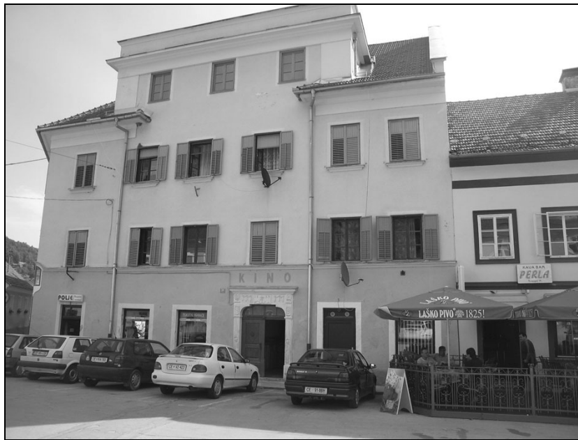
Okrajno sodišče v Kozjem.