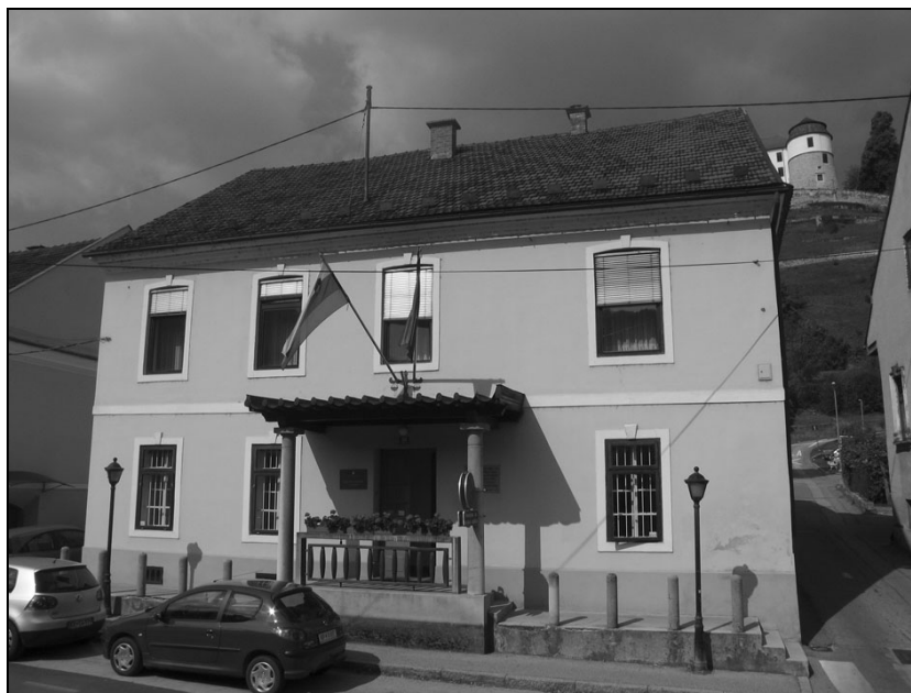
Okrajno sodišče v Sevnici.

Untersteiermark, der Beauftragter für die Zivil Rechtspflege, Dienststelle Cilli, nazadnje pa »Gericht in Cilli«. Opravljal je sodne postopke v civilnih in kazenskih zadevah na prvi stopnji, postopke na drugi stopnji pa v Mariboru, na tako imenovanem » Rechtsmittelstelle in Marburg «.