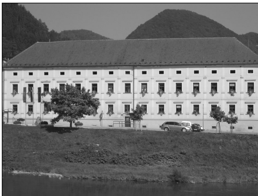
Okrajno sodišče v Laškem.

Sodni zapori so bili v stavbi na dvorišču iste zgradbe, v njenem vzhodnem delu. Ta del je bil poškodovan v bombnem napadu, zato so bili zapori povsem neuporabni. Od leta 1943 dalje jih niso uporabljali, ker so bili zgrajeni novi sodni zapori v Trbovljah.