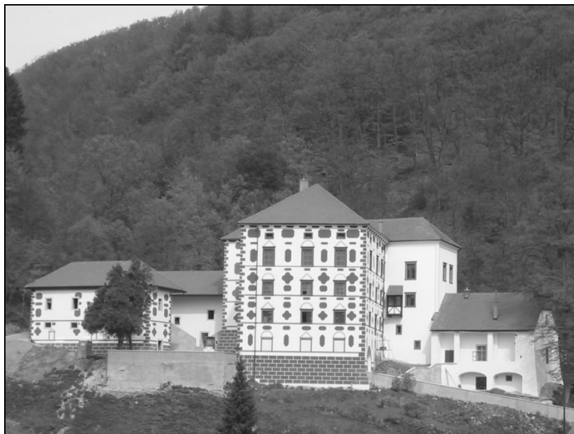
Okrajno sodišče v Rogatcu.

Od inventarja se je ohranilo le pet omar, nekaj stolov in miz ter nekaj polic za spise. Del opreme je bilo odpeljane v Šmarje pri Jelšah, med drugim tudi inventar zemljiške knjige.