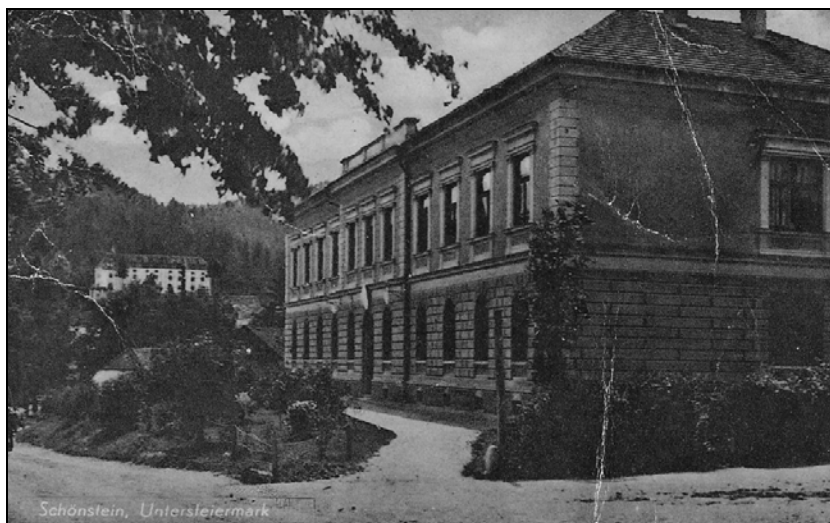
Okrajno sodišče v Šoštanju.

Inventar sodišča je bil prepeljan v prostore Celjske posojilnice in nameščen v dve sobi. Te prostore je 15. maja 1945 zaplenila vojaška komanda in izročila ključe Narodni zaščiti.