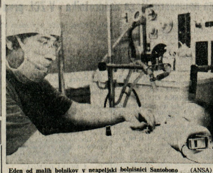
Eden od malih bolnikov v neapeljski bolnišnici Santobono