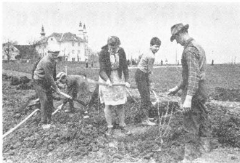
Učenci so pridno zasajevali nove nasade. Posnetek iz Gradišča.

zgrešile osnovni namen proizvodnega dela. Nasploh so ugotovili, da so bila delovna mesta dokaj dobro izbrana in da so učenci spoznali ves delovni proces. Zlasti so se v tem pogledu potrudili v tovarni usnja. V domača vseh podjetjih, kjer so učenci delali so ugotovili, da so bili vestni in izredno disciplinirani. Ponekod so jih zato tudi nagradili. Vendar individualne nagrade niso najbolj primerne, zlasti ne take, ki niso za praktično rabo. S pripravami na proizvodno delo ob zaključku prihodnjega šolskega leta bo potrebno začeti že z novim šolskim letom. Tako bo delo načrtno in se bodo nanj pripravila tudi podjetja. Dobro bi bilo, da bi učenci že vnaprej vedeli v katerem podjetju bodo delali in med letom spoznavali njihovo problematiko. Zato naj bi hodili tudi na zasedanja delavskih ali združinskih svetov. Pred začetkom dela bi kazalo imeti tudi posvet z zastopniki podjetij in krajevnih organizacij, ki naj bi poskrbeli za kar najboljši potek proizvodnega dela.