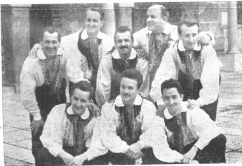
Člani koroškega akademškega okteta.

Šolska vrata se bodo torej zaprla, učenci in učitelji pa bodo odšli na zaslužni oddih. Seveda ne vsi: osmošolce čakajo naporni in zahtevni izpiti, nekatere učitelje pa seminarji in tečajji, na katerih bodo poglobili svoje znanje. Čakajo tudi zgradbe! Žal da letošnja proračunska situacija njim ne obeta kaj prida in bo potrebno večje investicije, ki so jih šole predvidevale v začetku leta, odložiti na prihodnje leto. Letos so šole sicer dobile večja sredstva za materialne stroške, treba jih bo pa pametno uporabiti, da bo doseženi učinek čim večji. Tu čaka šolske odbore odgovorna naloga, če hočemo, da bodo v jeseni naši razredi pripravljeni za novo šolsko leto.