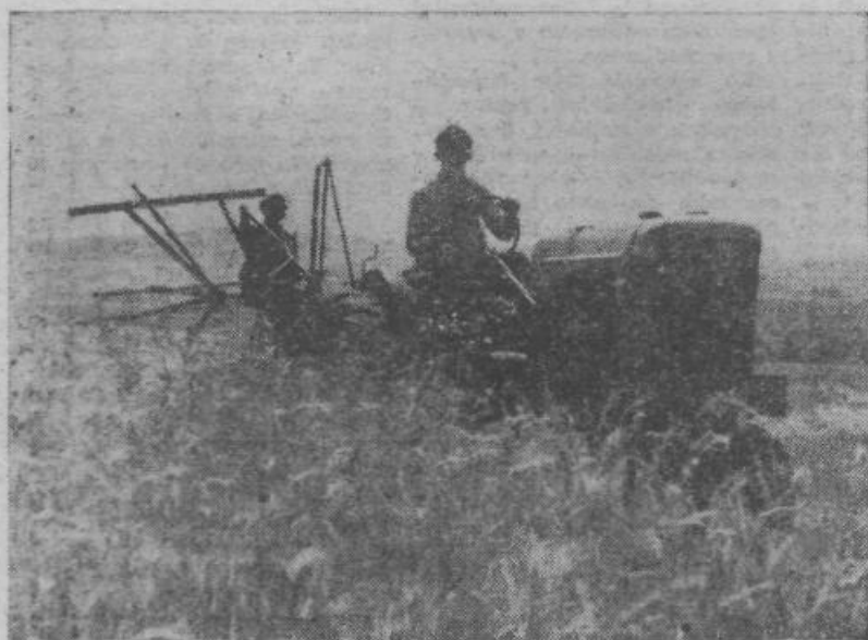
S kmetijskimi stroji si prizadevamo dvigniti družbeno proizvodnjo v kmetijstvu. Zato daje družba kupcem teh strojev regrese.